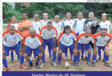
Equipe Master do Jd. Santana

e ficaram no empate por oito. Garantido na próxima fase também estão o Jd. Santana e o C. A. Itapeva, que chegaram aos dez pontos. Já Rosina, Juá, Luso e Colorado ainda lutam pelas duas vagas