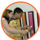
Centro de Autismo

:: ATENDIMENTO ABERTO AOS MUNICÍPIOS DE MAUÁ ::