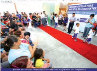
Alunas de escolas municipais receberam uniformes da Prefeitura