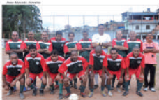
Equipe Master do Jd. Santana

está disputando um grande passo rumo à classificação. Enquanto isso, o União chegou aos cinco pontos, ficando com o terceiro posto. Já a outra agremiação invicta na chave, o Dragões Nova Mauá, venceu o Dinamo F. C. por 1x0, alcançando os quatro pontos, tendo um jogo a menos. Vice líder do grupo, o G. C. Jd. Archeta também