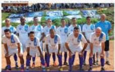
Equipe do Dinamo

No grupo B, a situação é mais equilibrada. Somente o Inter Serrano, com dois pontos, assegurou sua passagem à próxima fase. Os times do Jd. Estrela e do União também estão praticamente garantidos, precisando apenas de um empate para avançarem. Ouro Verde, Jd. Archeta, e