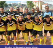
Equipe do Dragões Nova Mauá

Restarão apenas duas rodadas para o fim da primeira fase, a Copa