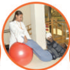
Centro de Medicina Física