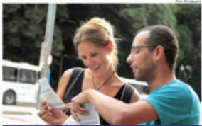
Transmissas na região do MASP receberam panfletos sobre a Carta de Terra