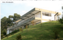
Parque do Grande ABC quer se tornar referência na região