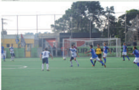
Com vitória, Mauaense assumiu a liderança do grupo 7 em 21 pontos.