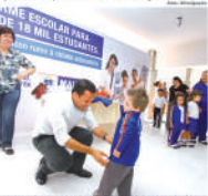
Lista de atividades extras para os crianças é extensa

Os esforços da administração municipal no sentido de consolidar Mauá como Cidade Educadora vão além. Em 2014, a prefeitura retomou a distribuição de uniformes escolares após cinco anos de ausência. A distribuição aos mais de 18 mil alunos de 39 escolas municipais traz vantagens de economia e segurança à comunidade esco-