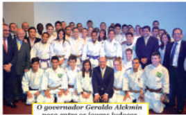
O governador Geraldo Alckmin posa entre os jovens judocas