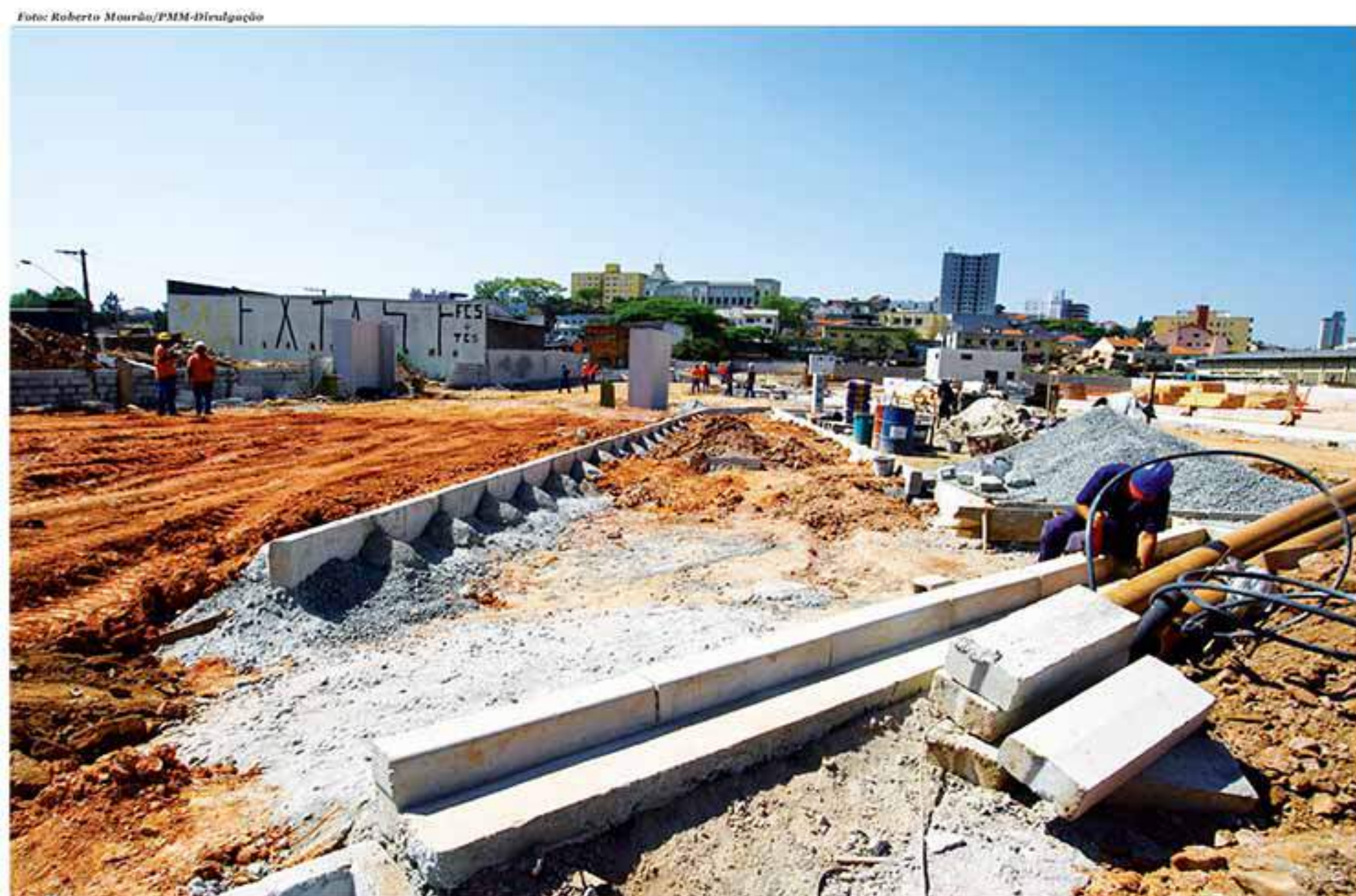
A Prefeitura cedeu o terreno de 10,8 mil metros quadrados localizado na região central, na Rua Cineasta Glauber Rocha, onde antes funcionavam as secretarias de Serviços Urbanos e Mobilidade Urbana

VENHA CONHECER A MELHOR ESTRUTURA DO ABC