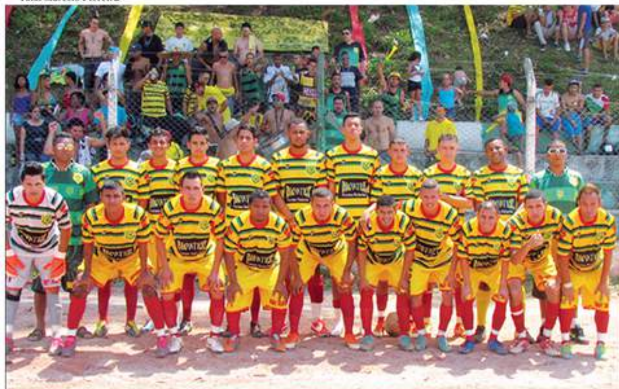
Equipe do Mary Jhames - Série Prata