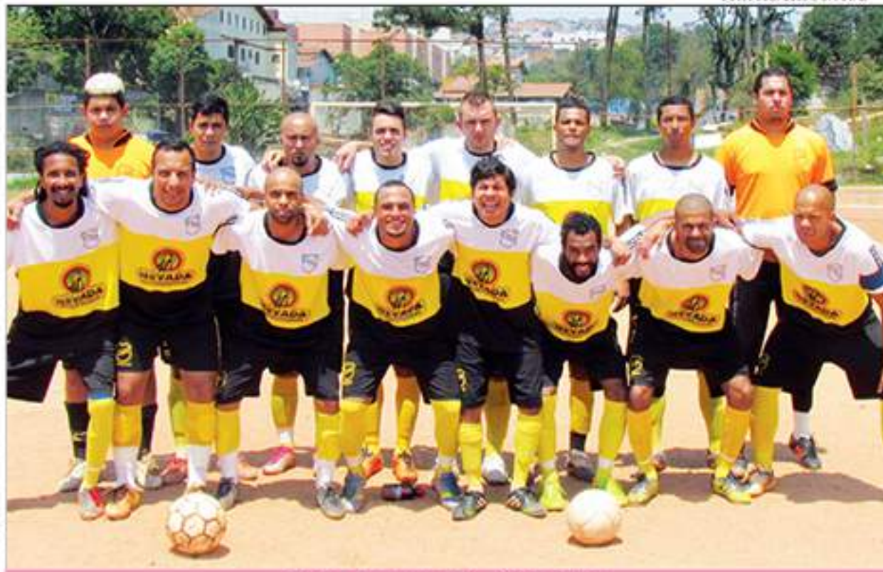
Equipe do Jaraguá - Série Prata