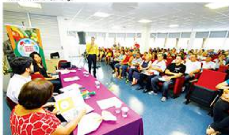
Comemoração da Semana da Alimentação começou com palestra no Centro de Formação Miguel Arraes