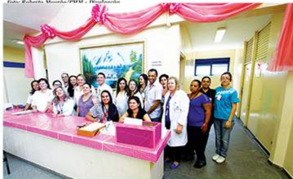
Unidades de saúde estão apoiando a campanha Outubro Rosa