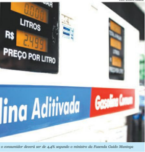
Aumento no preço da gasolina para o consumidor deverá ser de 4,4% segundo o ministro da Fazenda Guido Mantega

reajuste no preço dos combustíveis que causará impacto aos consumidores desde 2005, uma vez que o CIDE foi zerado o que impede a compensa-