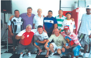
Comemoração do aniversário do Juá contou com a presença de dirigentes e ex-jogadores