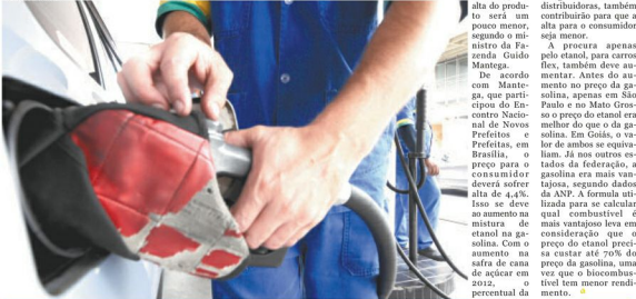
Alta nos preços do combustível aconteceu devido a defasagem em relação aos índices internacionais, segundo a Petrobras

A procura apenas pelo etanol, para carros flex, também deve aumentar. Antes do aumento no preço da gasolina, apenas em São Paulo e no Mato Grosso o preço do etanol era melhor do que o da gasolina. Em Goiás, o valor de ambos se equivalem. Já nos outros estados da federação, a gasolina era mais vantajosa, segundo dados da ANP. A fórmula utilizada para se calcular qual combustível é mais vantajoso leva em consideração que o preço do etanol precisa custar até 70% do preço da gasolina, uma vez que o biocombustível tem menor rendimento.