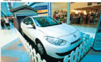
Vencedores da promoção "Sonho de Natal" levaram carros okm