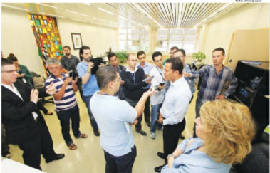
Em conversa com a imprensa local, prefeito de Mauá abordou diversos assuntos relevantes sobre a cidade