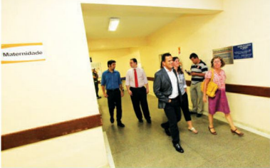
Hospital Nardini receberá verba proveniente de emenda da senadora Marta Suplicy para compra de equipamentos