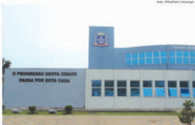
G-12 quer eleger no presidente da Câmara para biênio 2015-2016