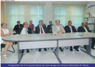
Composição do G-12 mostra força de novo grupo na Câmara Municipal de Mauá