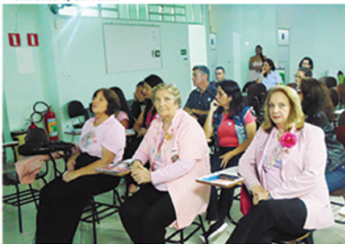
Voluntárias da REFEMA prestigiaram palestra organizada pela ProVitali