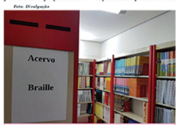
Biblioteca Cecília Meireles foi fechada por não haver verba para pagamento de aluguel