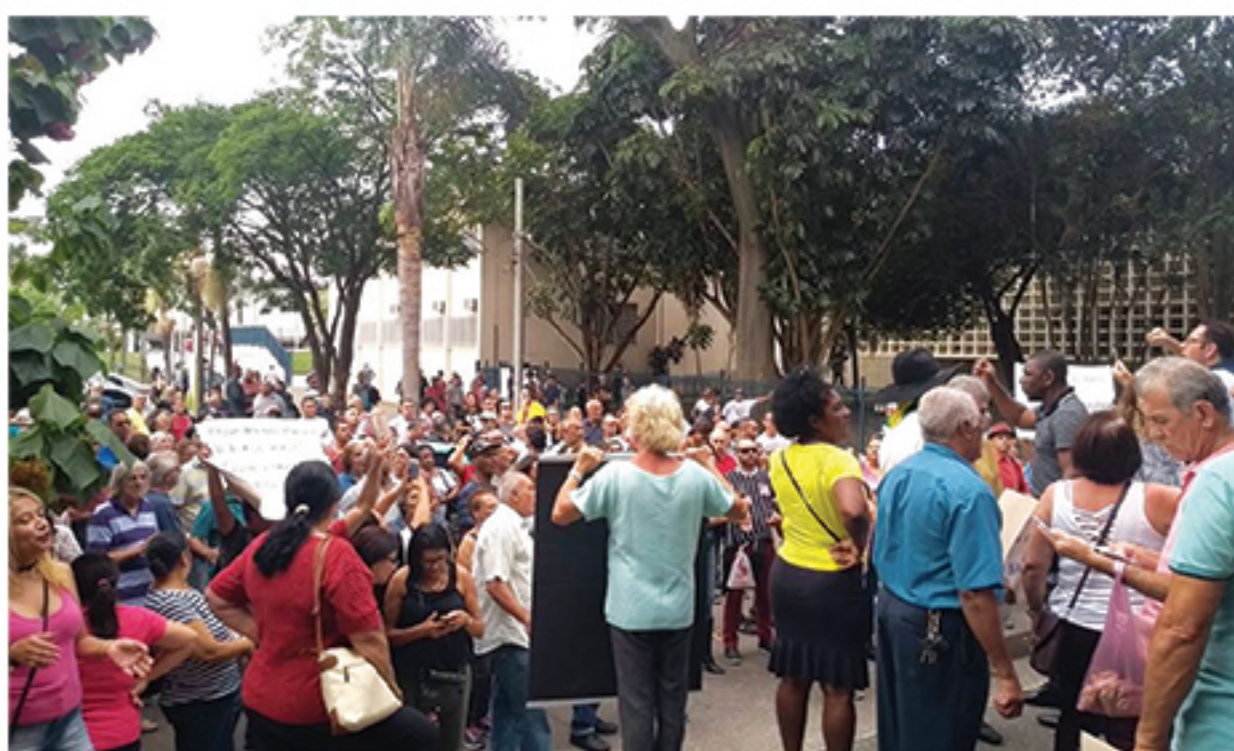
Protestos durante o mês de junho, como ilustra a foto, mostraram a insatisfação da população com o pagamento de mais um imposto na cidade. Mauaenses ainda pedem o fim da Taxa do Lixo

Perguntado se havia alguma possibilidade de diálogo com o Executivo, o vereador disse não acreditar nessa hipótese e criticou a forma como o projeto foi aprovado, nos últimos dias antes das Festas de Fim de ano. "Quando o Governo apresentou o projeto, não dialogou com ninguém, não fez a lição de casa para diminuir custos e sequer consultou a população. Não acho que será diferente", afirmou.