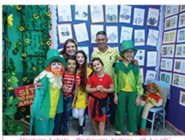
Monteiro Lobato - Professora Aretuza - 2ª A e 2ª C