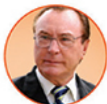
EX-PREFEITO LEONEL DAMO