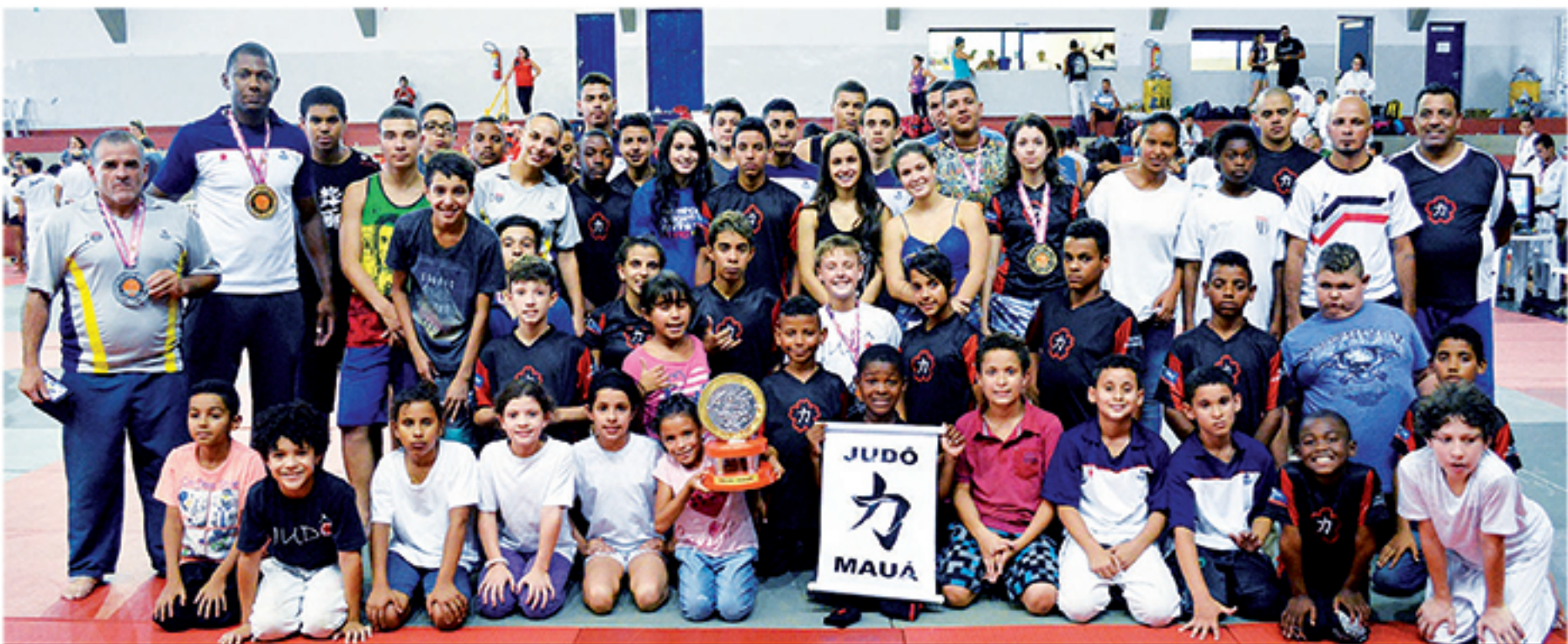
Professores e atletas da equipe da Associação de Judô Mauá em Itapira

O mês de abril foi um marco para a equipe da Associação de Judô Mauá, que em cinco competições totalizou 49 medalhas