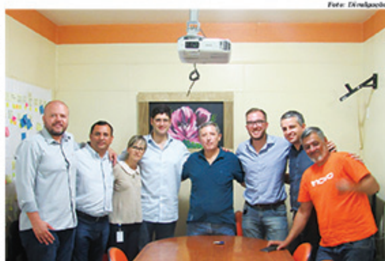
Santa Casa de Mauá foi um dos locais visitados pela cúpula do Partido Novo na cidade