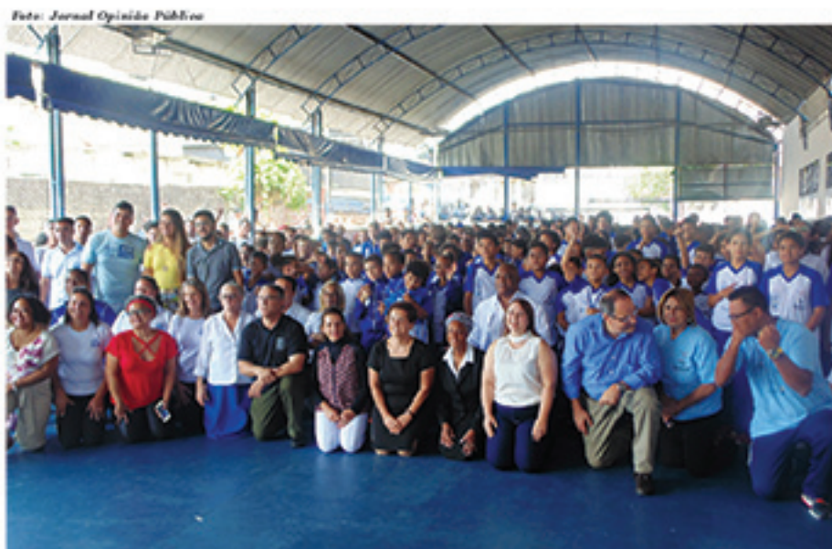
Evento de lançamento do "Formando Estrelas" contou com a presença de muitas pessoas entre alunos, pais, empresários e a comunidade

desenvolverem, contando com a tutela de profissionais capacitados em um local seguro. Os jovens também receberão alimentação e uniformes, estes já entregues para a grande maioria dos alunos durante o evento de lançamento da ação.