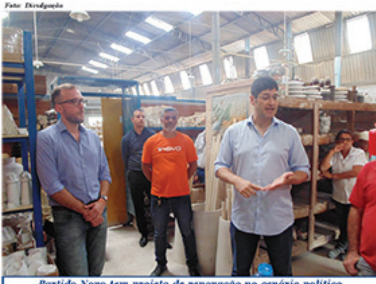
Partido Novo tem projeto de renovação no cenário político