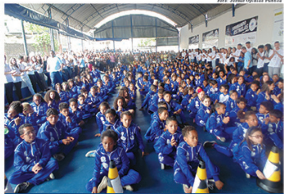
Crianças do projeto já receberam seus uniformes para frequentar as aulas