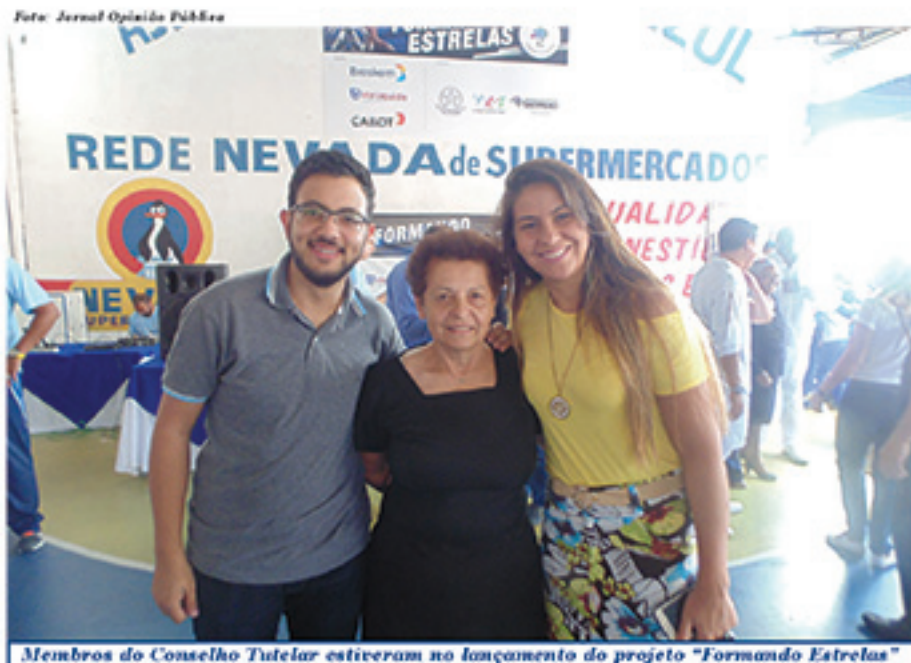
Membros do Conselho Tutelar estiveram no lançamento do projeto "Formando Estrelas"

Além do "Formando Estrelas", a Associação Estrela Azul desenvolve outros projetos focados nos jovens. Um deles é o "Adolescente Multiplicador", apoiado pela Fundação Banco do Brasil. Nele, 100 jovens provenientes de famílias que se encontram em situação de vulnerabilidade social passam a frequentar a entidade e, por meio das ferramentas começam a desen-