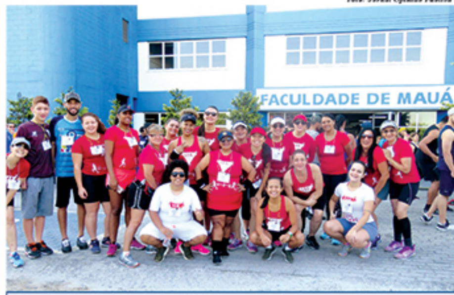
1ª Corrida e Caminhada Acadêmica FAMA teve percursos de 5km e 8km e foi uma homenagem ao Dia do Profissional de Educação Física