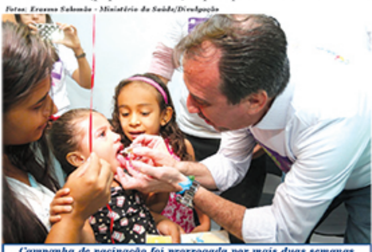
Campanha de vacinação foi prorrogada por mais duas semanas