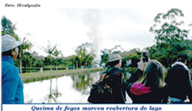
Queima de fogos marcou reabertura do lago