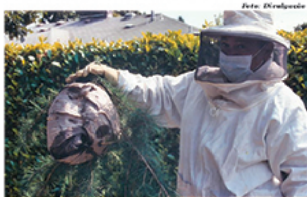
Zoonoses tem adquirido EPIs para atender a demanda de casos envolvendo himenópteros

Em reunião prévia, com o corpo de bombeiros de Mauá, ficou acertado o apoio a Gerência de Zoonoses às ações que envolvam