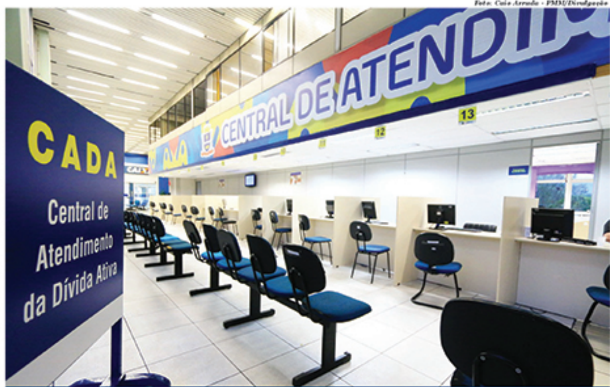
Segunda edição do programa Fique em Dia terá início nesta segunda (5) e permite que contribuintes renegociem dívidas em até 36 parcelas

O contribuinte que parcelar a dívida em 12 meses terá desconto de 100% no valor de multas e juros. Já quem dividir as dívidas em 24 vezes, terá 70% de desconto nos juros. Por fim, quem optar por pagar as pendências municipais em 36 parcelas,