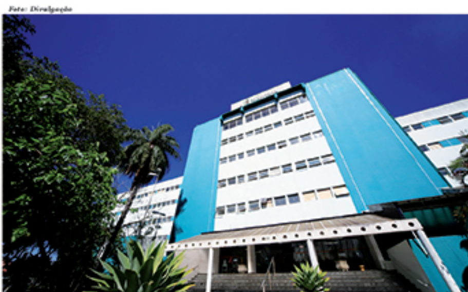
Uma das referências em Saúde em Mauá, o Hospital Nardini é um dos locais que ilustram os problemas da área na cidade