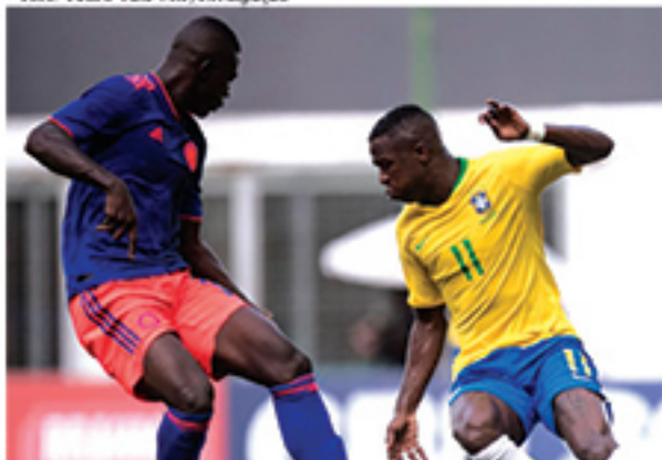
Vinicius Jr. pode ser o terceiro brasileiro a vencer o Golden Boy