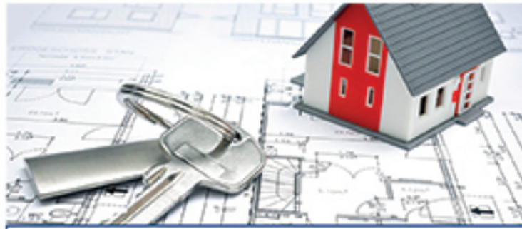
Projeto aprovado pelo Senado aumenta para até 50% o valor da multa por desistência de compra de imóvel na planta