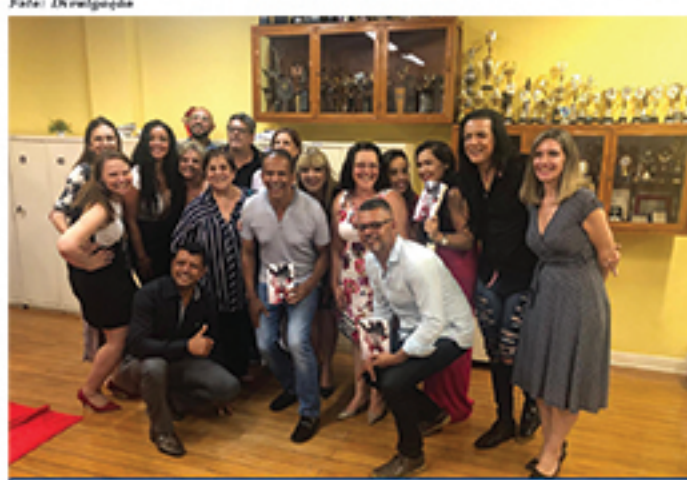
Wanessa Bomfim esteve entre as convidadas para o lançamento do livro Castelo de Cartas