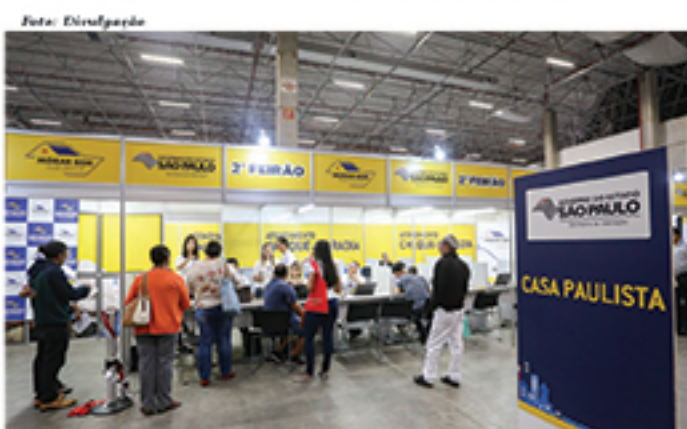
Feirão de 2017 aconteceu na São Paulo EXPO entre 20 e 22 de outubro