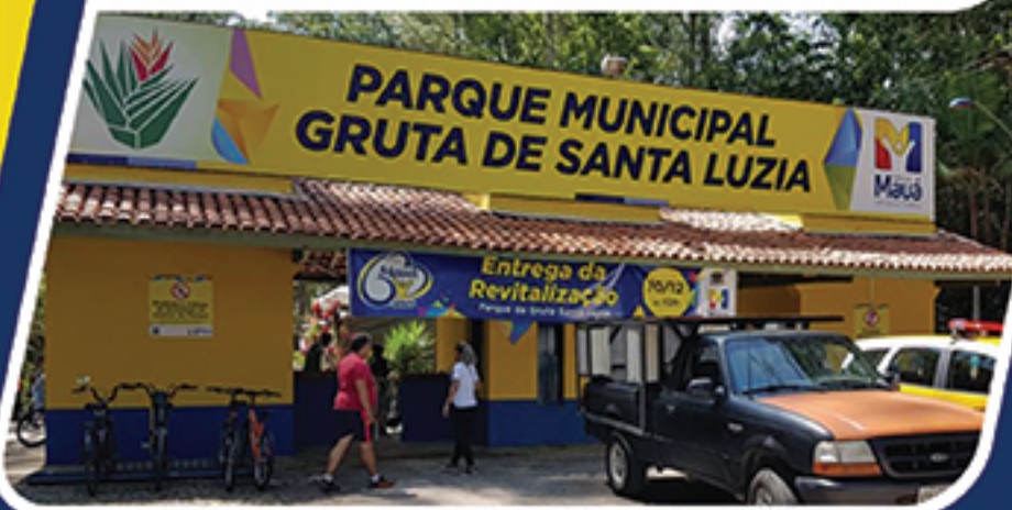
REVITALIZAÇÃO • GRUTA SANTA LUZIA