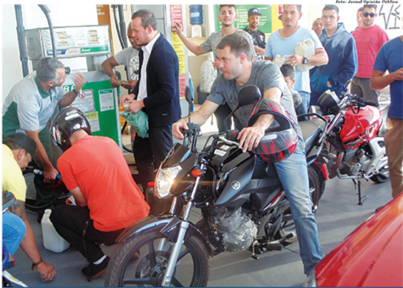
Motoristas de sorte: após longa espera em filas, alguns mauaenses conseguiram abastecer seus veículos nesta terça-feira em posto da bandeira BR, na Avenida Capitão João