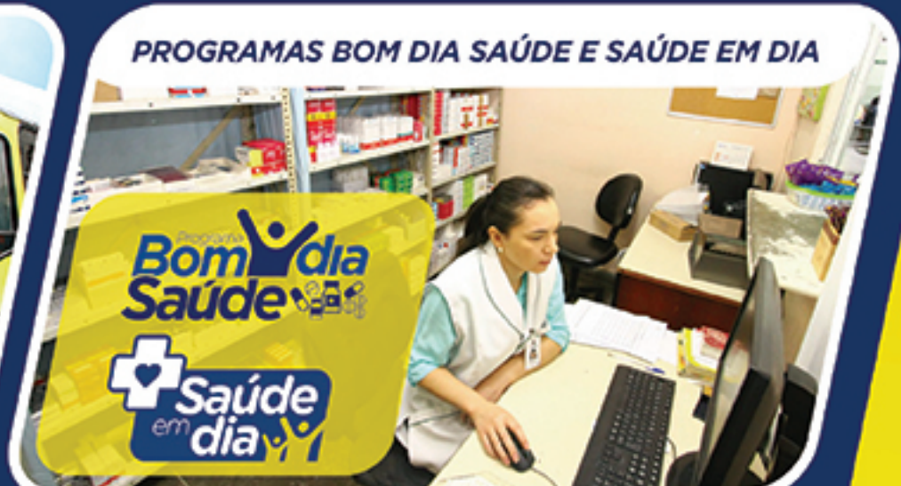
PROGRAMAS BOM DIA SAÚDE E SAÚDE EM DIA