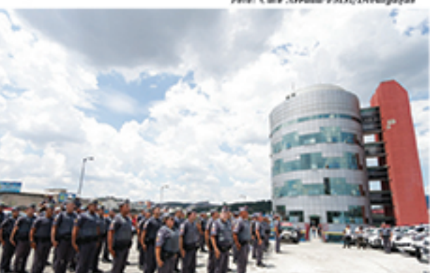
Número de roubo de cargas em Mauá caiu nos três primeiros meses de 2018 em relação ao mesmo período do ano passado

A base da iniciativa é o monitoramento por câmeras e ações estratégicas, que permitem às forças de segurança do município e do Estado agir em três situações de patrulhamento: ostensividade em áreas que registram roubos; bloqueio de entradas e saídas para a abordagem a motoristas e motociclistas suspeitos; saturação em regiões com registro de vários tipos de ocorrências.