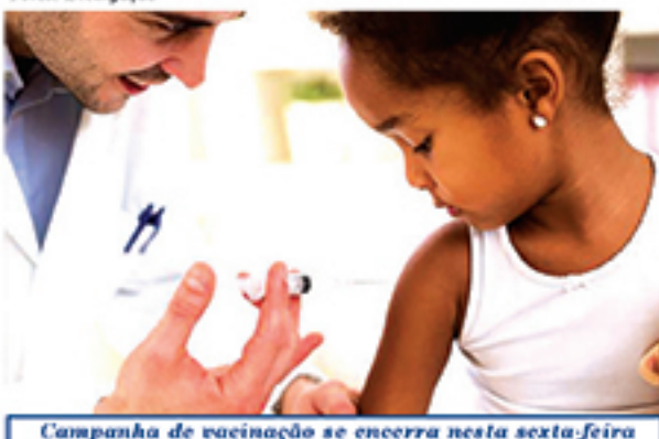
Campanha de vacinação se encerra nesta sexta-feira