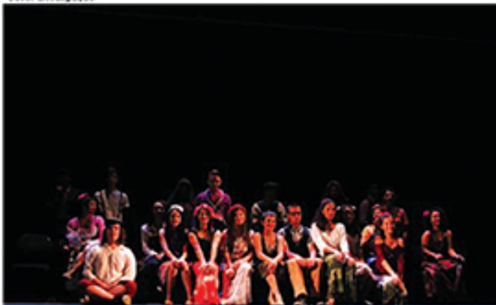
Oficinas culturais abrangem mais de 20 atividades em diversas áreas