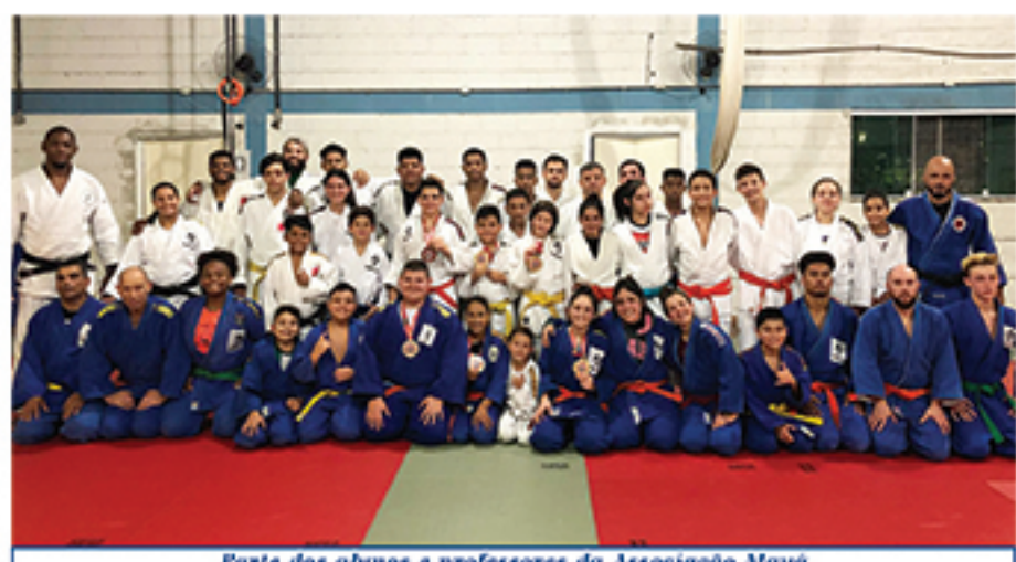
Parte dos alunos e professores da Associação Mauá