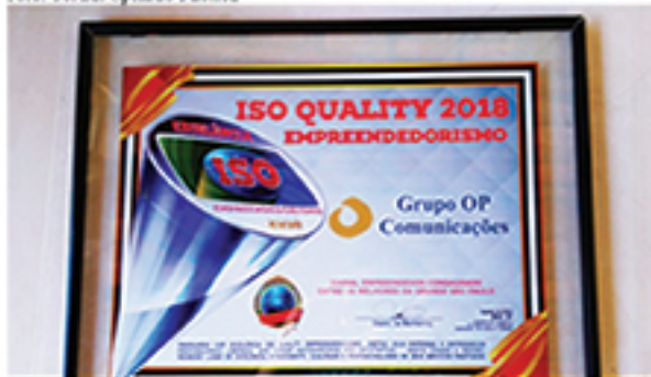
Grupo OP Comunicações receberá mais um importante prêmio regional

Grupo OP Comunicações A mídia mais completa de Mauá