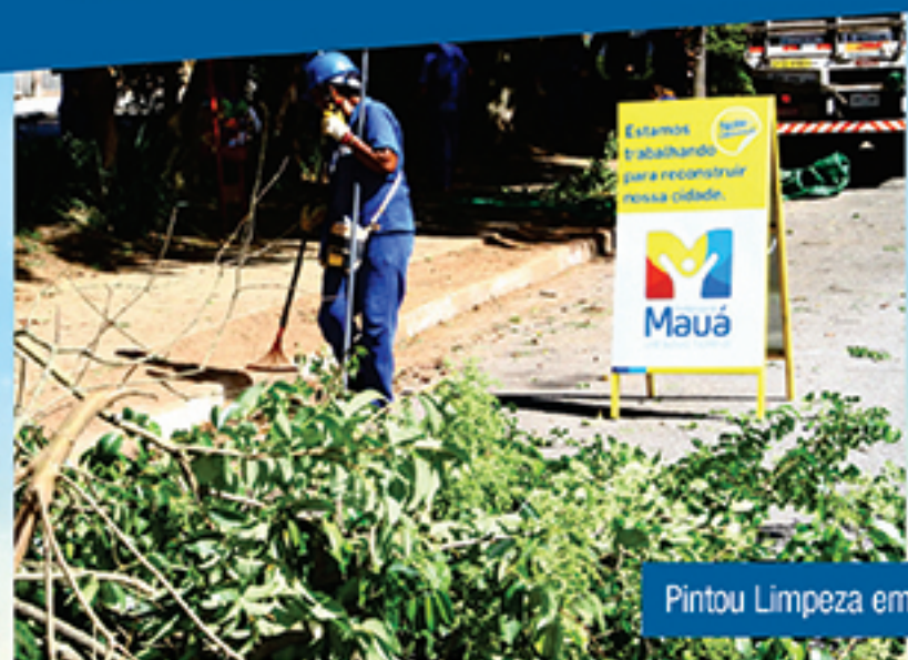
Pintou Limpeza em ação no Parque S. Vicente