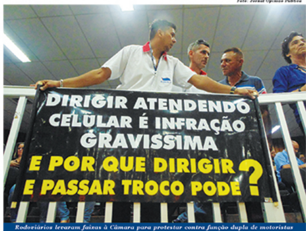
Rodoviários levaram faixas à Câmara para protestar contra função dupla de motoristas

que o acúmulo de funções pode ser, até mesmo, perigoso para a segurança dos passageiros, comparando a cobrança feita pelos motoristas ao uso do celular enquanto se dirige.