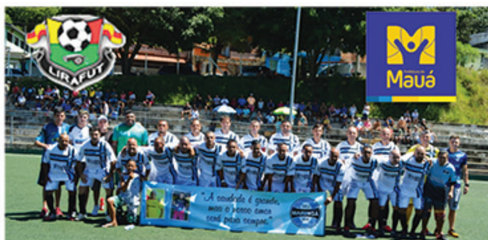
Grêmio Esportivo Maringá é campeão municipal de futebol de veteranos, ao vencer na decisão o Juá por 4 a 0.