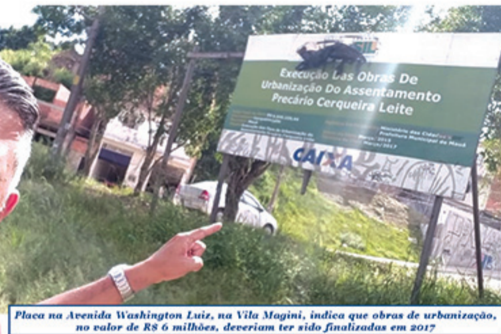
Placa na Avenida Washington Luiz, na Vila Magini, indica que obras de urbanização, no valor de R$ 6 milhões, deveriam ter sido finalizadas em 2017