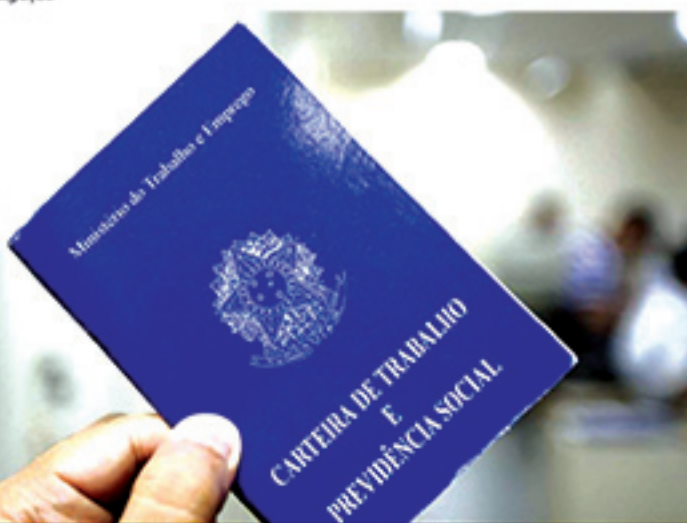
Números atualizados do IBGE mostram maior número de desempregados no Brasil desde agosto de 2018