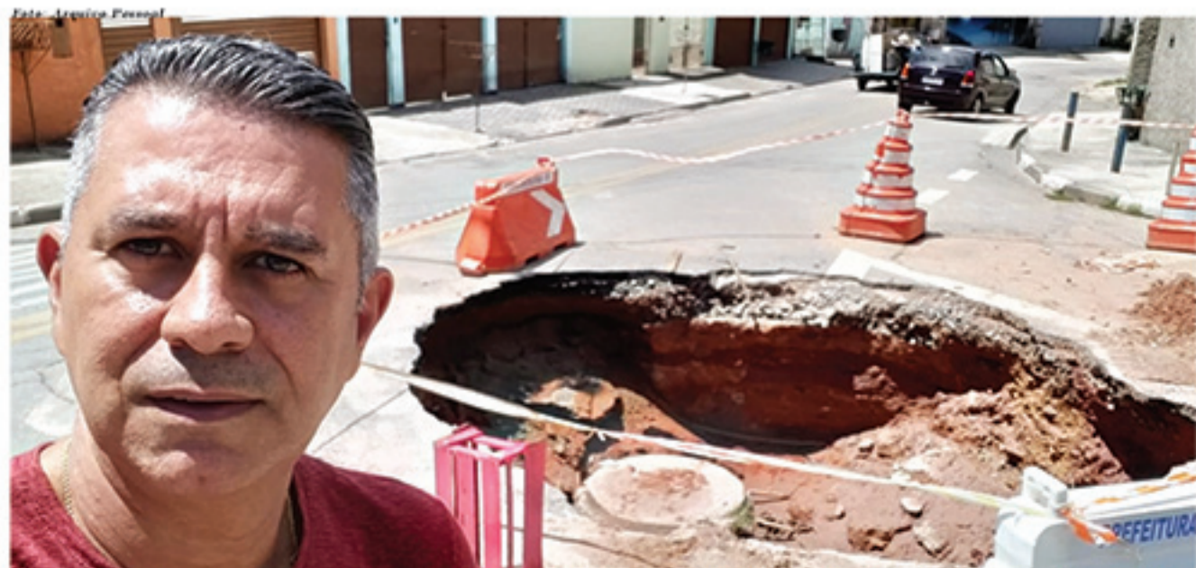
Cratera na esquina entre as ruas Eucalipto e Pau Brasil, na Vila Magini, tem dificultado a circulação de veículos e pedestres no local