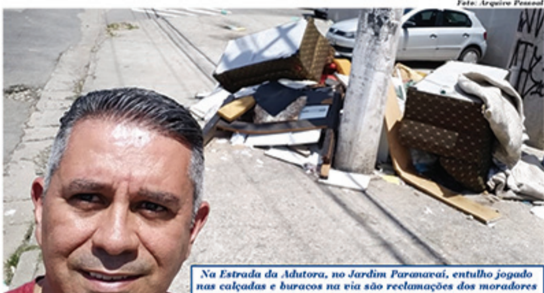
Na Estrada da Adutora, no Jardim Paranavaí, entulho jogado nas calçadas e buracos na via são reclamações dos moradores