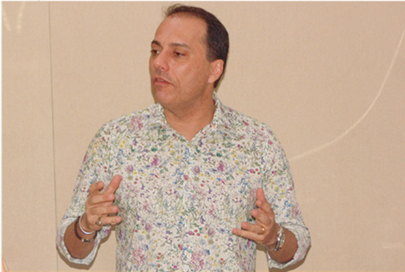
Julgamento do chefe do Executivo mauaense no TRF-3 está marcado para o dia 21 de março