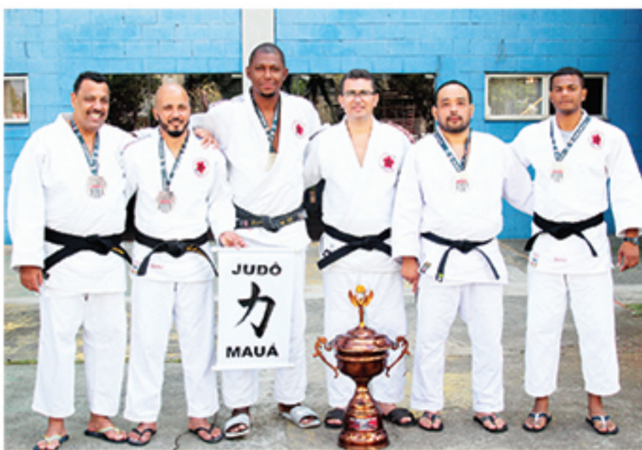
Professores medalhistas da classe veteranos posam com o troféu de quarto colocado