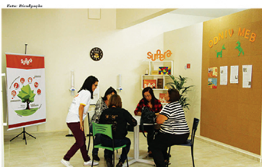
Proposta do método Supera é estimular e melhorar saúde mental de seus alunos por meio de atividades dinâmicas