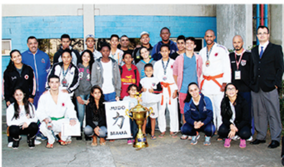
Medalhistas posam com o troféu dos campeões da Copa São Paulo Aspirante 2017

A Federação Paulista de Judô (FPJ) realizou a Copa São Paulo Aspirante, Veteranos, Kata e Judô Para Todos. Evento que somado à Copa São Paulo recebeu 3810 atletas. Considerada a maior competição interclubes da América, a disputa recebeu judocas de vários Estados e das principais equipes do País.