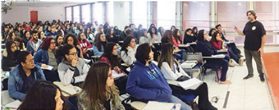
No curso, professores desenvolvem atividades voltadas ao ENEM para auxiliar os jovens

No curso, os professores dão dicas para a prova, fazem uma revisão dos conteúdos mais frequentes e passam informações sobre como ingressar na Universidade Pública por meio da nota desse exame.