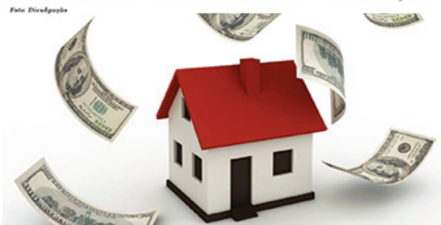
Queda no valor dos aluguéis acontece pelo quarto mês consecutivo