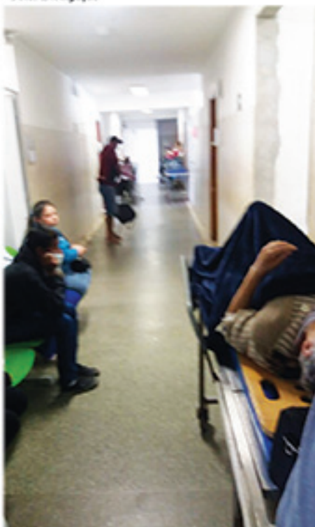
Imagem registrada nesta semana mostra que pacientes do Hospital Nardini seguem lotando corredores