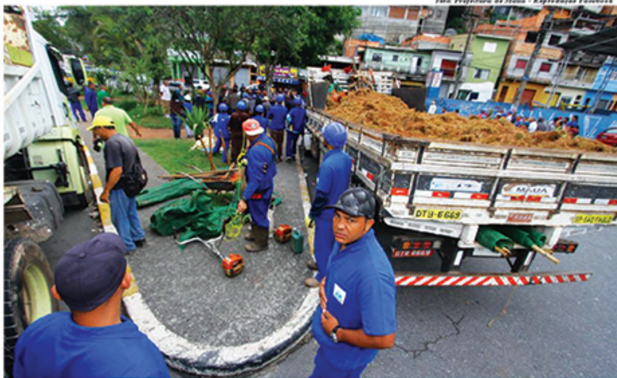
Equipes do Pintou Limpeza estão nesta semana trabalhando nos Jardins Itapark e Esperança. Vários bairros de Mauá já foram atendidos pelo programa

prefeito Atila Jacomussi já havia destacado que o programa vinha conquistando uma boa aceitação e adesão popular, citando o resgate da autoestima dos munícipes. "A cidade está com cara nova. Mais limpa, mais bonita. A população está recuperando a confiança no governo e a autoestima. O Pintou Limpeza é um dos programas de zeladoria mais bem avaliados pela população", enfatizou na oportunidade.