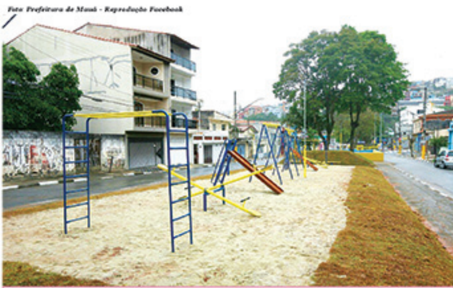
Na última semana, Pintou Limpeza esteve no Jardim Zaira e entregou praça com nova área de lazer na Avenida Guerino Stella