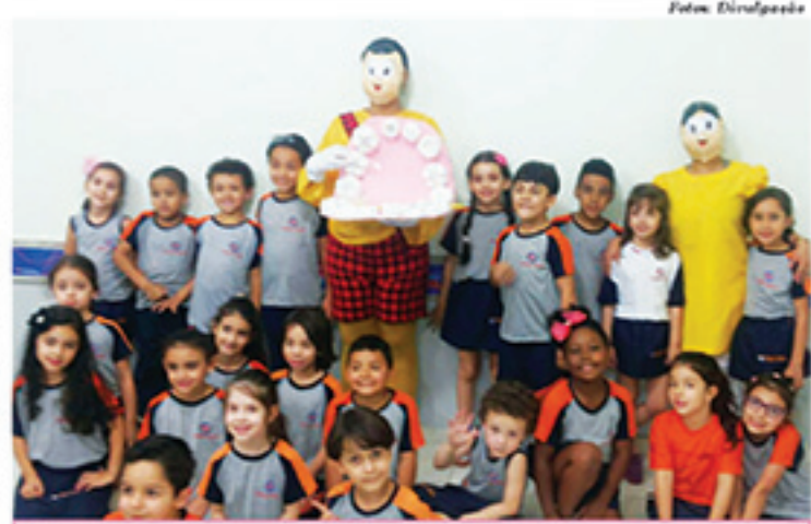
Crianças também participaram de atividade que destaca a importância dos cuidados com a saúde bucal