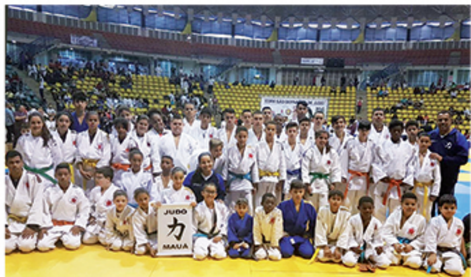
Parte da equipe mauaense que disputou a Copa São Bernardo posa para foto antes das disputas

Exibindo um judô vibrante, em 28 de setembro a equipe de Mauá conquistou a Copa São Bernardo. Para conquistar o título os judocas mauaenses obtiveram 34