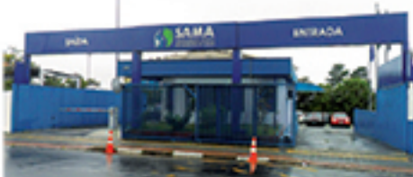
SAMA diz que equipes trabalham para normalizar abastecimento