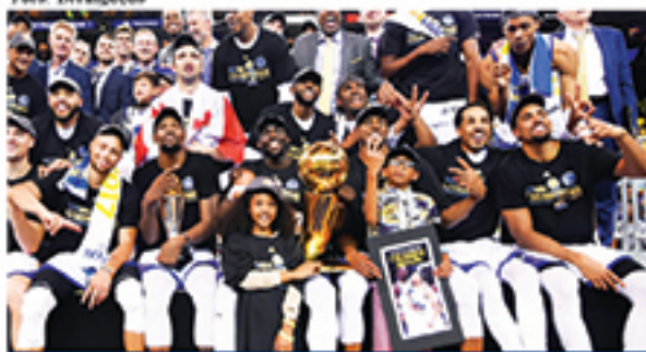
Warriors conquistou mais um título, coroadando trabalho realizado desde a década passada

Favoritos desde o título de 2015, que colocou fim a um jejum de 40 anos sem taças, os Warriors estabeleceram novos parâmetros. Nos resultados, são dois títulos, recorde de vitórias na história da NBA em uma temporada regular (73 vitórias e 9 derrotas em 2015/2016), melhor campanha da história dos playoffs (16 vitórias - sendo 15 seguidas - e apenas uma derrota) e a junção de quatro All-Stars no quinteto titular. Na forma de jogar, o time californiano tem grande "parcela de culpa" na mudança de estilo vista no basquete atual, privilegiando o