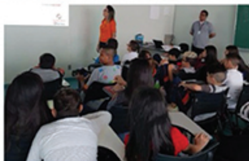
Alunos dos períodos da manhã e tarde participam do projeto Bullying Eu Não Curto

vas, verbais ou físicas, intencionais ou repetitivas, que ocorrem sem motivação evidente e são exercidas por um ou mais indivíduos, causando dor e angústia.