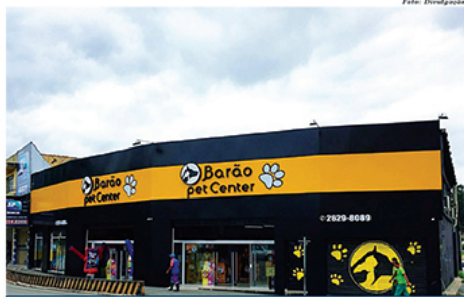
Barão Pet Center tem variedade e bom atendimento como diferenciais para seus clientes

Dessa forma, o centro tem investido para levar cada vez mais comodidade aos clientes, sendo um dos diferenciais o convênio com um