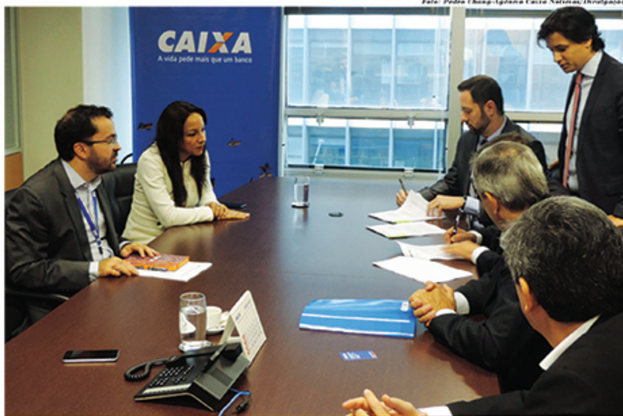
Acordo entre a Suzantur e a Caixa Econômica Federal irá auxiliar na renovação de 30% da frota de ônibus da empresa