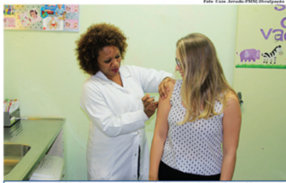
Apesar de a meta de imunização em Mauá ter sido atingida, campanha de vacinação foi prorrogada

Com a meta atingida, a administração municipal liberou a vacina para pessoas entre 55 e 59 anos de idade. A liberação desse grupo segue determinação do Governo do Estado, que estabelece prioridades de acordo com o risco de evolução da gripe causar complicações, como pneumonia e internação hospitalar. Além desse grupo, profissionais da saúde, que li-