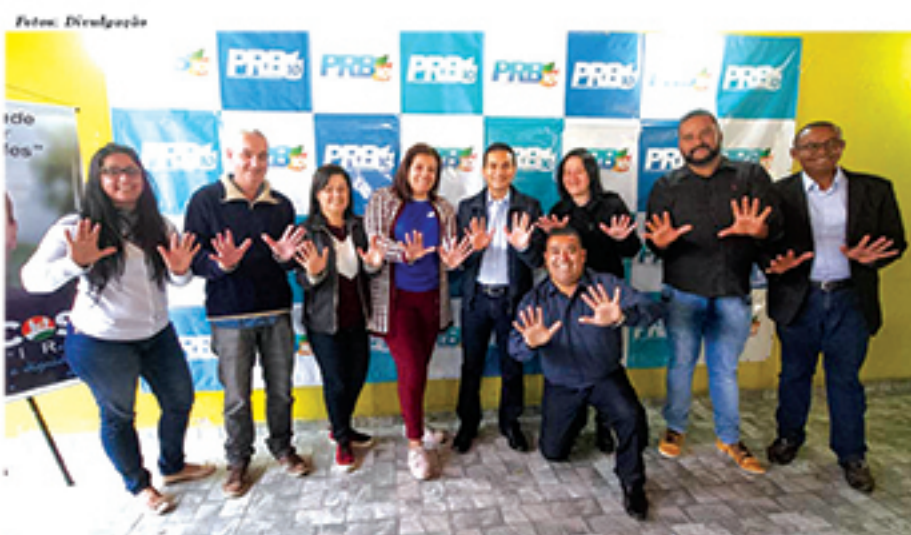
Marcos Pereira se encontrou com lideranças regionais em Mauá