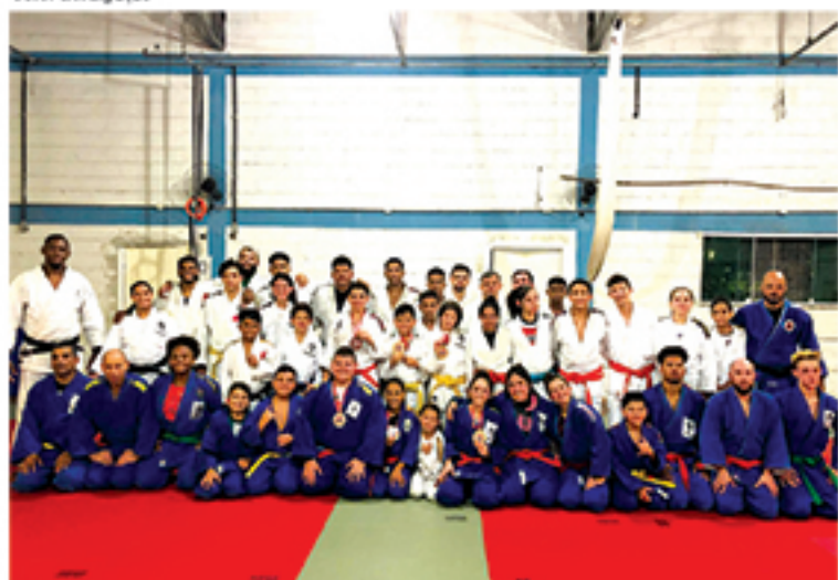
Judocas de Mauá tiveram destaque no Campeonato Paulista Aspirante