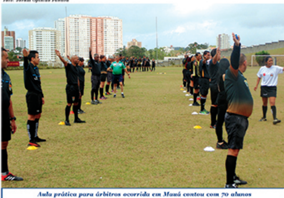
Aula prática para árbitros ocorrida em Mauá contou com 70 alunos