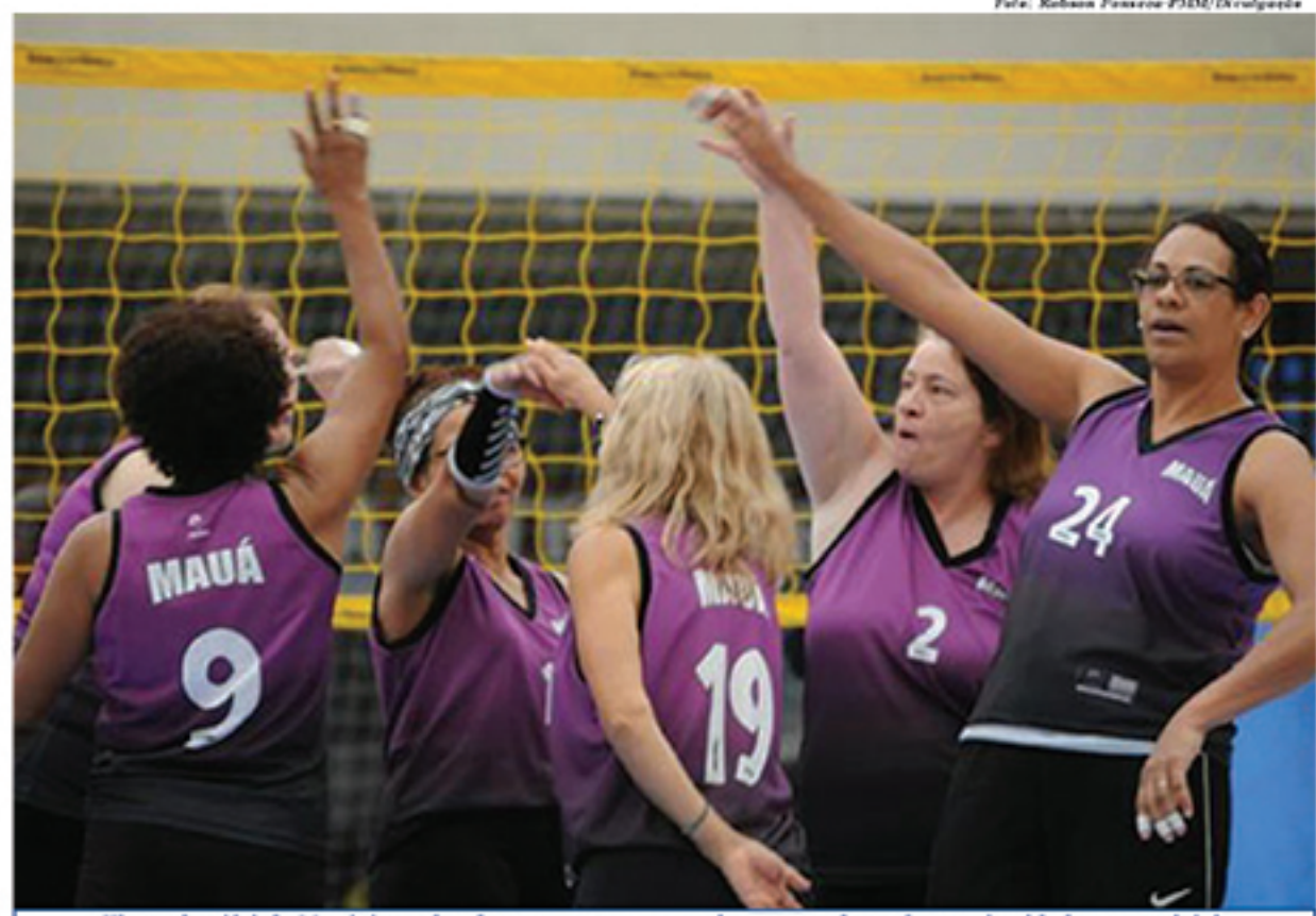
Times de vôlei de Mauá é um dos destaques entre as equipes com atletas da terceira idade no município