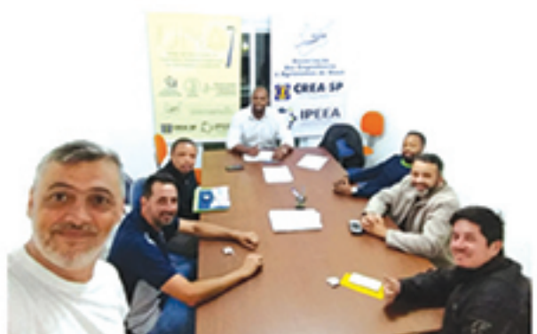
Reuniões do Crea-Jovem são realizadas mensalmente