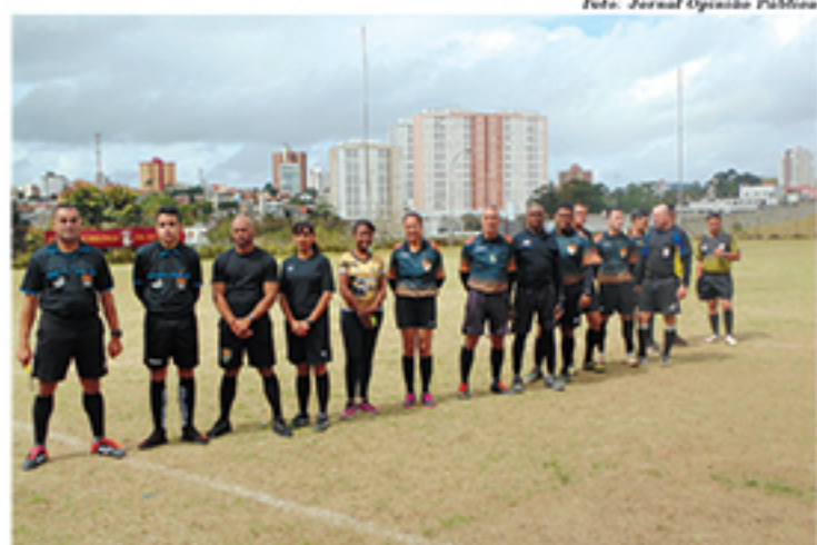
Objetivo da associação é difundir regras do futebol de campo e de salão e investir na formação de novos árbitros

Em parceria com a Prefeitura de Mauá, o projeto "Futebol Me-