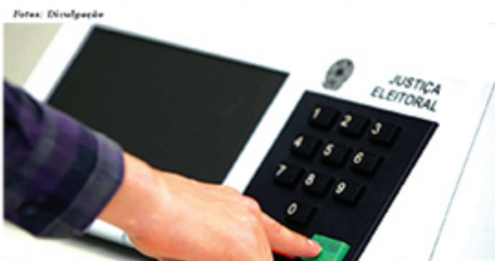
Descumprimento de regras para eleições de 2018 pode gerar multas e processos