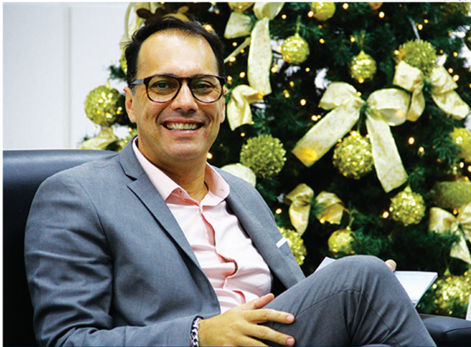
Indiciado pela Polícia Federal, Atila Jacomussi corre o risco de sofrer impeachment. Pedidos devem ser julgados no dia 16 de janeiro, na Câmara Municipal

Essa foi a segunda vez que Atila e Gaspar são presos em pouco mais de seis meses. Em maio do ano passado, durante a Operação "Prato Feito", o socialista e o ex-secretário já haviam sido detidos em flagrante por corrupção. Na casa do prefeito afastado, a PF apreendeu R$ 85 mil em dinheiro. Com Gaspar, os investigadores encontraram R$ 588 mil e quase 3 mil euros. Ambos ficaram pouco mais de um mês