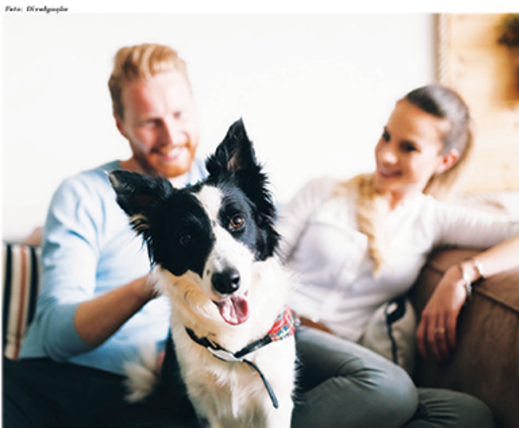
Projeto da senadora Rose de Freitas é justificado pelo fato de os animais ocuparem um espaço afetivo nas famílias