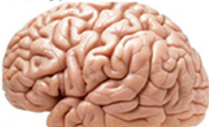
Irisina é o hormônio que pode ajudar no combate ao Alzheimer