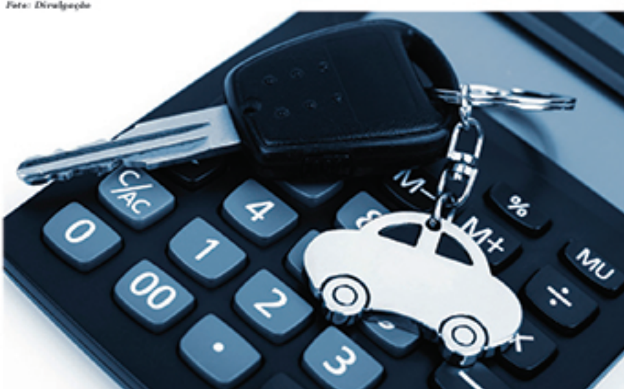
Pagamento à vista do IPVA no mês de janeiro dá desconto de 3% para o dono de veículo