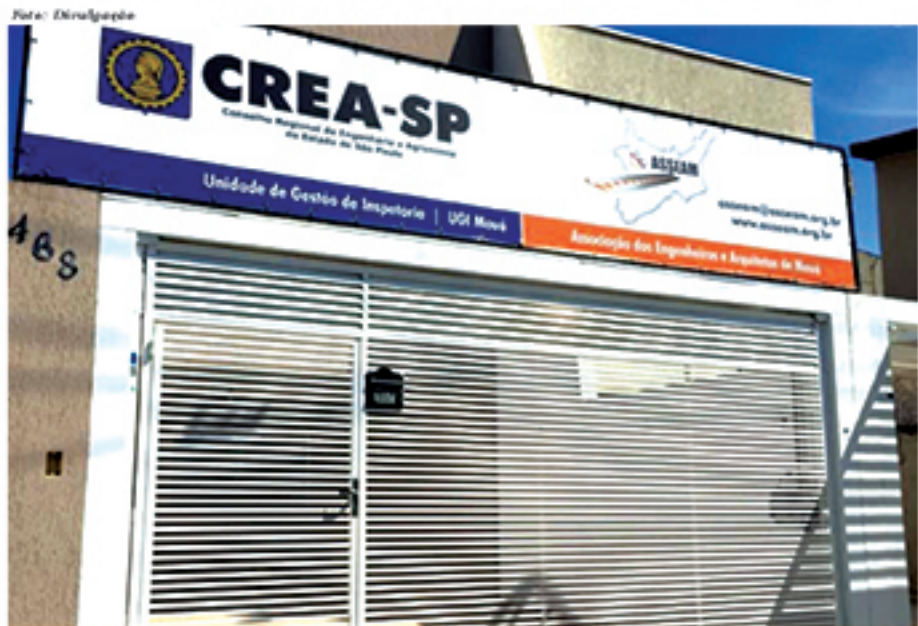
Nova diretoria da ASSEAM já foi empossada para mandato que vai de 2019 a 2021