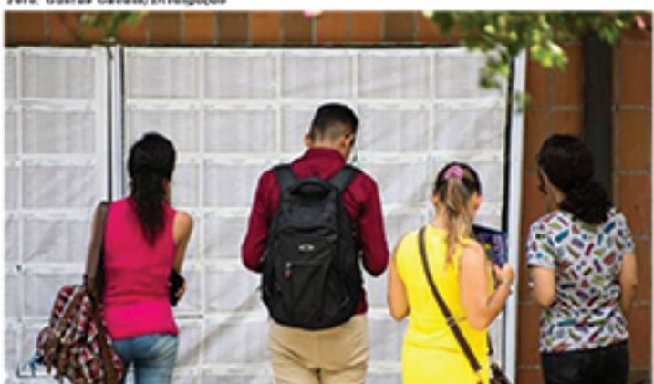
Matrículas nas Fatecs serão realizadas nestes dias 10 e 11 de janeiro para convocados na primeira chamada