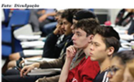
Alunos que querem se transferir de escola precisam correr contra o tempo