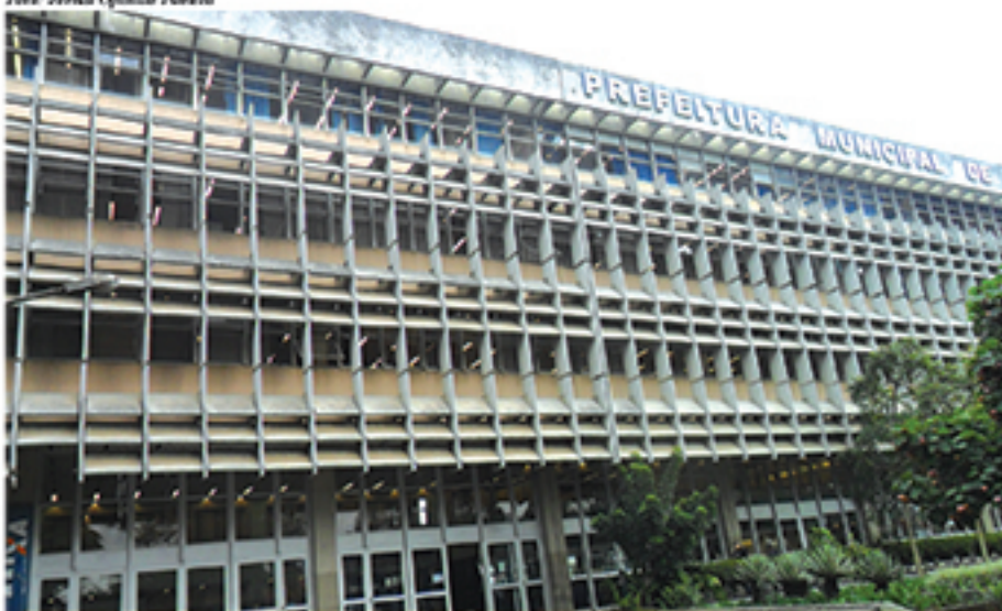
Reajuste do IPTU para população mauauense em 2019 é de 4%