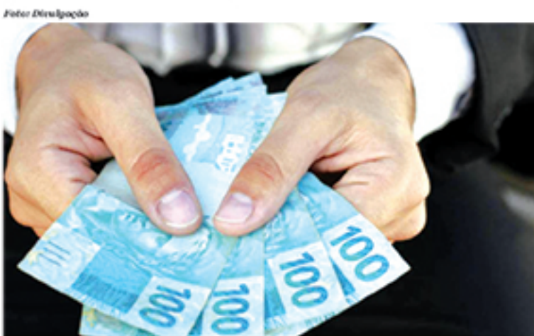
Moradores de 27 ruas e avenidas afetadas pelas chuvas no início do ano, em cinco bairros de Mauá, podem sacar o FGTS