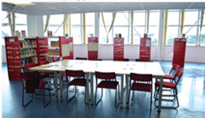
Biblioteca Cecília Meireles está funcionando no centro de Mauá desde o início do ano