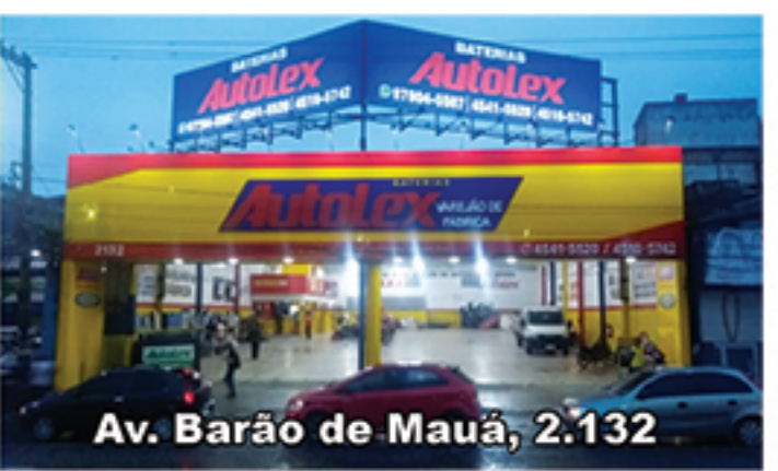
Av. Barão de Mauá, 2.132