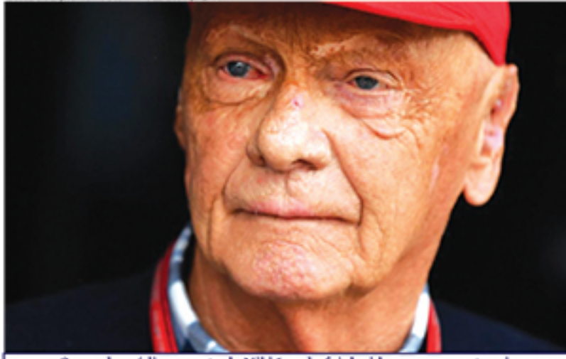
Segundo médico, morte de Niki Lauda foi devida a causas naturais