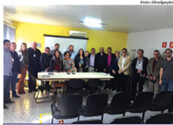
Reunião serviu para debater planos para o desenvolvimento da cidade