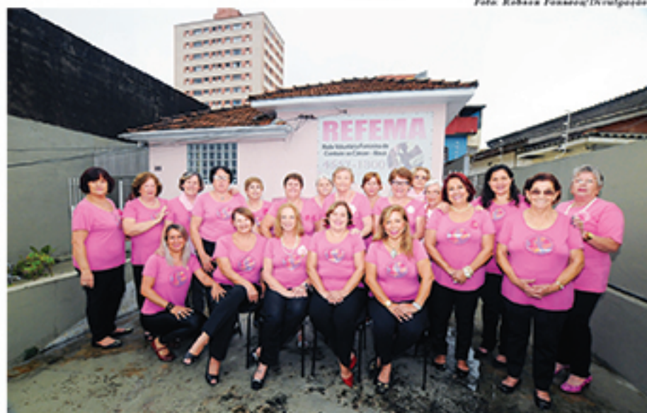
Diretoria da REFEMA já está organizando ações para divulgar o Novembro Azul

Atualmente, não há uma forma de adquirir imunidade contra a doença, o que torna ainda mais importante a realização periódica de exames, tanto o de sangue quanto