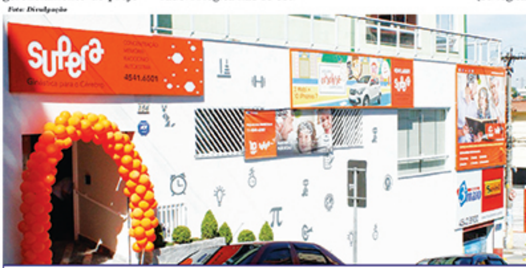
Fachada da unidade do SUPERA Mauá

A melhor educação a distância do Brasil.* De perto e levada a sério.