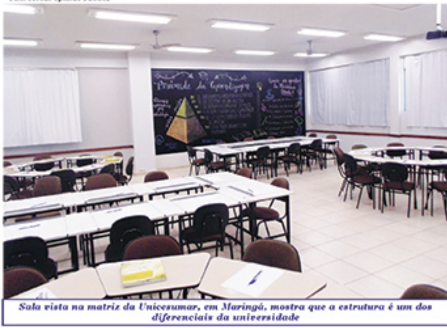
Sala vista na matriz da Unicesumar, em Maringá, mostra que a estrutura é um dos diferenciais da universidade