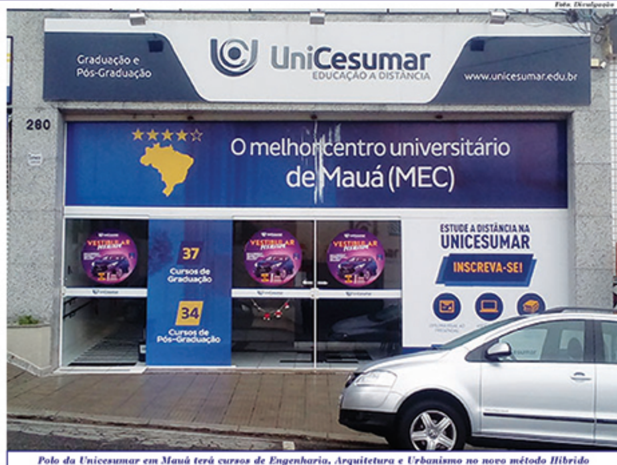
Polo da Unicesumar em Mauá terá cursos de Engenharia, Arquitetura e Urbanismo no novo método Híbrido

Quanto à estrutura das aulas, elas serão dispostas da seguinte forma: durante a semana, os alunos terão seis dias de atividades, sendo que três deles estarão dedicados ao auto estudo, um