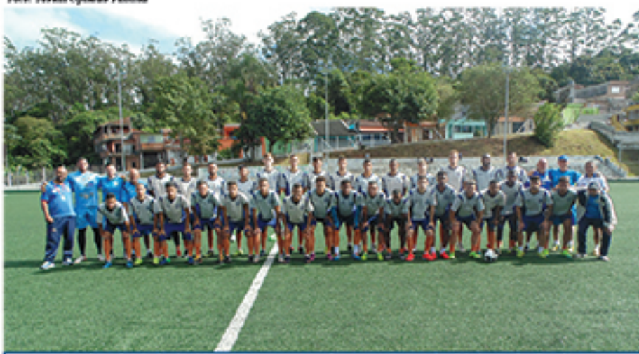
Equipe do Grêmio Mauaense estreou bem na Segunda Divisão do Paulista