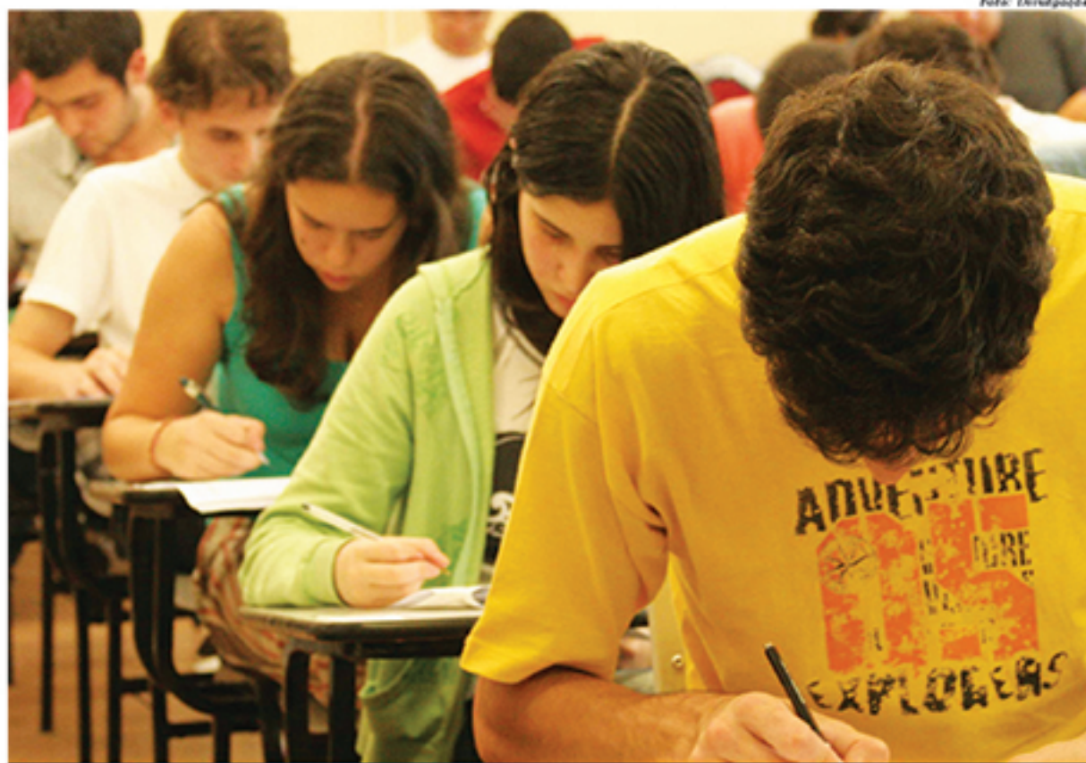
Provas do ENEM serão aplicadas em dois domingos consecutivos neste ano, dias 5 e 12 de novembro

provas, os cadernos de provas continuarão sendo divididos por cores, sendo que cada uma delas possuirá um gabarito diferente. Além disso, pensando em aumentar a segurança do exame, cada caderno terá a identificação do aluno, o que promete dificultar o vazamento das questões, por exemplo.