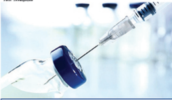
Ampla maioria dos casos de sarampo registrados no país se concentram no Amazonas