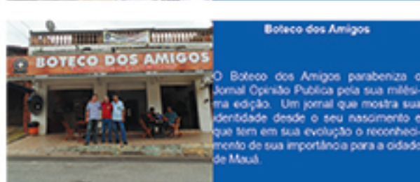
Boteco dos Amigos

Ser MI, não é para os fracos. Agora, ser MI e ter Opinião, somente se for Pública. Parabéns Opinião Pública pela milésima edição.