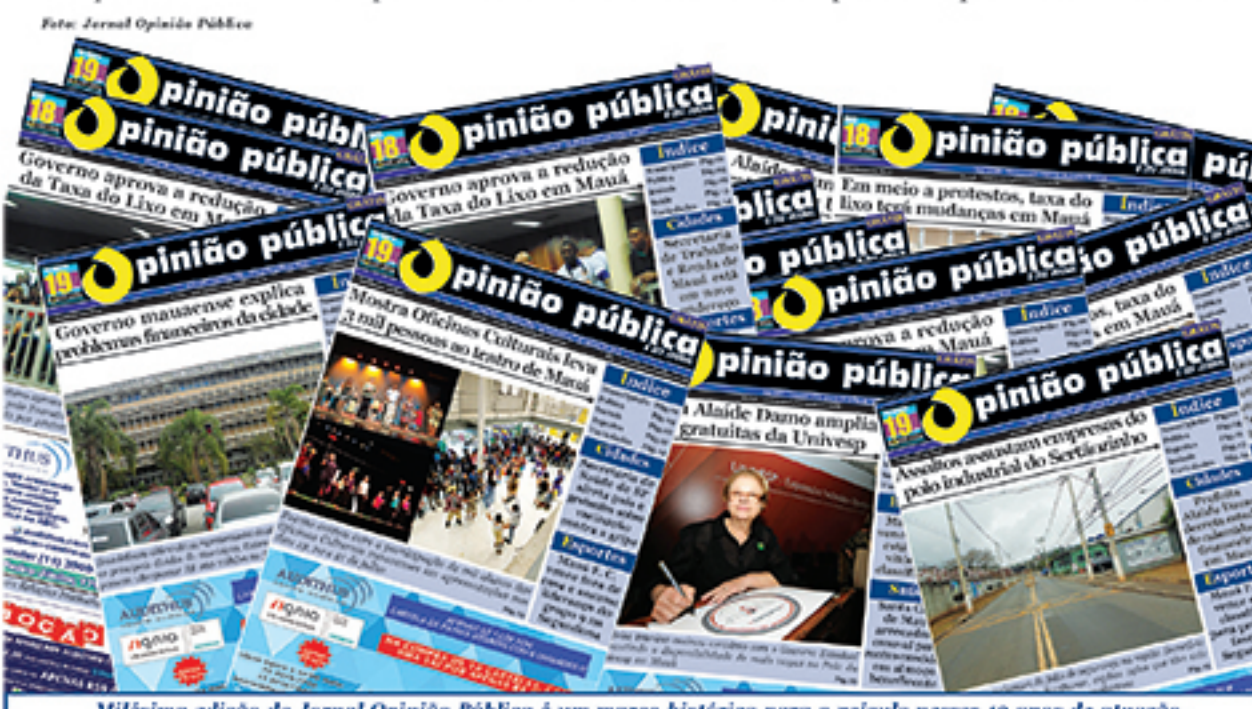
Milésima edição do Jornal Opinião Pública é um marco histórico para o veículo nessas 19 anos de atuação