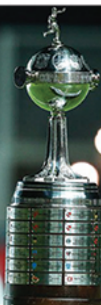
Após adiamentos no fim de semana, decisão da Libertadores segue em xeque