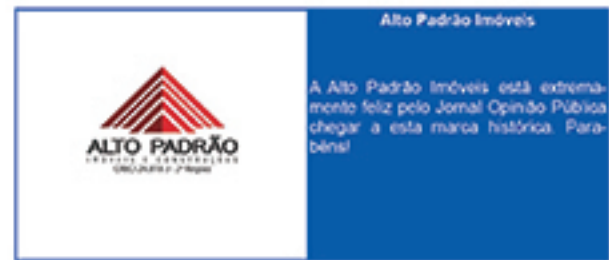
Alto Padrão Imóveis