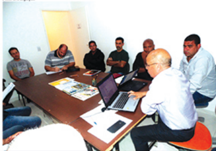
Novas propostas da TCU em Mauá foram discutidas em reunião na ASSEAM