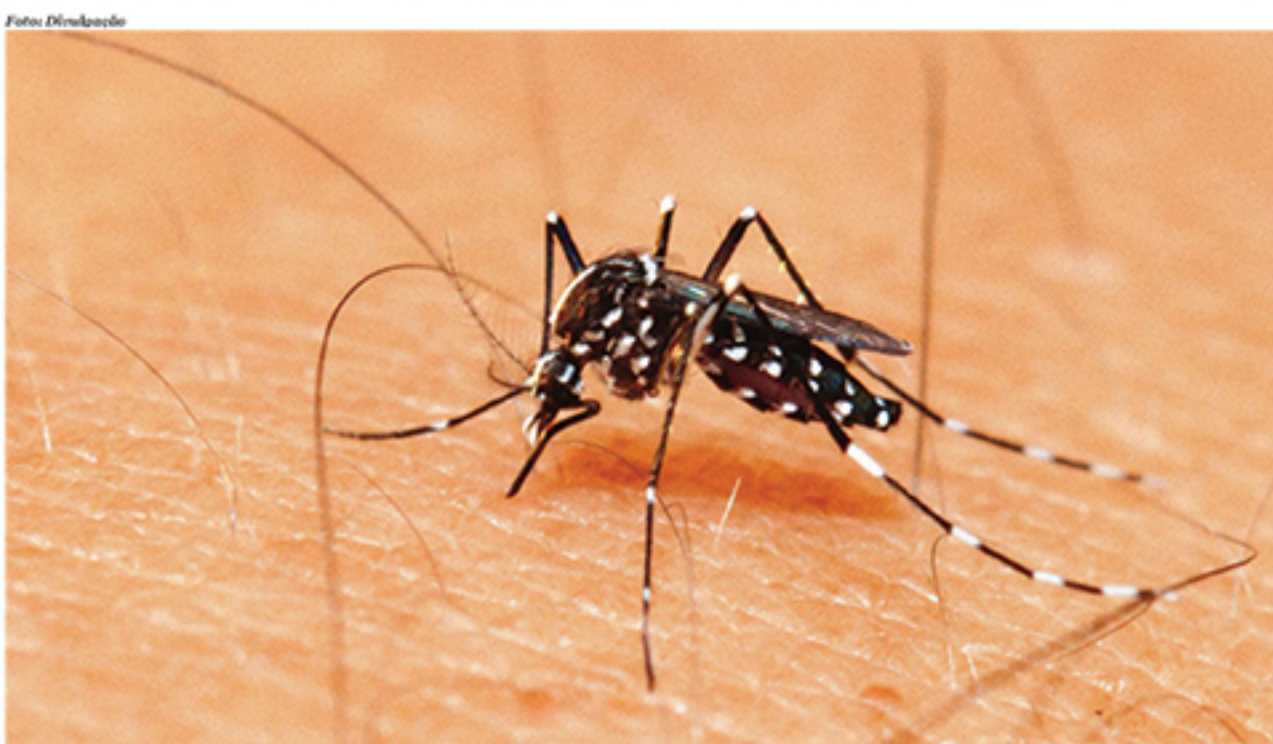
Apesar do aumento na incidência de casos de dengue no país, Ministério da Saúde assegurou que não há epidemia da doença