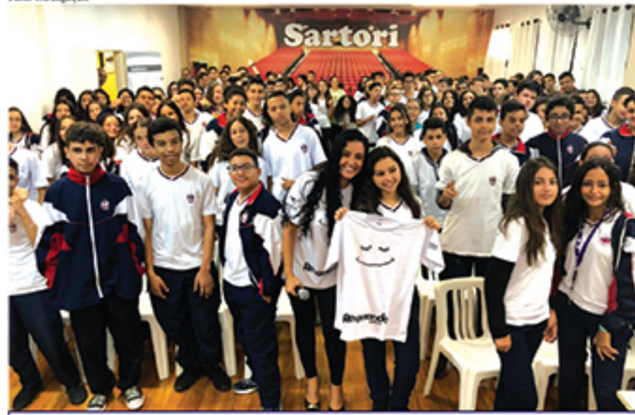
Cerca de 1500 alunos assistiram as palestras do projeto "Resgatando Valores"