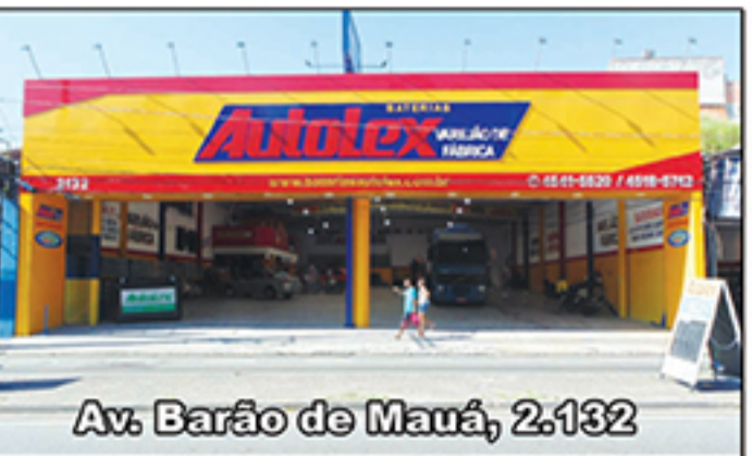
Av. Barão de Mauá, 2.132