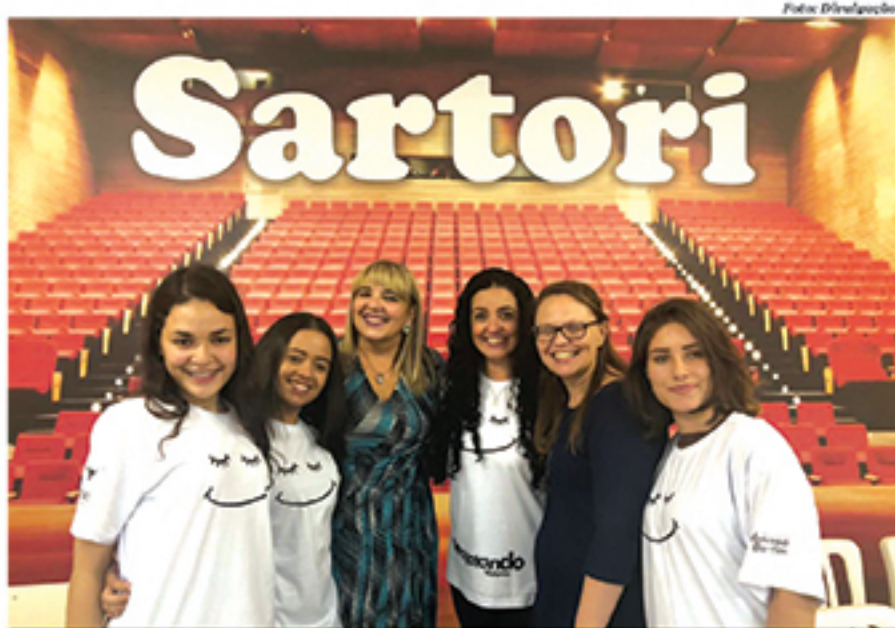
Alunos da Therezinha Sartori foram os primeiros a assistirem as palestras do projeto "Resgatando Valores"

ying e da violência nas escolas. Para ela, esse tipo de iniciativa pode prevenir que novas tragédias, como a de Suzano, sigam acontecendo e marcando negativamente o país. "É necessário alertar e ensinar aos nossos jovens como agir em situações como essa. O bullying é um assunto sério e que pode deixar marcas profundas em