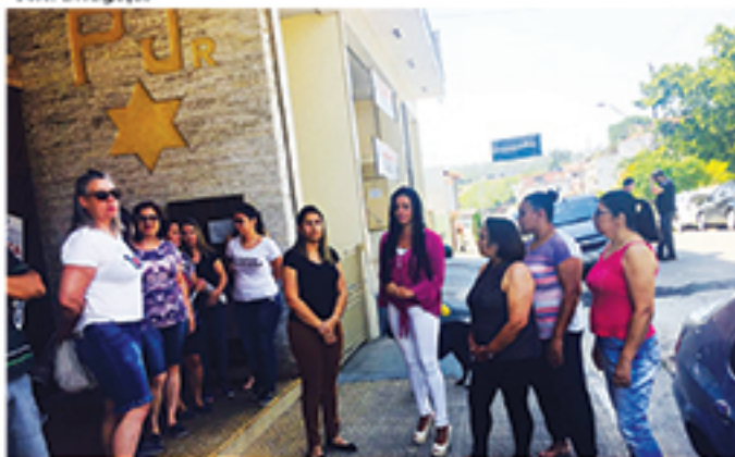
Municípios têm reclamado constantemente sobre falta de água na cidade