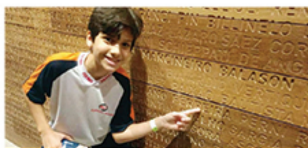
Dentre os pontos de destaque na visita, está a identificação da origem dos nomes