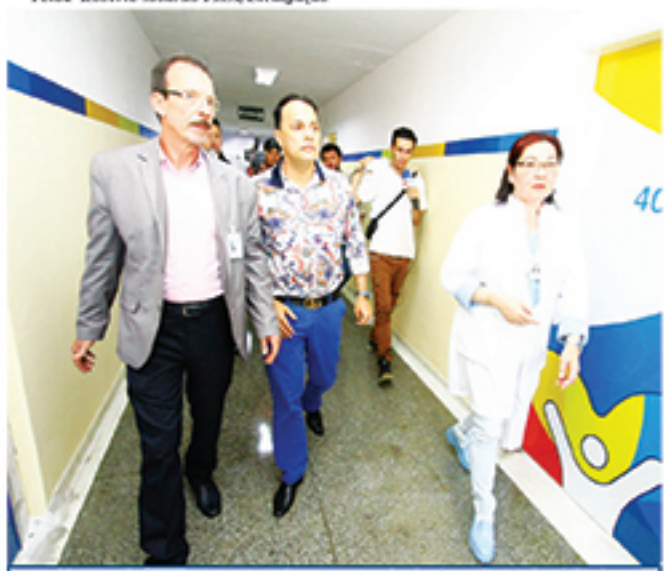
Novos leitos vão atender casos de baixa complexidade