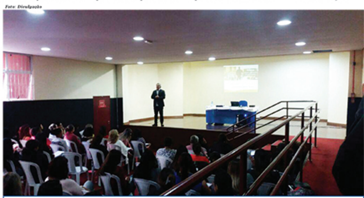
1º Encontro de Educadores da ETEC de Mauá reuniu diversas pessoas envolvidas com a área da Educação para realização de palestras. Evento deverá acontecer anualmente