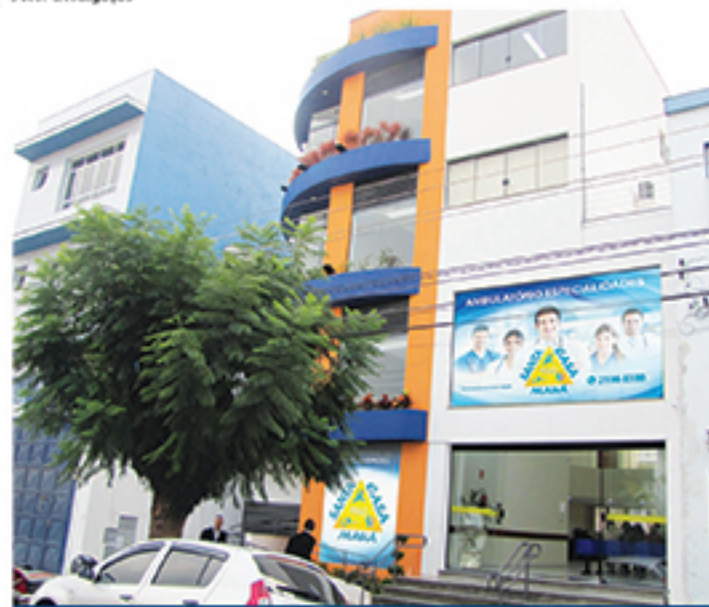
Novo serviço do ambulatório de especialidades da Santa Casa visa trazer mais praticidade no agendamento de consultas