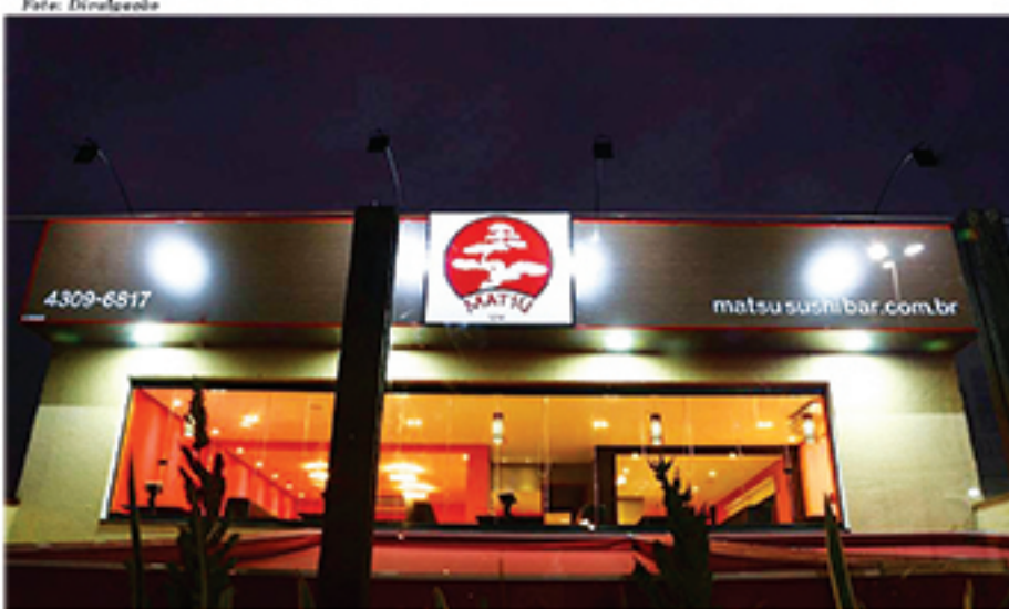
Matsu Sushi Bar caiu nas graças do mauaense e é bastante elogiado pelos clientes