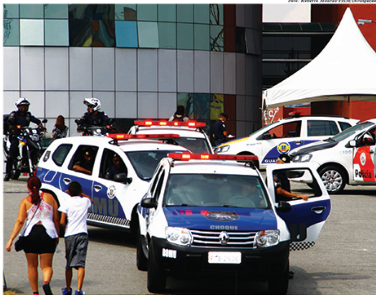
Além de monitoramento por câmeras, dez viaturas da GCM tiveram o retorno da operação de seus aparelhos de GPS

"A Segurança é tratada com alta prioridade pelo nosso governo. Tanto que lançamos o Programa Bairro Seguro, que, entre outros aspectos, colocou fim aos panejões da Avenida Portugal. E participamos da Operação Força Total Metropolitana, em conjunto com as polícias do Estado, para inibir e combater a criminalidade. Perseguimos a proteção total dos cidadãos de bem", ressalta o prefeito