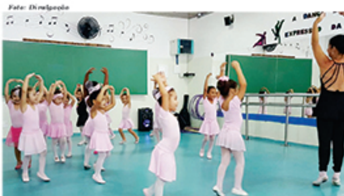
Estrutura do Colégio Renil também permite aulas de balé a alunos