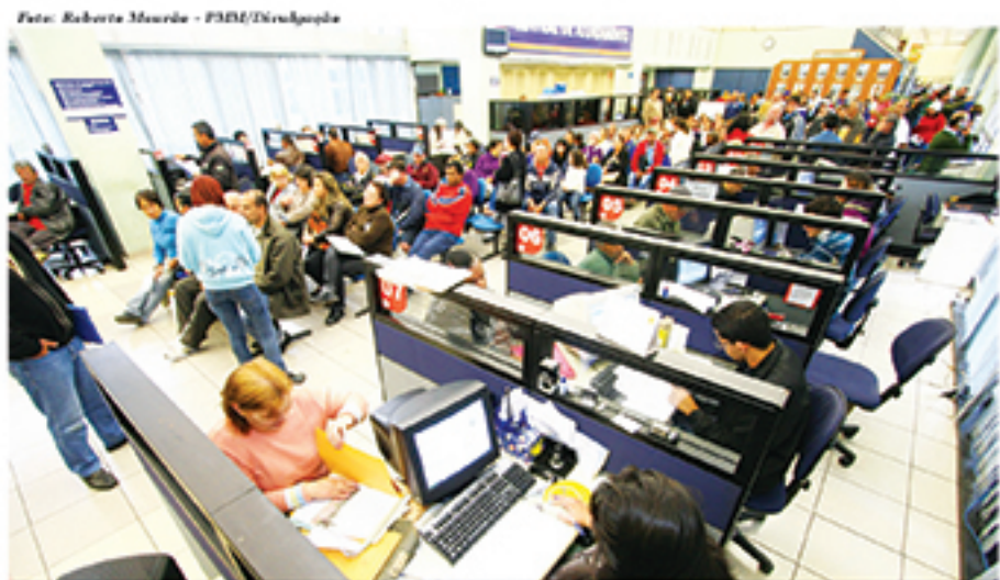
Novo posto de atendimento no Poupatempo visa agilizar o atendimento a empresas