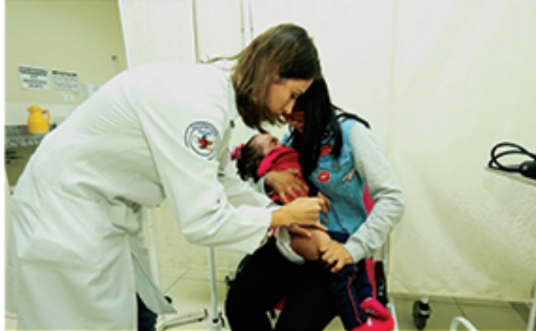
Campanha de vacinação na cidade seguirá até o dia 31 de maio