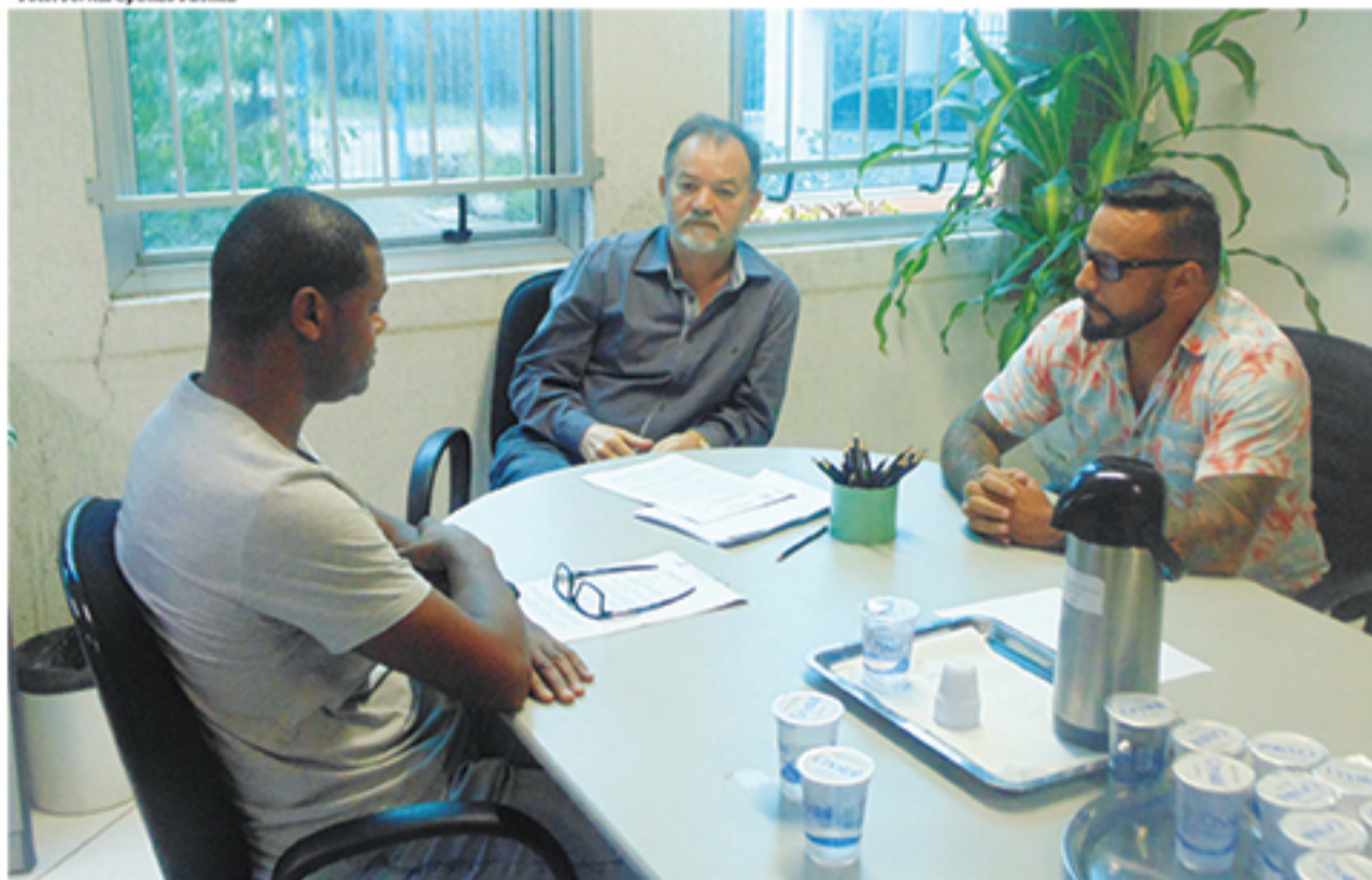
Comissão que investigou a denúncia por vacância no cargo foi unânime em votar pelo prosseguimento do processo de impeachment