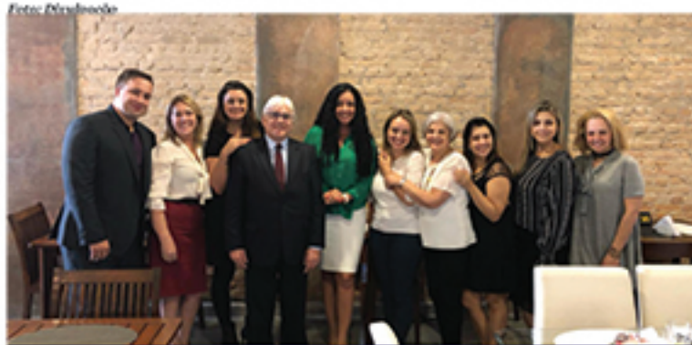
Reunião aconteceu na última sexta-feira em restaurante de São Caetano do Sul