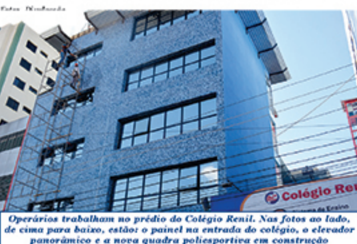
Operários trabalham no prédio do Colégio Renil. Nas fotos ao lado, de cima para baixo, estão: o painel na entrada do colégio, o elevador panorâmico e a nova quadra poliesportiva em construção