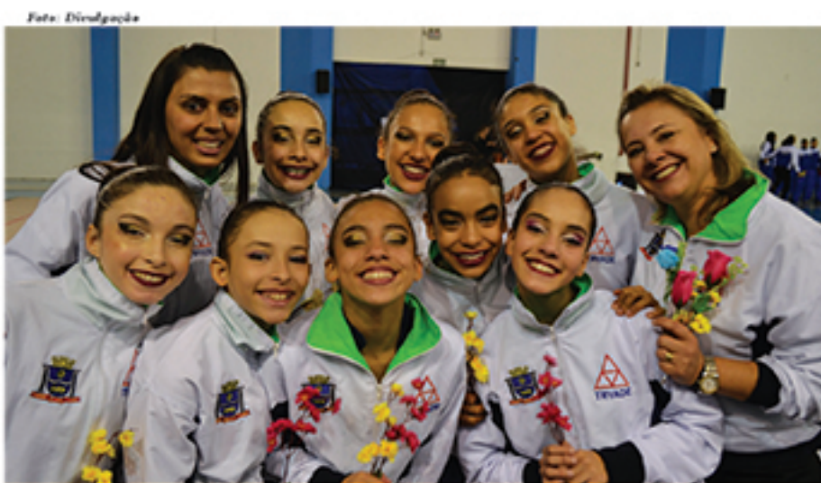
Ginastas de Mauá e técnicas que conquistaram o vice-campeonato nos Jogos Regionais