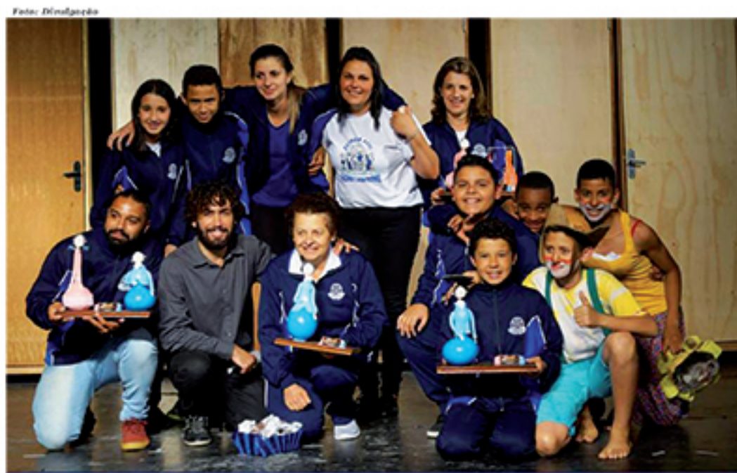
Companhia Pó de Estrela tem se destacado ao participar de festivais pelo Estado de São Paulo