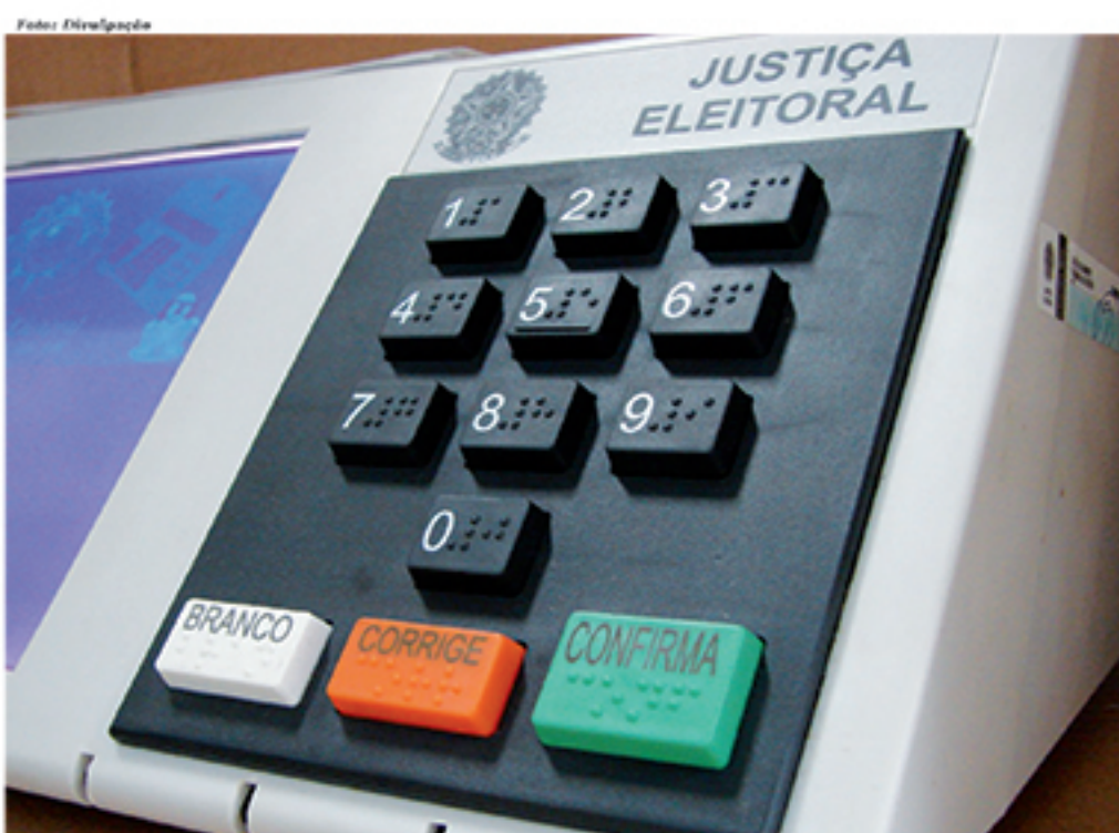
Desempenho do PT nas eleições de 2016 denota queda do prestígio do partido nos últimos anos