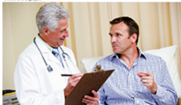
Ministério da Saúde lançará ações para estimular que homens cuidem da saúde