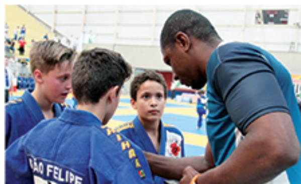
Sensei Sabinão orientando atletas durante os combates