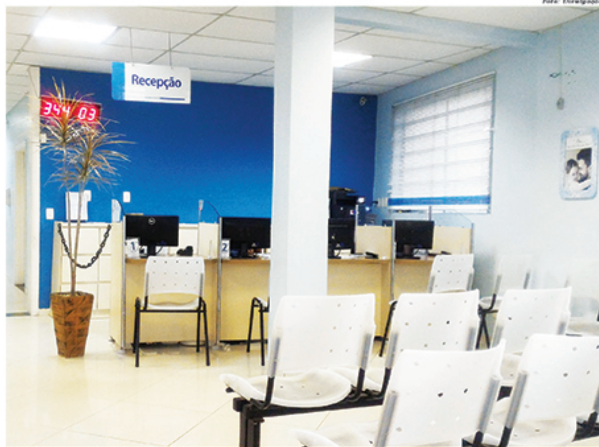
Hospital Vital atende a população de Mauá e do Grande ABC em diversas especialidades

É nesse posicionamento que uma instituição que visa a promoção da saúde e do bem-estar se movimenta: ampliando seus objetivos e pensando sempre à frente. Esse posicionamento é confirmado a cada dia, mostrando que é possível inovar e crescer. Por isso amplia-