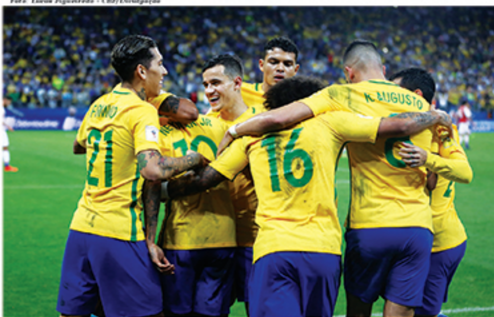
Em rodada perfeita, Brasil vence o Paraguai e se garante na Copa do Mundo de 2018