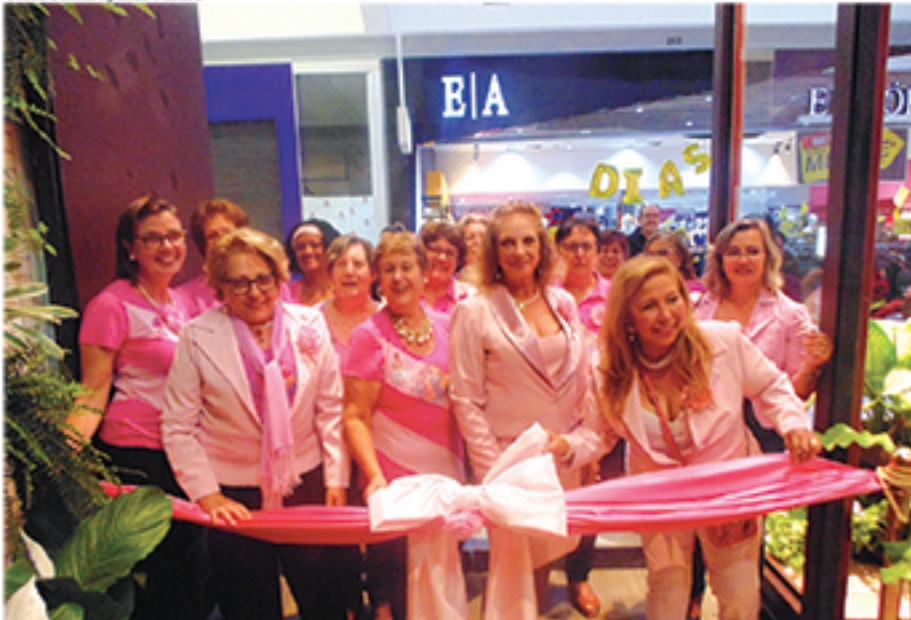
Loja da REFEMA no Mauá Plaza Shopping é uma das novidades na cidade para o Outubro Rosa. Objetivo é levar informação à população quanto ao tema