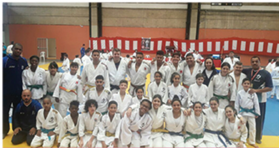
Parte da equipe da Associação Mauá de Judô