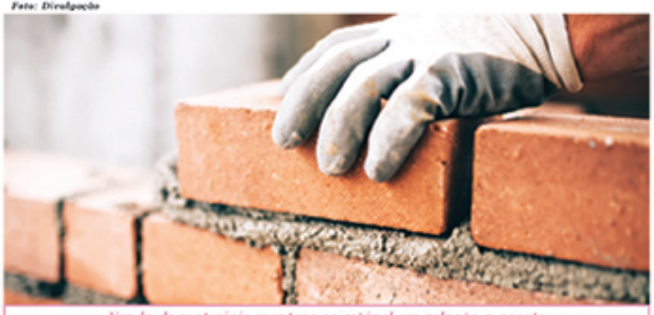
Venda de materiais manteve-se estável em relação a agosto