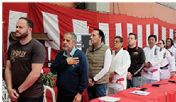
Mesa de honra composta por medalhistas olímpicos, autoridades políticas e esportivas