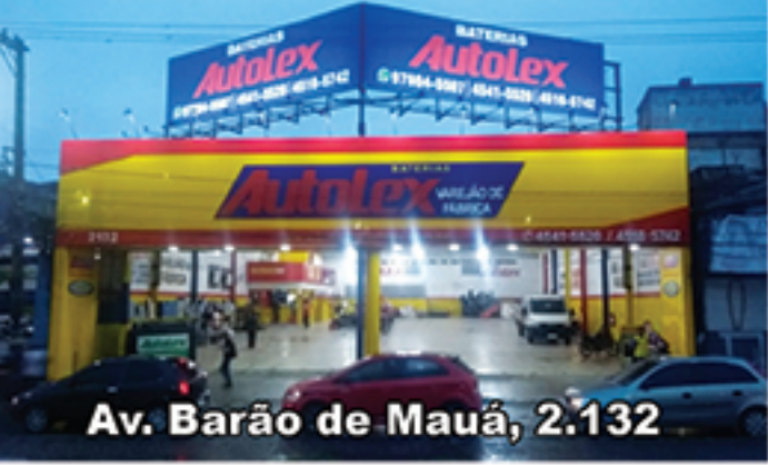
Av. Barão de Mauá, 2.132