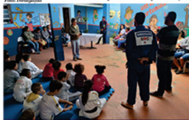
Palestra foi uma das ações da Semana do Meio Ambiente