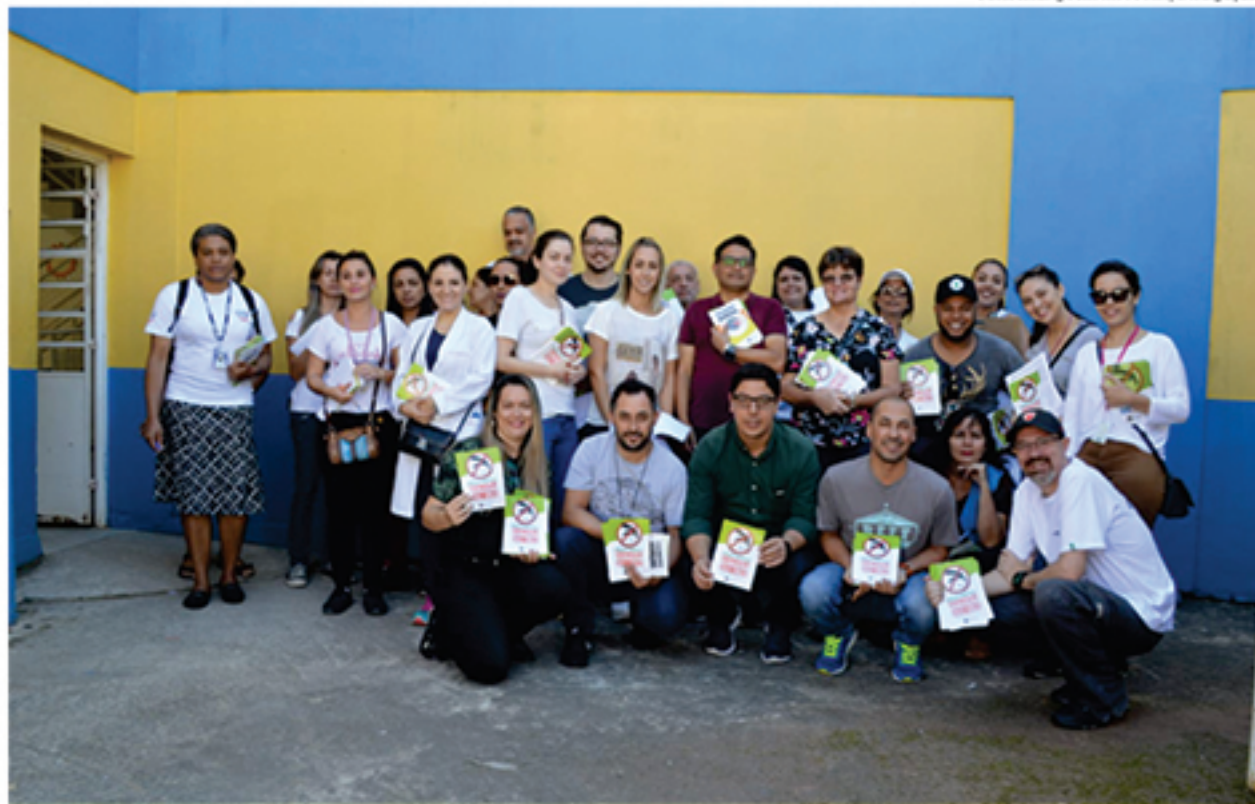
Funcionários da Secretaria da Saúde e de várias outras pastas participaram da força-tarefa deste sábado