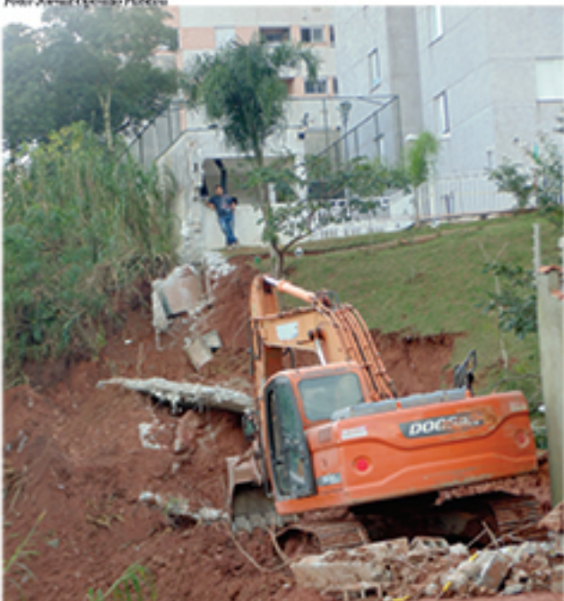
Parte de parede que sustenta área de lazer do condomínio começou a desabar por conta dos deslizamentos de terra