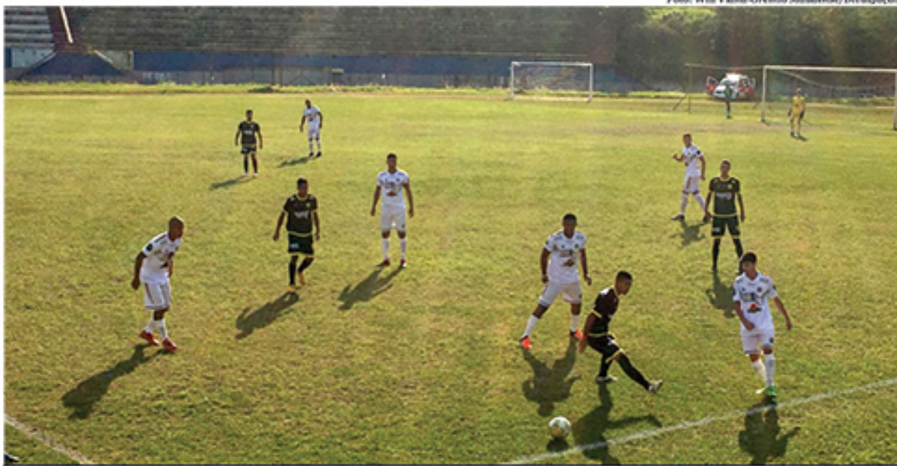
Grêmio Mauaense encaminhou classificação após primeira vitória no dérbi da cidade