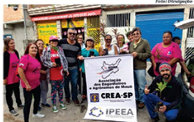
ASSEAM e Crea-SP participaram das atividades da semana

jas da mata e pitangas, porque além de todas as vantagens que conhecemos sobre a arborização, estas espécies atraem pássaros para a área urbana, o que controla a proliferação de