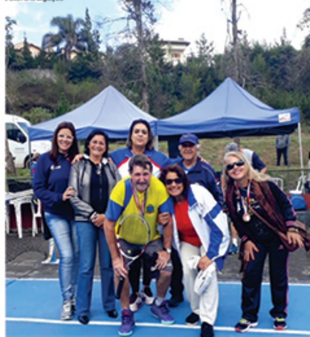
Delegação mauaense conquistou 35 pontos no JORI