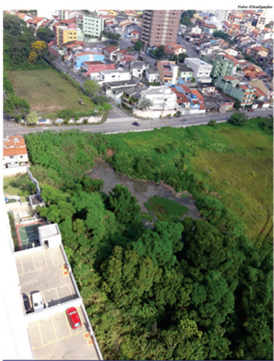
Foto tirada de um dos prédios mostra como está situação do esgoto no terreno

Para piorar a situação, parte de uma parede que sustenta a área de lazer do condomínio - onde estão a quadra poliesportiva e a churrasqueira - começou a desmoronar recentemente, graças aos deslizamentos de terra no terreno, o que tem gerado preocupação sobre um possível desabamento de parte desta estrutura. A construtora responsável pelo empreendimento, inclusive, já disponibilizou uma máquina que nesta semana já trabalhava na limpeza e manutenção do local. ◊