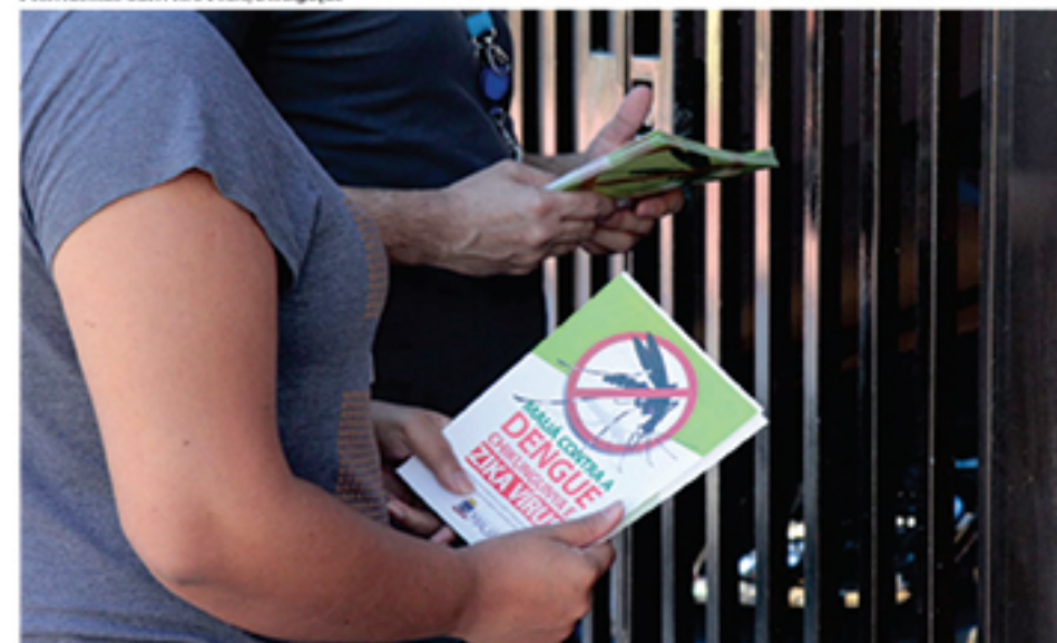
Material entregue à população alertou sobre as doenças transmitidas pelo mosquito Aedes Aegypti