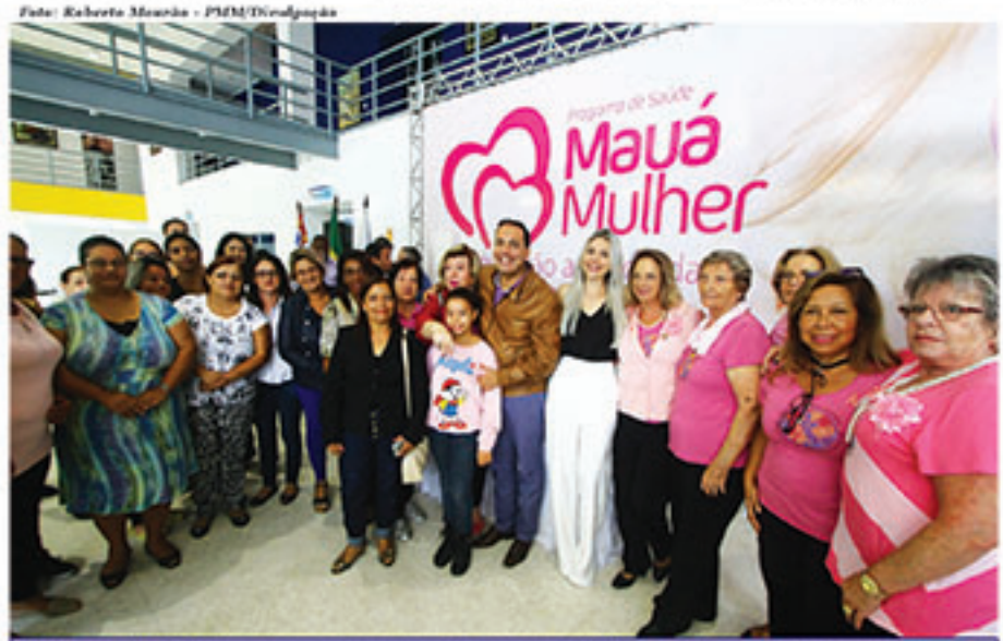
Mulheres de vários grupos marcaram presença na cerimônia de lançamento do novo projeto