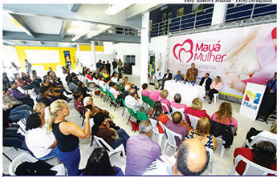
Lançamento do programa Mauá Mulher aconteceu no último dia 20, no Teatro Municipal

têm até 49 anos precisam apresentar o pedido emitido por um médico da rede particular ou da rede pública. Além de mamógrafo, o veículo é equipado com aparelho de ultrassom, conversor de imagens analógicas em digitais, impressoras, antena de satélite, computadores, mobili-