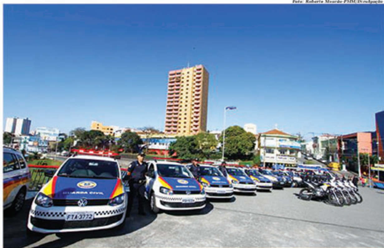
Números da Secretaria de Segurança do Estado mostram melhoria na segurança em Mauá