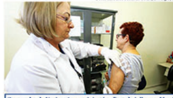
Campanha de Vacinação seguirá até o dia 7 de julho em Mauá

parto). Na cidade, era prevista a imunização de 715 mulheres, mas 769 foram vacinadas, 107%. Na sequência aparece a população de idosos, que previa que 35.178 pessoas tomassem a vacina; até sexta-feira (23) foram 35.164 doses aplicadas dentro do grupo. Os profissionais da saúde também compareceram em peso foram 6.900 vacinados, 90% do esperado. Entre as crianças foram 18.663 vacinas (72% do total esperado); com as gestantes foram 2.920 (67% do previsto); fecha a lista do grupo previsto para a vacinação os profissionais da educação, com 3.182 vaci-