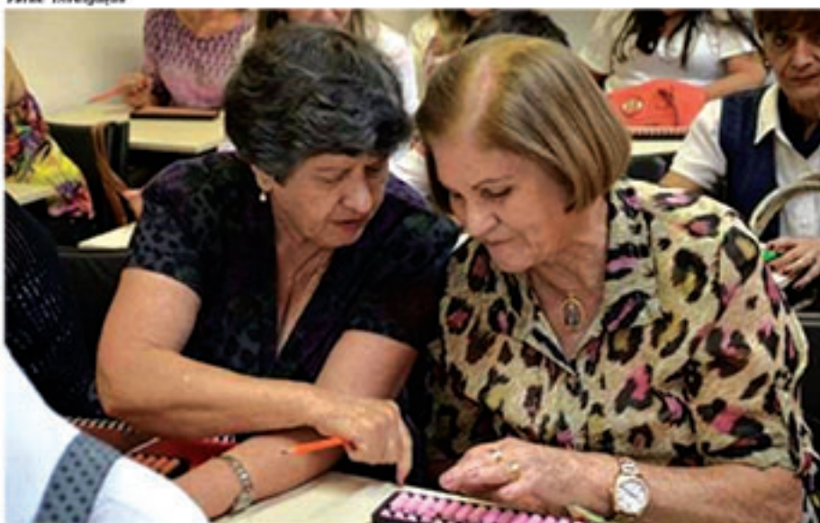
Estimular a memória traz inúmeros benefícios para a saúde