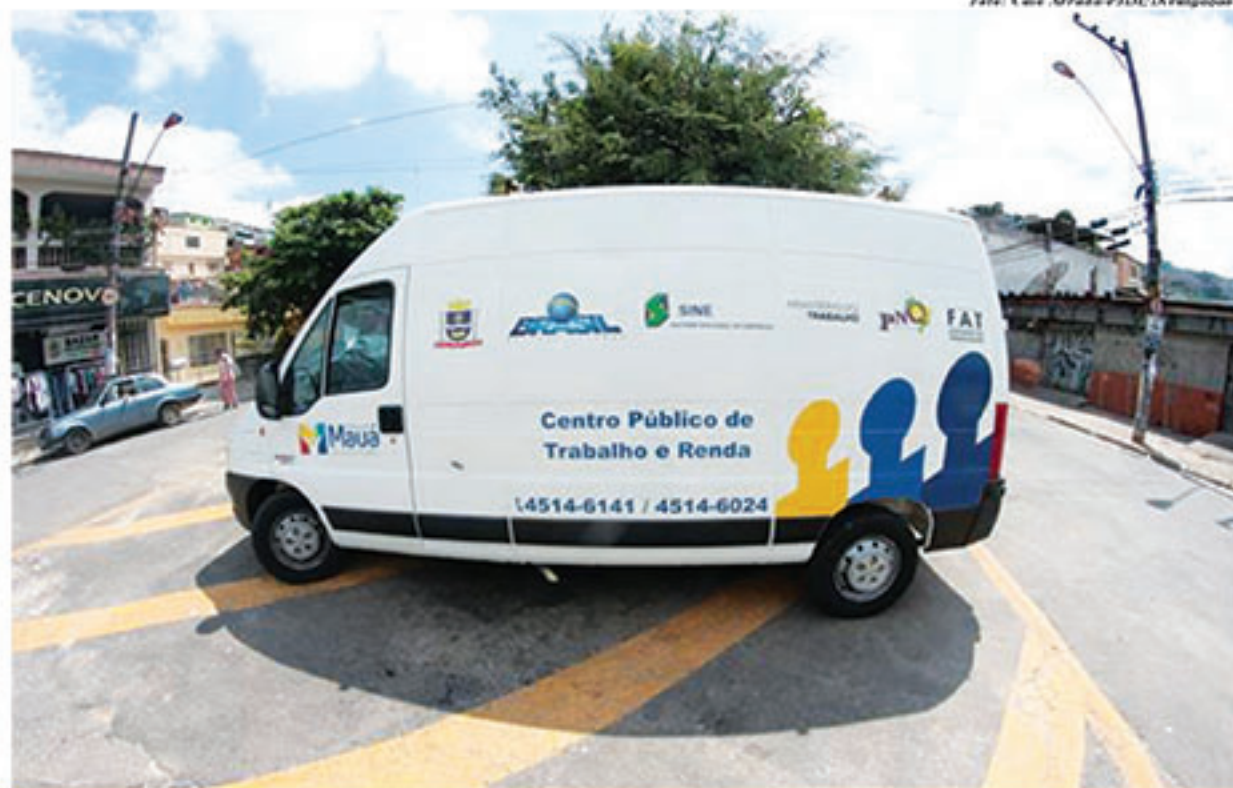
CPTR Móvel está levando seus serviços a três bairros de Mauá nesta semana

Além da unidade móvel, a sede física do Centro Público de Trabalho e Renda, localizado na Rua Manoel Pedro