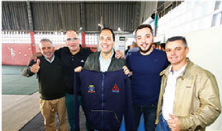
Associação Tryade segue com seus projetos esportivos contando com o apoio da atual gestão

Escola Municipal Américo Perrella – Ginástica