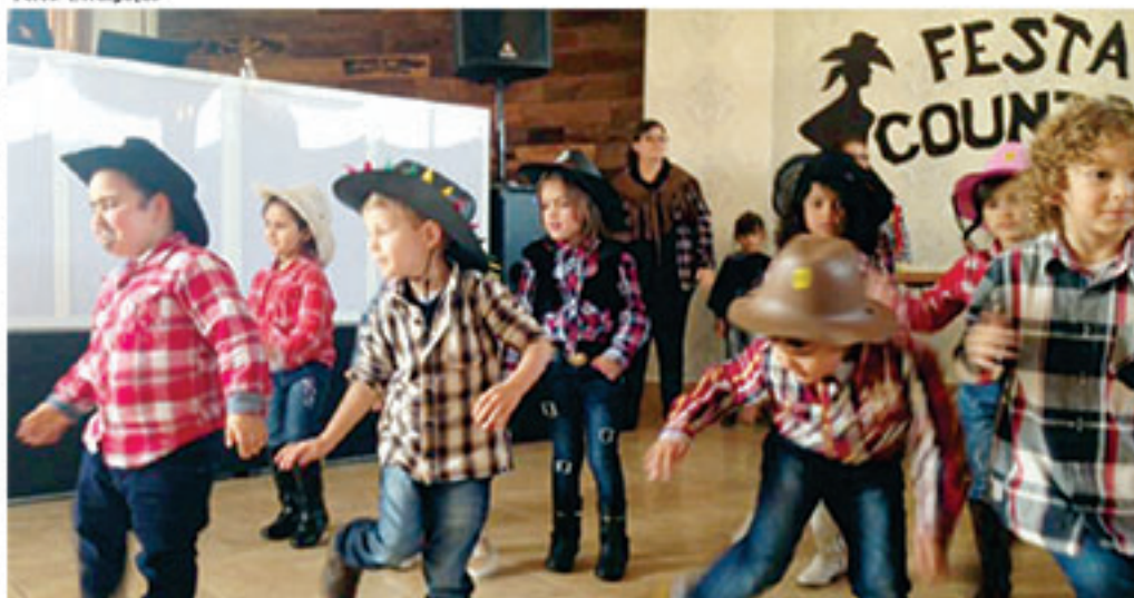
Na edição do ano passado, a festa teve motivo country