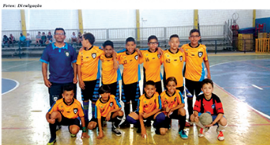
Equipe do Valência