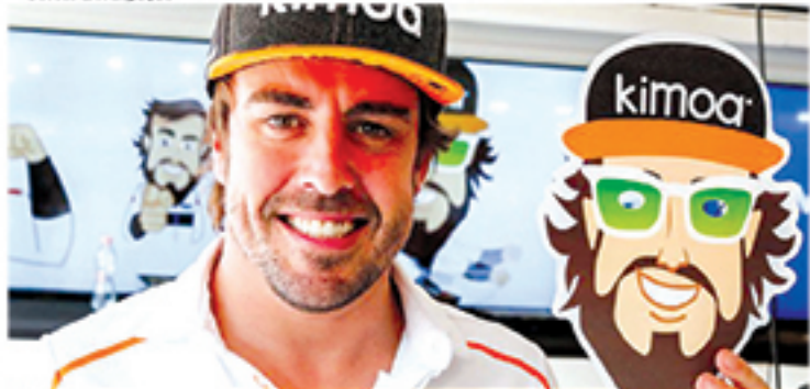
Se vencer as 500 Milhas de Indianápolis, Alonso será o segundo piloto da história a conquistar a Triplíce Coroa do automobilismo