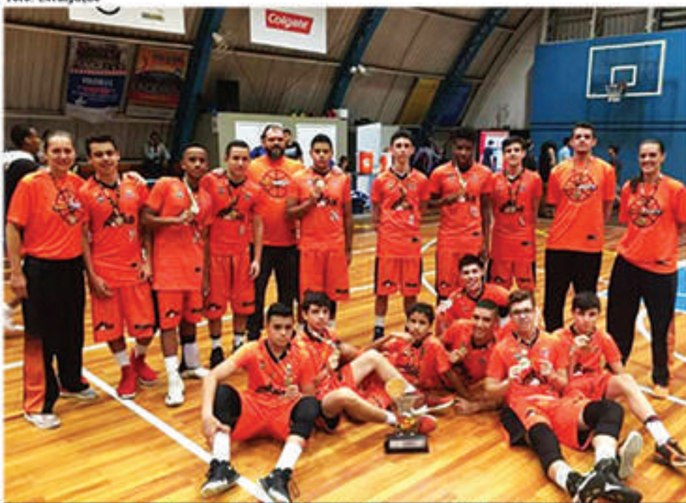
Convite para disputa no Chile foi feita pela Federação Paulista de Basketball, já que Mauá está entre os oito melhores times do Estado

No último sábado (2) foi realizada a 3ª rodada do Campeonato Municipal Sub-15 de futebol