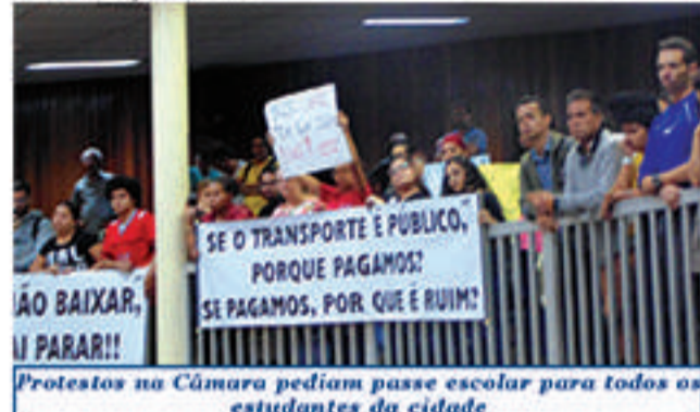
Protestos na Câmara pediam passe escolar para todos os estudantes da cidade

constituição coloca que todos são iguais perante a lei", ressaltou.