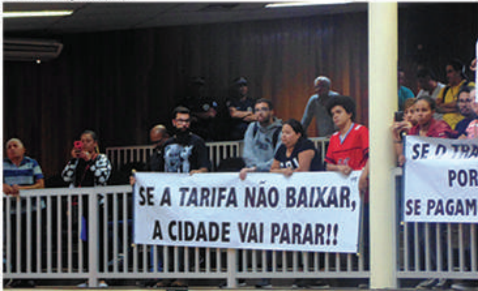
Municípios protestaram contra medidas impostas pela prefeita referentes ao passe escolar