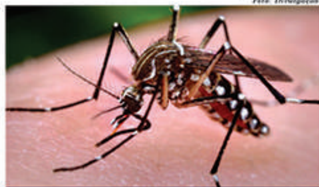
Surto de dengue tem colocado cidades em alerta em SP

Segundo os dados da pasta, pelo menos 500 casos suspeitos das doenças aconteceram em Igarapava. Já em São Joaquim da Barra, quatro mortes por dengue foram confirmadas pelas autoridades. Além disso, o Ministério da Saúde mapeou um trecho de 80 km na Rodovia Anhanguera onde se concentram a maioria dos casos de dengue na região de Ribeirão