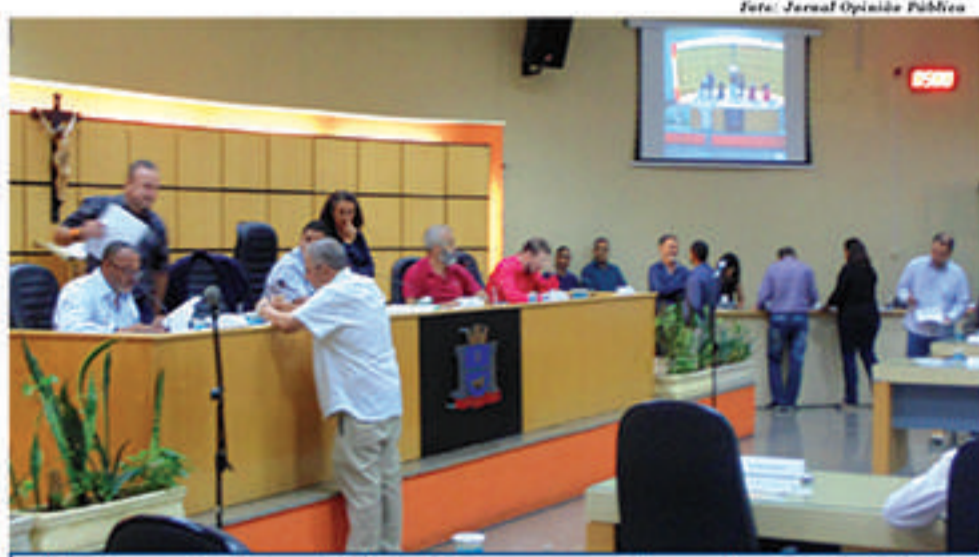
Primeira sessão do ano decidiu também novos nomes das comissões fixas da Casa