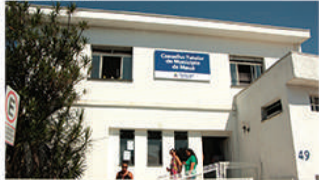
Nova sede do Conselho Tutelar de Mauá tem estrutura maior para atendimentos