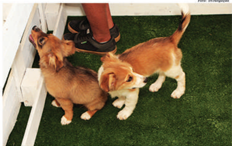
Ao todo, 25 animais foram adotados durante o festival de adoção

De acordo com a administração municipal, a mu-