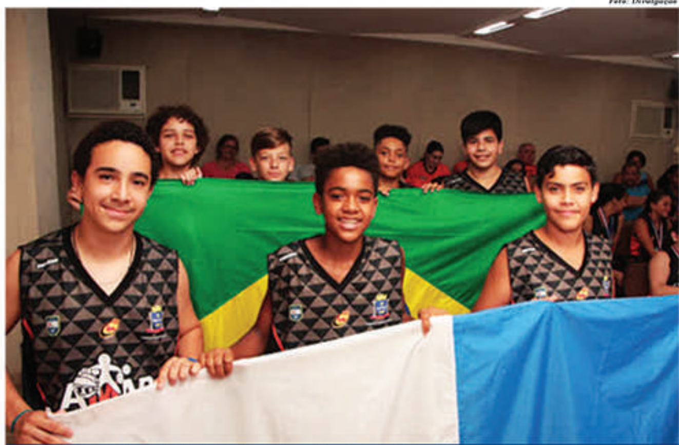
Terceiro lugar na Copa Valdivia, disputada no Chile, é um resultado expressivo para o basquete mauaense

Pela primeira vez, Mauá tem uma equipe feminina de basquete Sub-13. O time foi formado em 2018