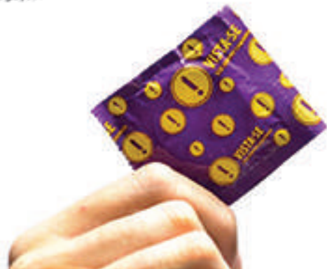
Preservativo ainda é o principal método contraceptivo masculino