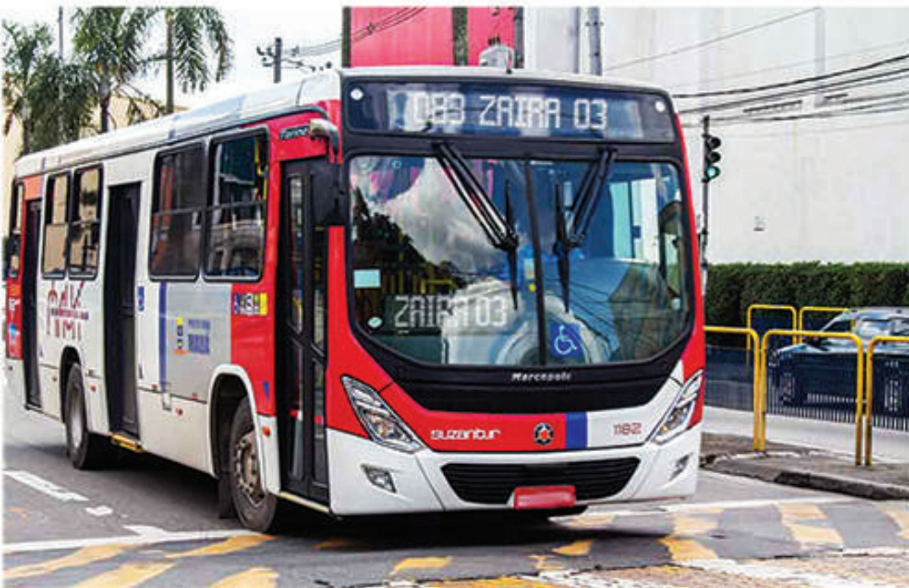
Para Aguinaldo, população não pode pagar a conta de más administrações na cidade