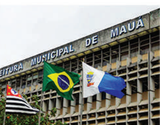
Um dos primeiros aumentos anunciados por Alaíde foi o do IPTU

"O vale-transporte é despesa para as empresas e não gera nenhum ganho adicional ao funcionário, então não podemos concordar com aumentos numa cidade onde se tem pouco trân-