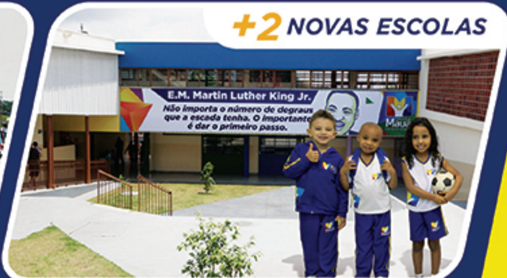
+2 NOVAS ESCOLAS

A Prefeitura de Mauá trabalha com planejamento, respeito e muita dedicação para melhorar cada vez mais a sua qualidade de vida.