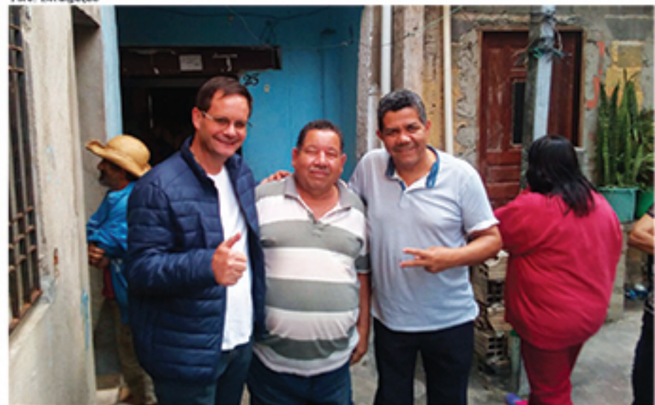
Bonome está ouvindo demandas na região do ABC