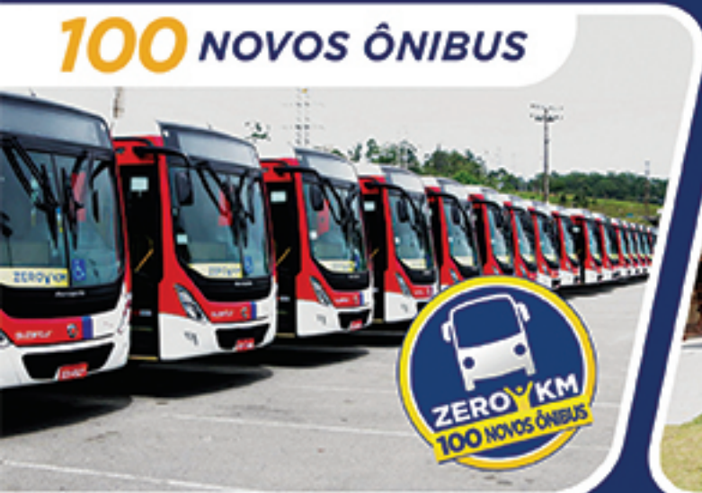
100 NOVOS ÔNIBUS