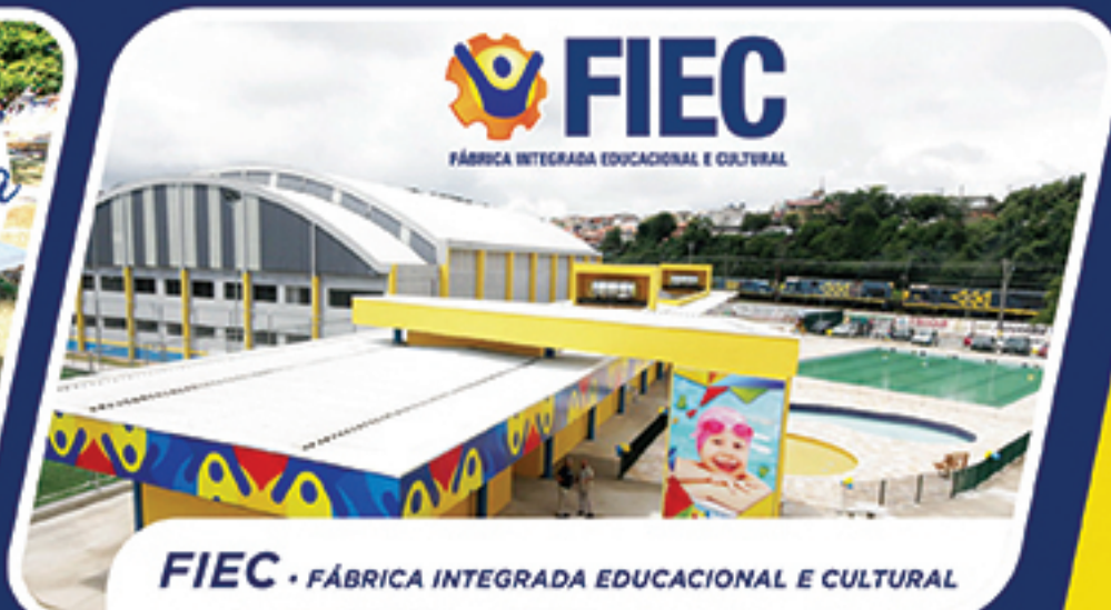
FIEC - FÁBRICA INTEGRADA EDUCACIONAL E CULTURAL