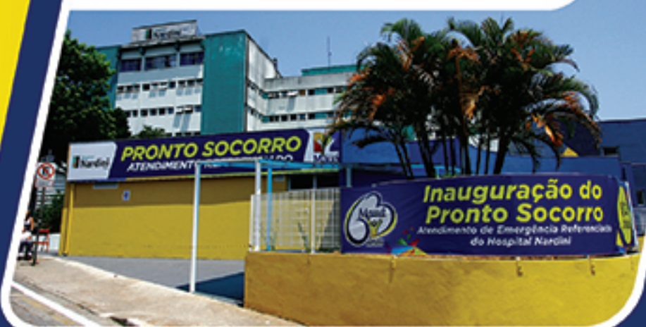
REVITALIZAÇÃO • HOSPITAL NARDINI