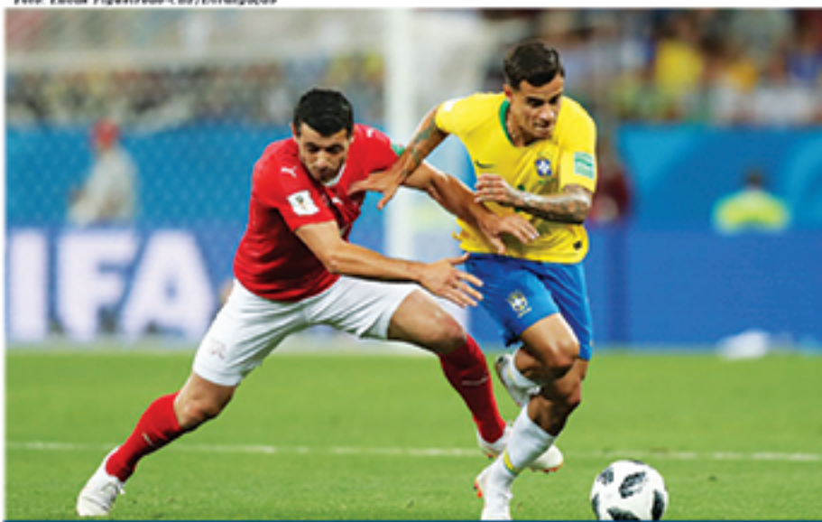
Após polêmica na primeira partida, CBF pediu explicações à FIFA sobre o VAR