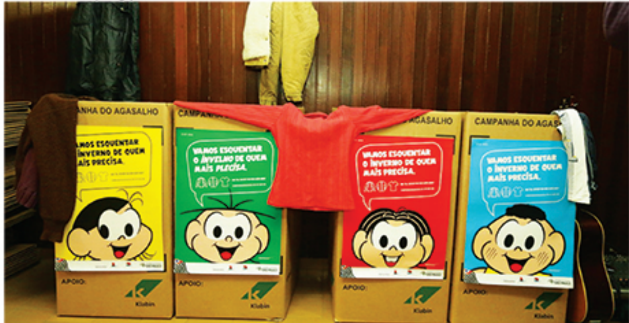
Temática da Campanha do Agasalho 2018 envolve as personagens da Turma da Mônica

neficiar pessoas em situação de rua será a criação de um abrigo de inverno temporário, no antigo restaurante po-