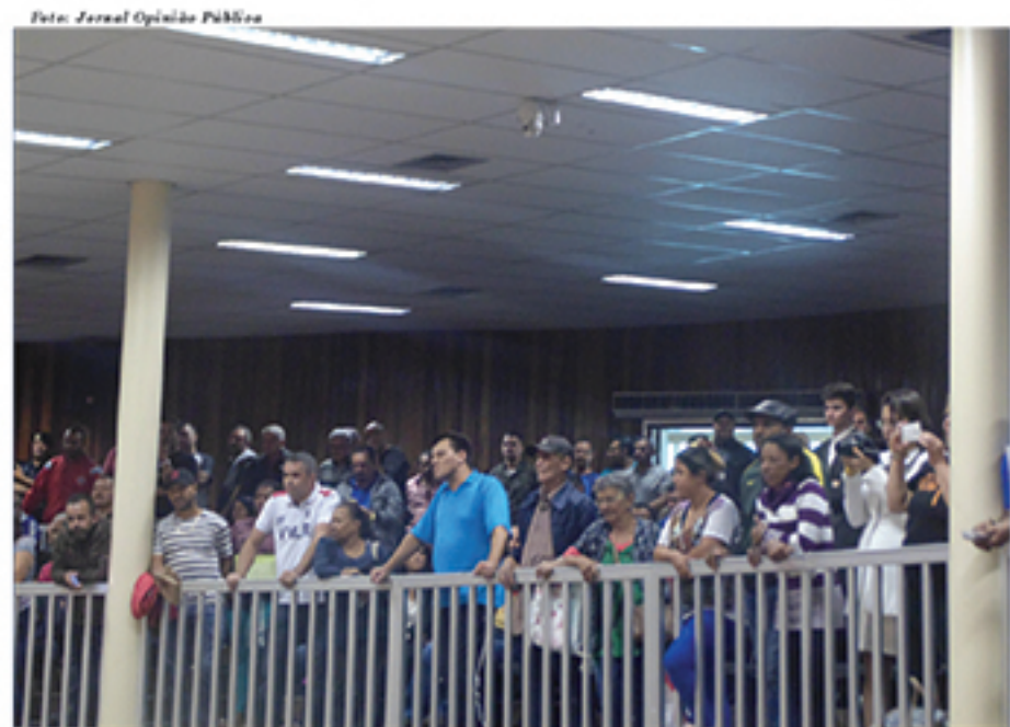
Municípios protestaram novamente na Câmara Municipal de Mauá contra a Taxa de Lixo