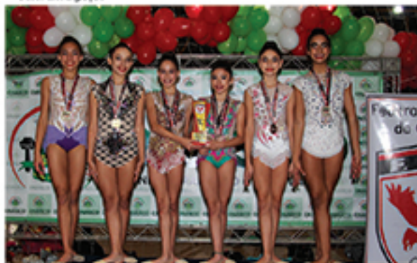
Atletas de Mauá conquistaram bons resultados na competição realizada nos dias 9 e 10 de junho, em Osasco