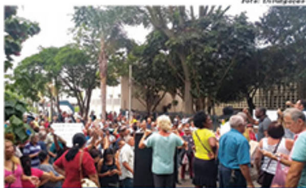
Manifestantes protestaram contra a taxa do lixo na Câmara e em frente a Prefeitura de Mauá