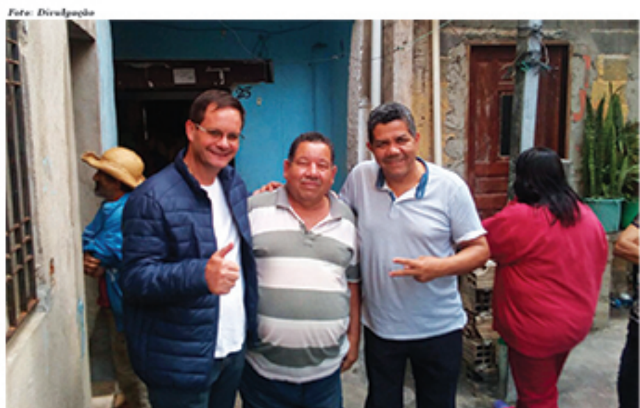
Bonome está ouvindo demandas na região do ABC

"QUALQUER SONHO GRANDE COMEÇA COM UM PRIMEIRO PASSO.