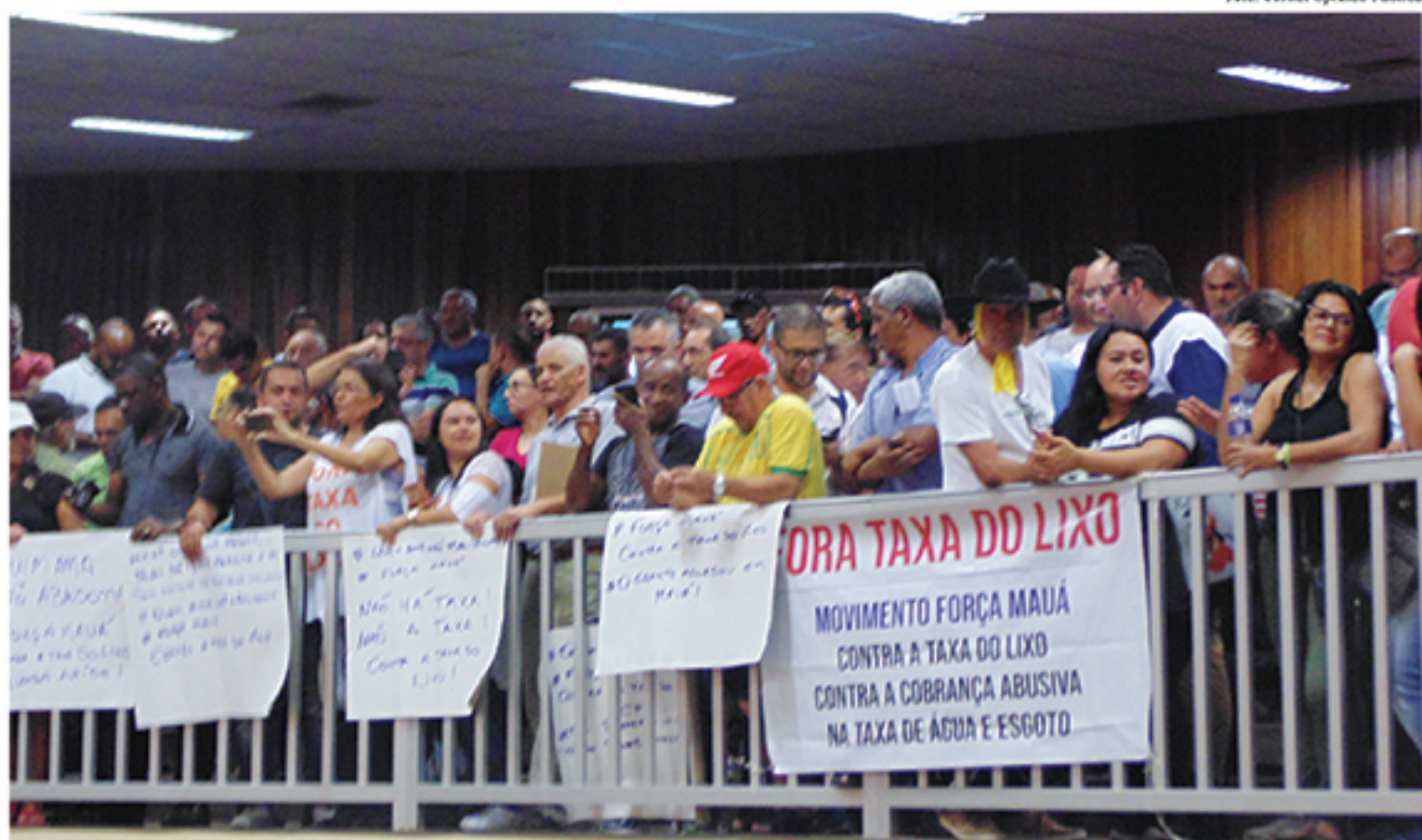
Grupos protestaram dentro da Câmara Municipal de Mauá pedindo a revogação da Taxa de Lixo em Mauá

"O que ocorreu é que após essa faixa dos 20 (metros cúbicos de resíduos), ela automaticamente se transferia para os 50. O que fizemos foram as subdivisões, do 20 para o 30, do 30 para o 40 e do 40