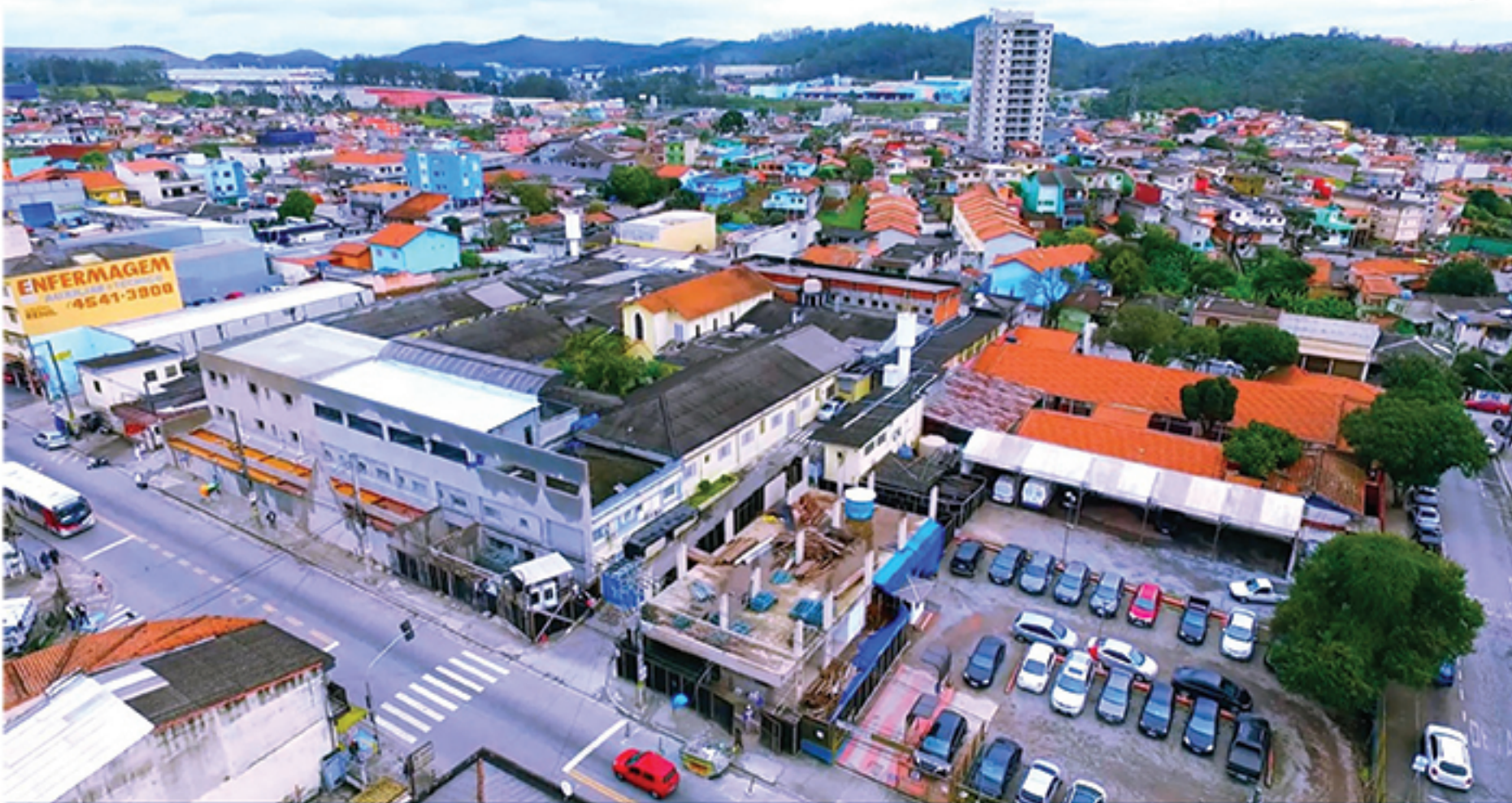
Vista aérea da Santa Casa de Mauá, que ainda está passando por reformas para entregar a primeira etapa de sua ampliação e modernização

Completando 52 anos desde sua fundação, a Santa Casa de Mauá tem buscado garantir mais modernidade aos seus pacientes, mantendo a saúde administrativa. E quem ganhará com isso será a população da Região do Grande ABC, que receberá como presente a modernização do Hos-