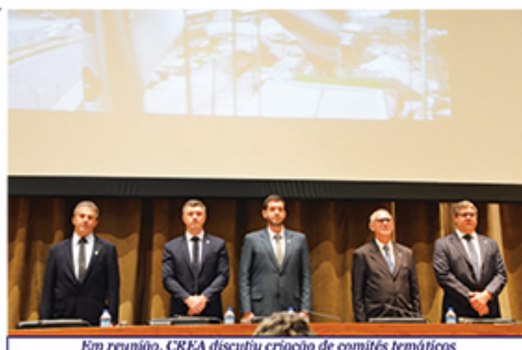
Em reunião, CREA discutiu criação de comitês temáticos