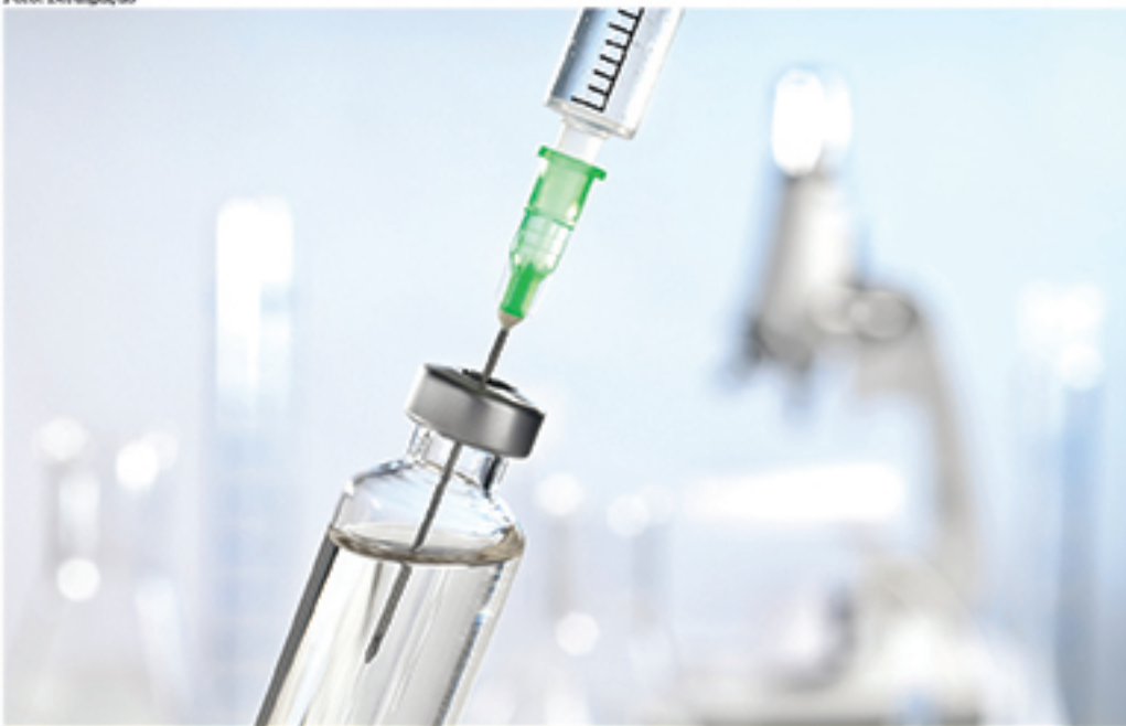
Nova vacina contra a malária será testada primeiramente em Malawi. Gana e Quênia também receberão doses