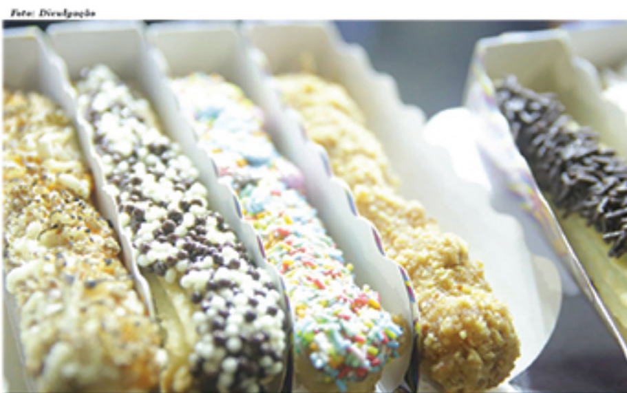
Segundo Festival de Churros trará opções variadas para público mauauense