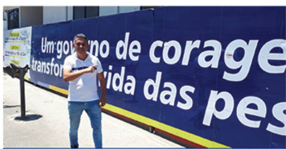
O empresário também pediu mais fiscalização na saúde mauauense