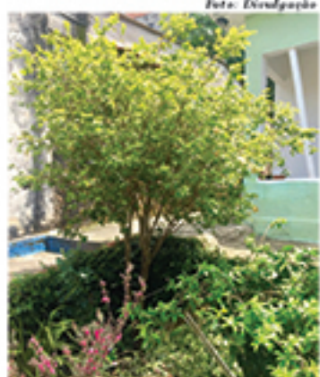
Projeto visa contribuir com uma melhora do meio ambiente