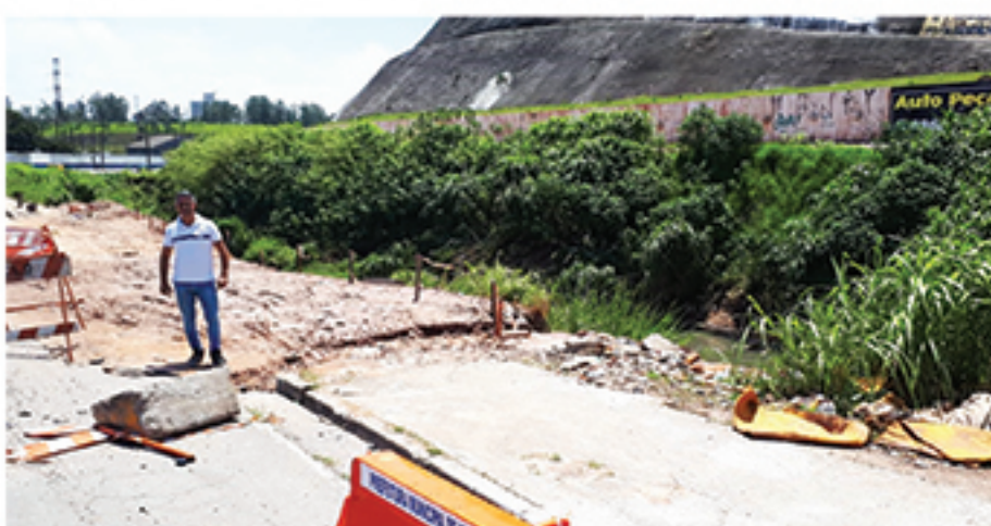
Obras paralisadas estão atrapalhando o trânsito na Avenida Alberto Sampaio