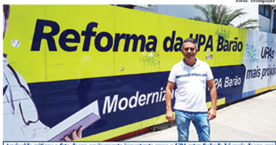
Aguinaldo criticou o fato de um equipamento importante como a UPA estar fechado há mais de um ano