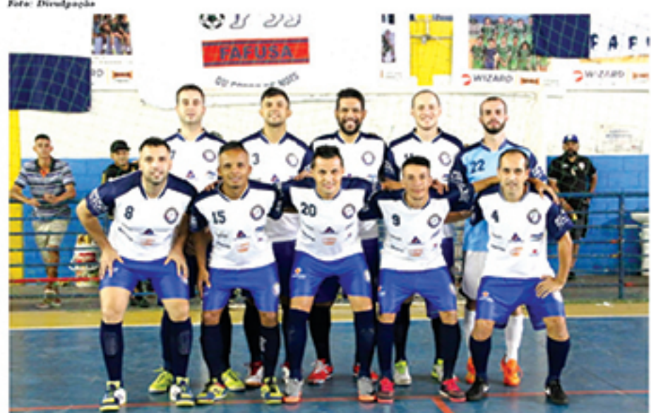
Equipe do FAFUSA, que goleou na última rodada o C.A.P.A