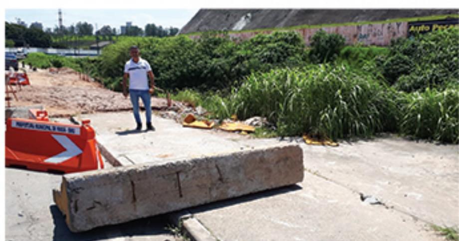
Via é uma das mais importantes na região central de Mauá, com grande tráfego de veículos