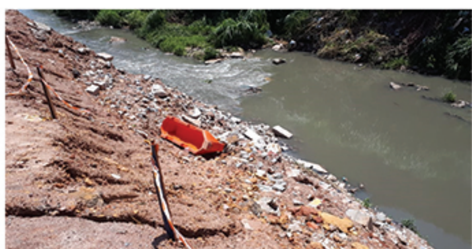
Entulhos estão jogados à margem do córrego que corre ao lado da avenida