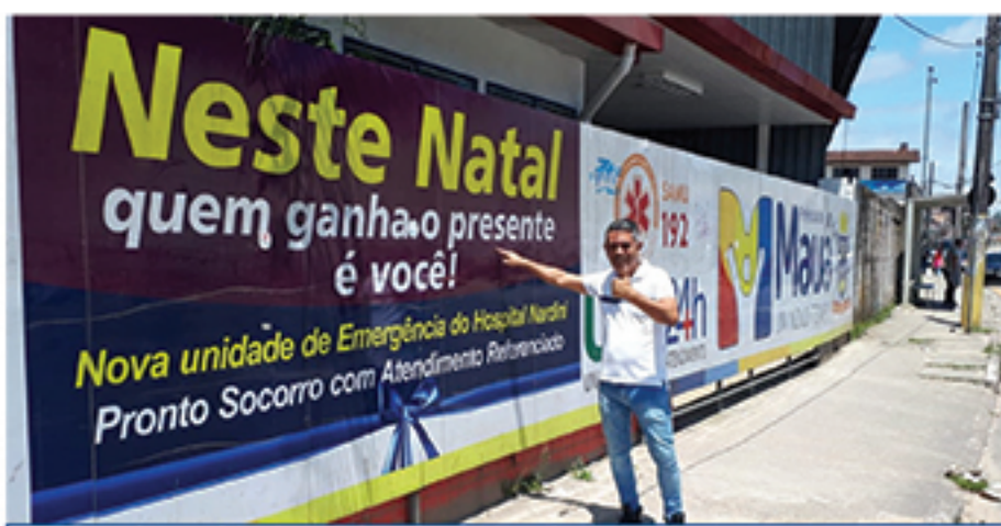
Propagandas também foram alvo das críticas de Aguinaldo, por serem muito onerosas