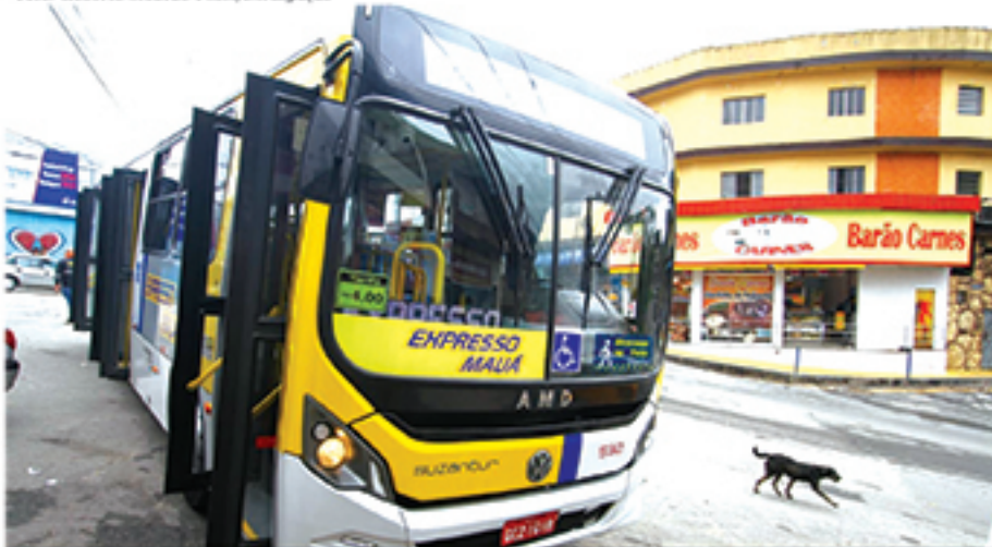
Inauguração da sétima linha do Expresso Mauá foi uma das ações em comemoração ao aniversário de Mauá