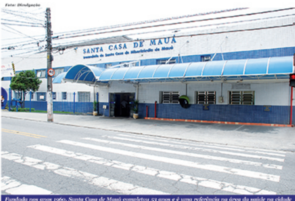
Fundada nos anos 1960, Santa Casa de Mauá completou 53 anos e é uma referência na área da saúde na cidade