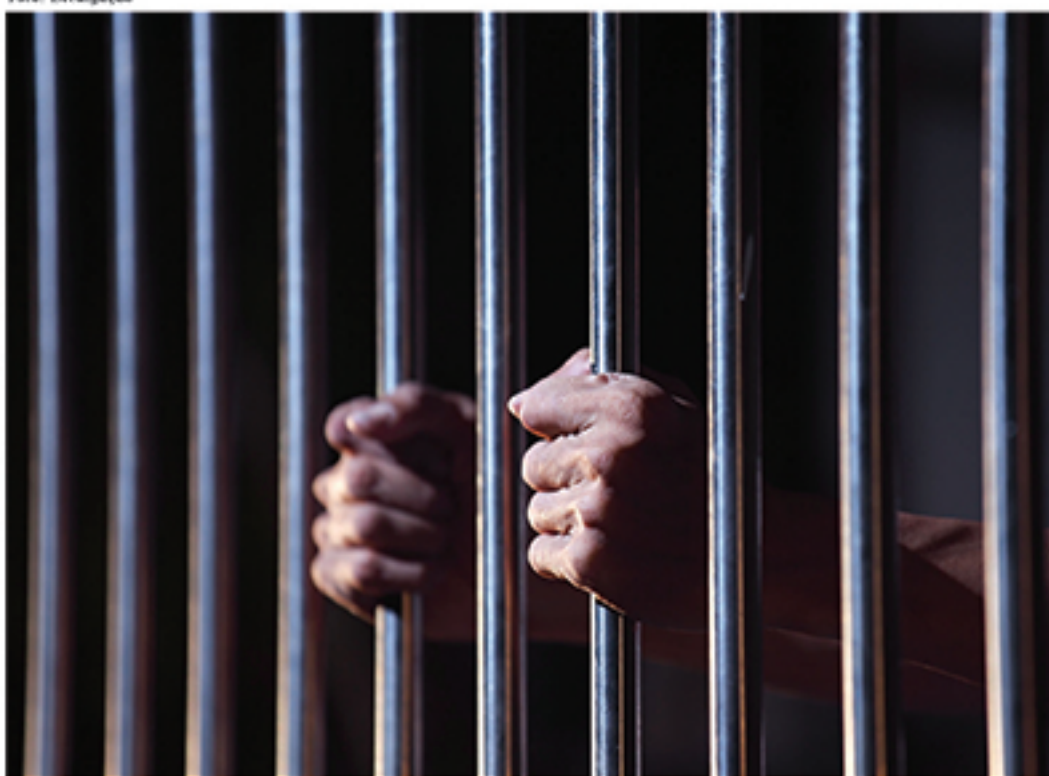
Atualmente, tramita na Câmara um projeto que fala sobre a diminuição da maioridade penal