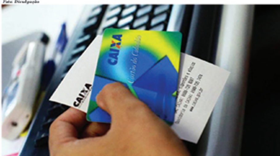
Estimativa é de que mais de R$ 2,8 bilhões sejam pagos à 3,4 milhões de trabalhadores