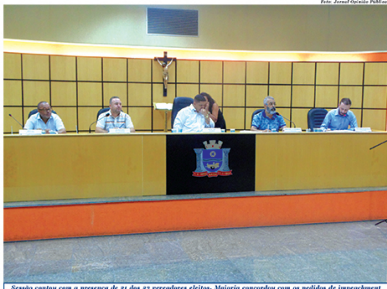
Sessão contou com a presença de 21 dos 23 vereadores eleitos. Maioria concordou com os pedidos de impeachment