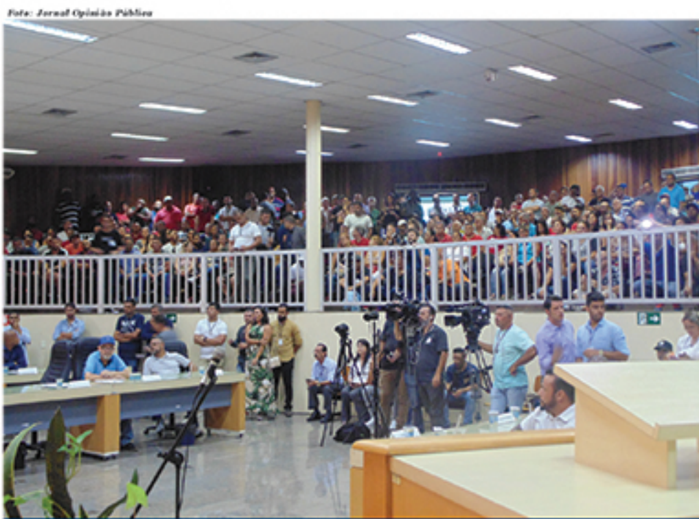
População compareceu em massa à primeira sessão extraordinária de 2019