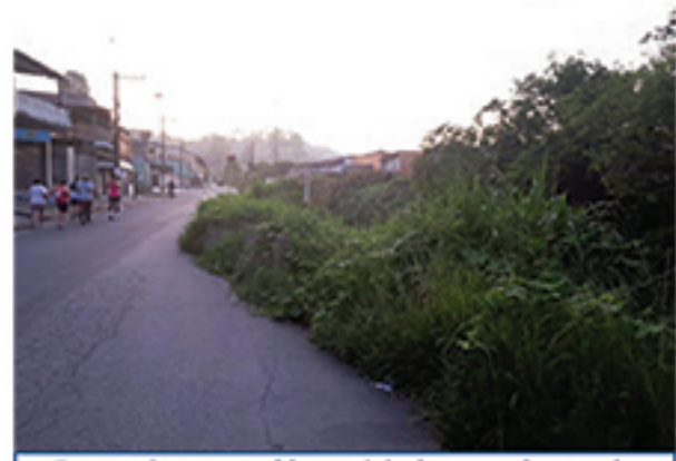
Cratera é outro problema visível para todos na via