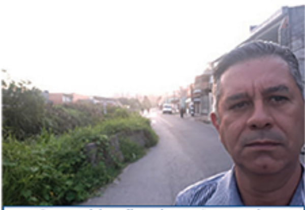
O empresário pediu mais atenção com a via