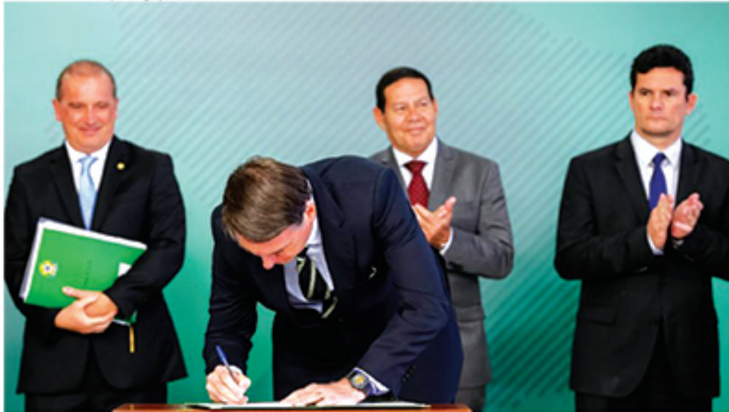
Decreto por posse de arma eliminou critérios subjetivos e aumentou prazo para renovação da licença