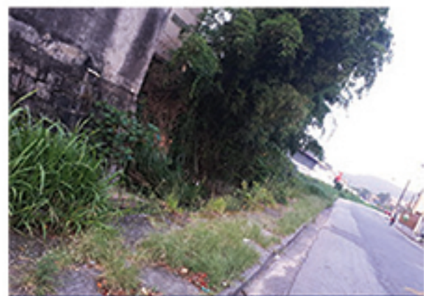
Matagal incomoda a população que mora na avenida