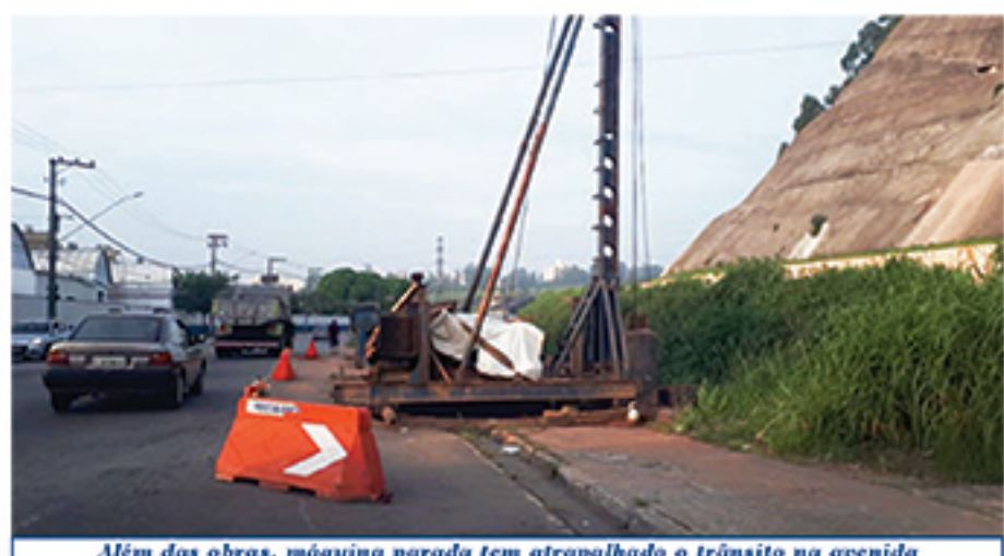
Além das obras, máquina parada tem atrapalhado o trânsito na avenida