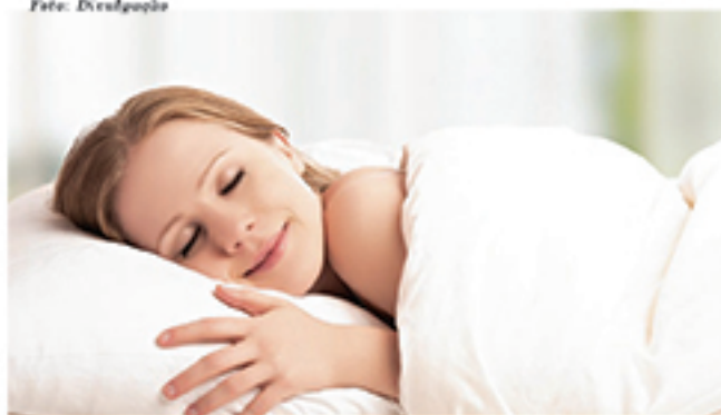
Boa noite de sono pode evitar problemas no coração