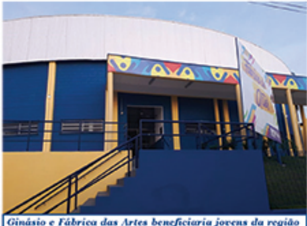
Ginásio e Fábrica das Artes beneficiaria jovens da região

que no local, durante à noite, muitas luzes ficam acesas no interior do equipamento e todo exterior, mostrando o mau uso do dinheiro