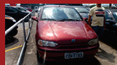
Palio Weekend 1998 1.6