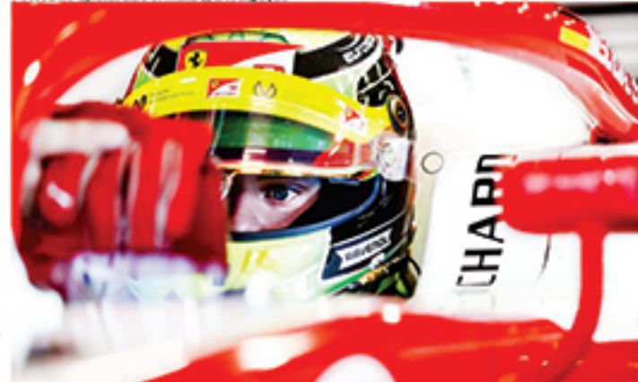
Mick Schumacher andará pela primeira vez em um Fórmula 1 em testes