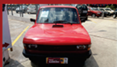
Fiat 147 1981 ÁLCOOL