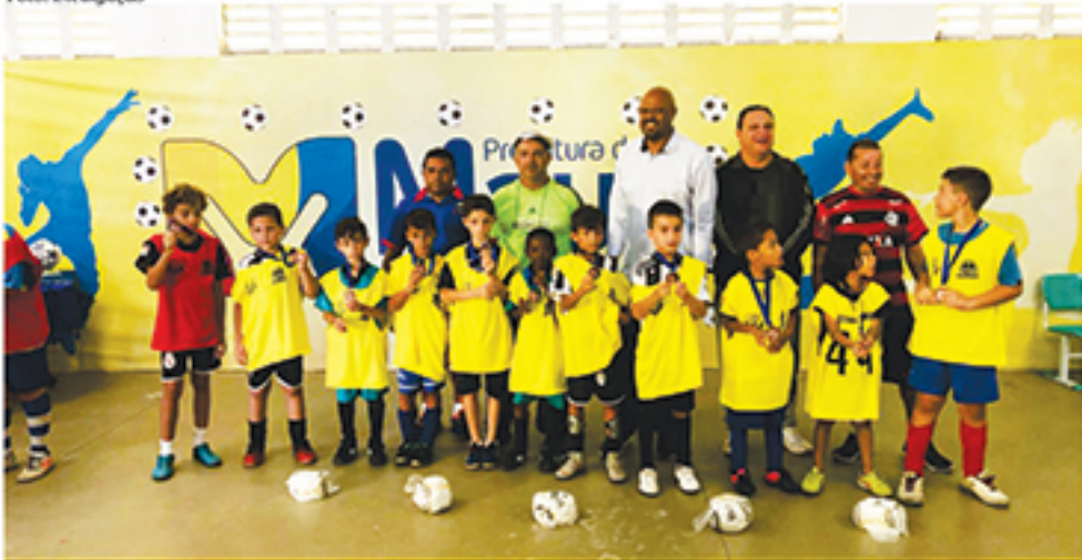
Jovens que participaram do campeonato receberam medalhas