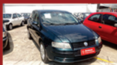
Fiat Stilo 2003 1.8