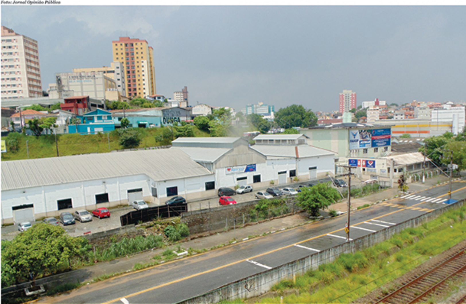
Compradores ainda buscam na justiça o ressarcimento de valores investidos na compra das unidades habitacionais no condomínio Cidade de Deus