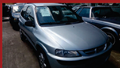
Celta 2P 2006 1.0 Flex