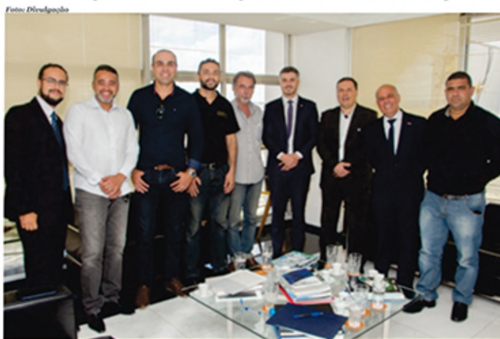
Diretoria da ASSEAM discutiu diversos assuntos com presidente do Crea-SP