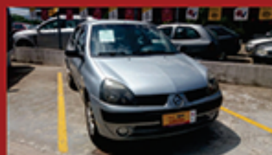
Clio Sedan Authentique 2005