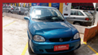
Corsa Hatch 4P 2002 1.0