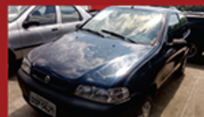
Palio EX 2P 2001 1.0