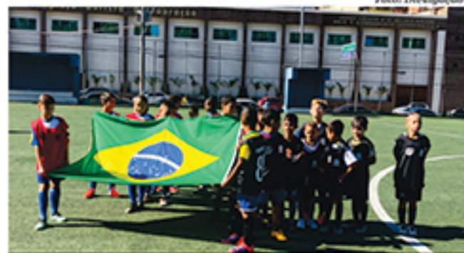
Jovens de 9 a 12 anos jogaram no campeonato

No geral, foram entregues 336 medalhas, cada