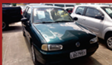
VW Gol 2P 1996 1.6