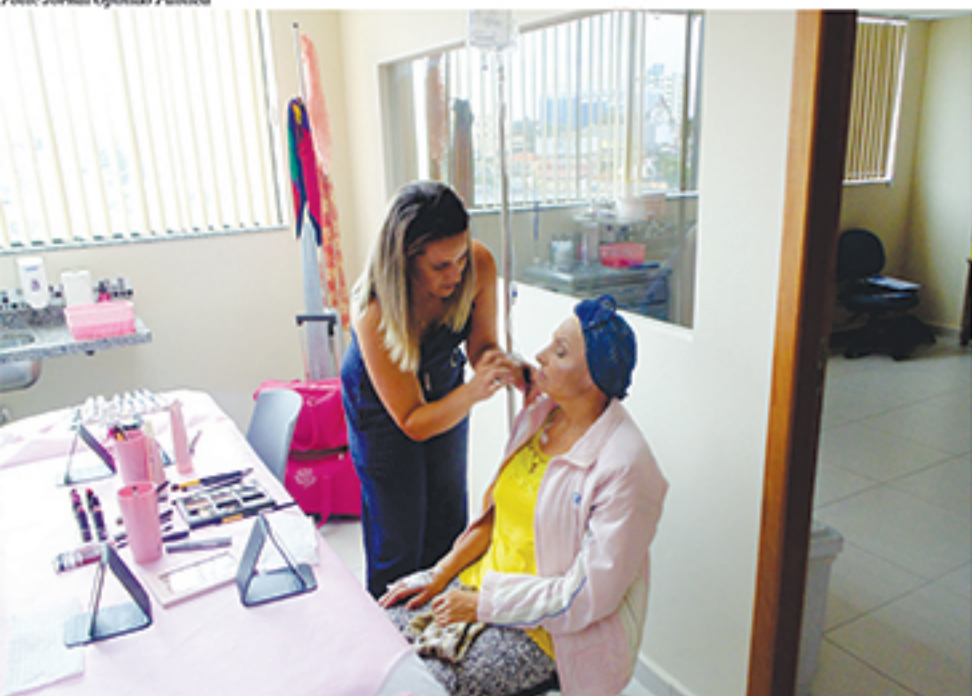
Dia da Beleza foi uma das campanhas propostas pela Santa Casa ao longo do mês de março