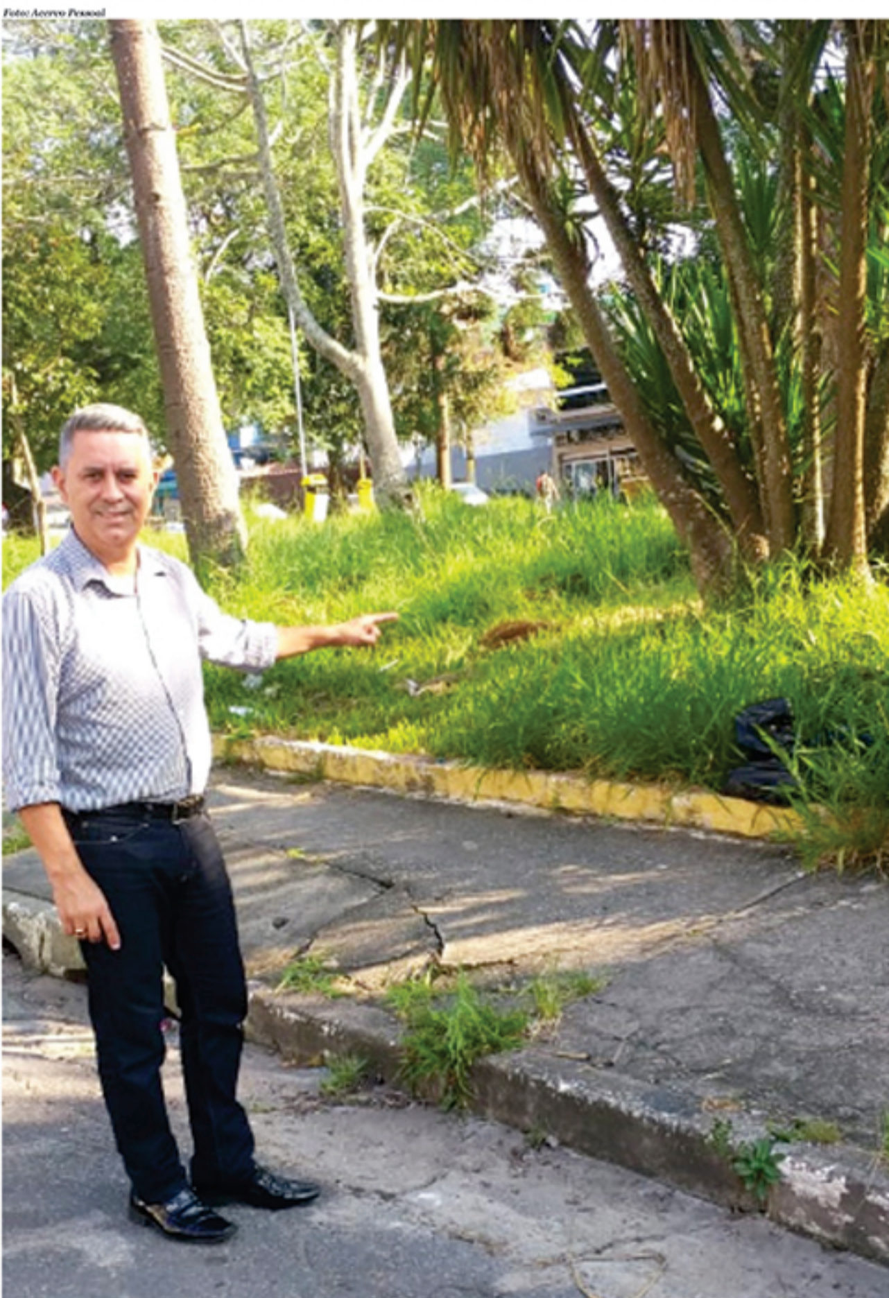
Empresário afirma que tanto o Poder Executivo quanto o Poder Legislativo precisam estar atentos a questões como essa

Sobre a comissão que investigará o abastecimento de água em Mauá, Aguinaldo disse que uma série de medidas precisa ser elaborada para a resolução do problema. o