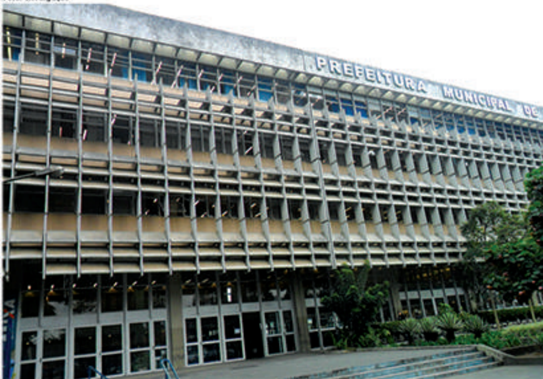
Prefeitura de Mauá pagou mais de R$ 1 milhão para empresa citada em documentos da operação "Trato Feito". Pagamento de mais de R$ 800 mil para outra companhia foi cancelado