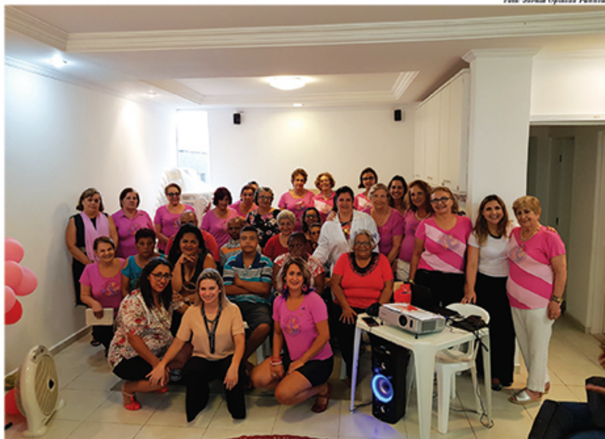
Palavra na REFEMA foi voltada para voluntárias e pacientes da Rede, que compareceram em bom número