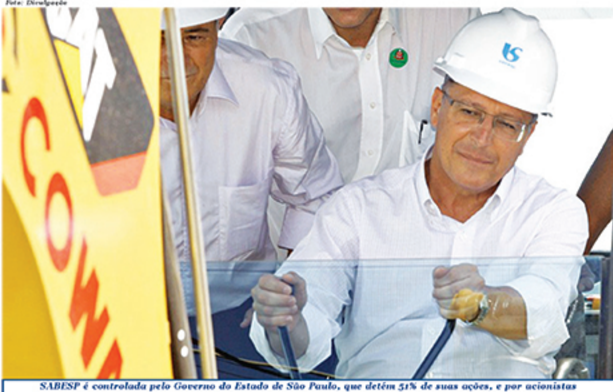
SABESP é controlada pelo Governo do Estado de São Paulo, que detém 51% de suas ações, e por acionistas