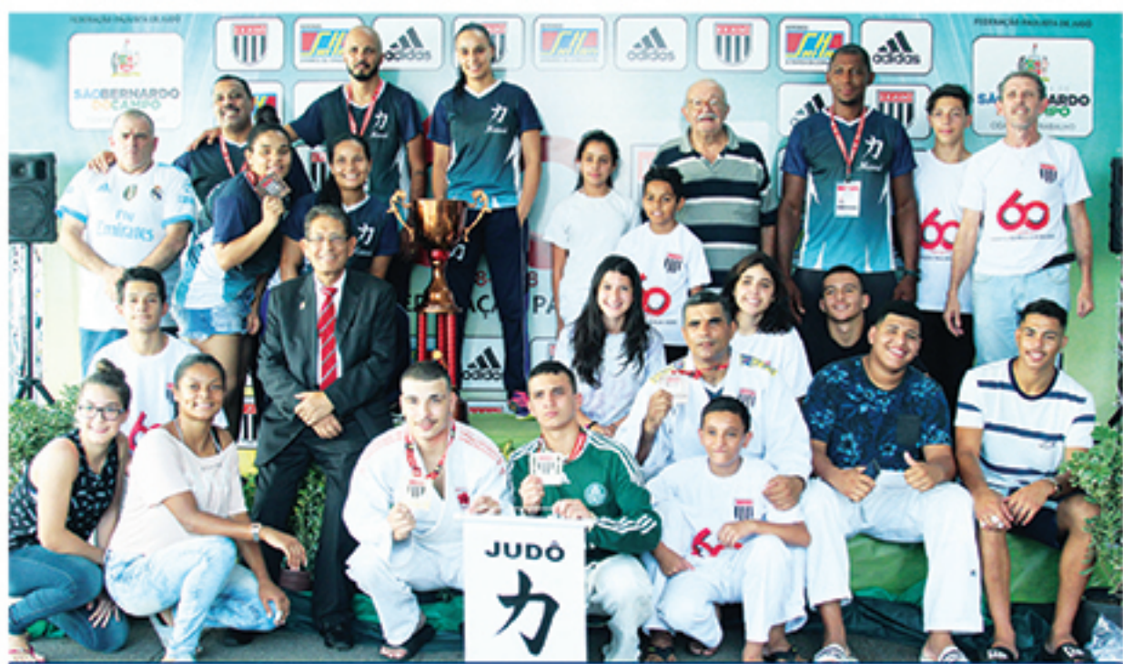
Parte dos professores e atletas da Associação de Judô Mauá no pódio