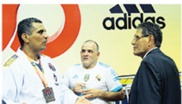
Atletas e professores exibem as medalhas e troféus conquistados na Copa São Paulo Aspirante