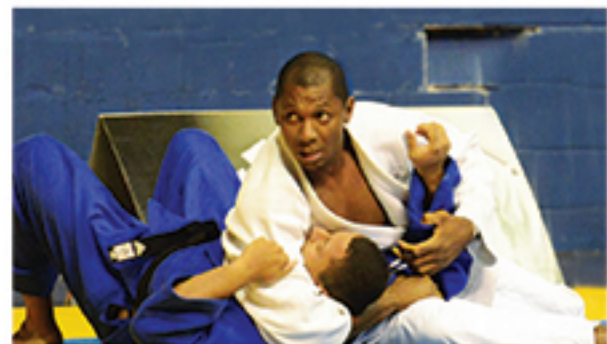
Sabinão venceu a final jogando de wazari e imobilizando no osae-komi