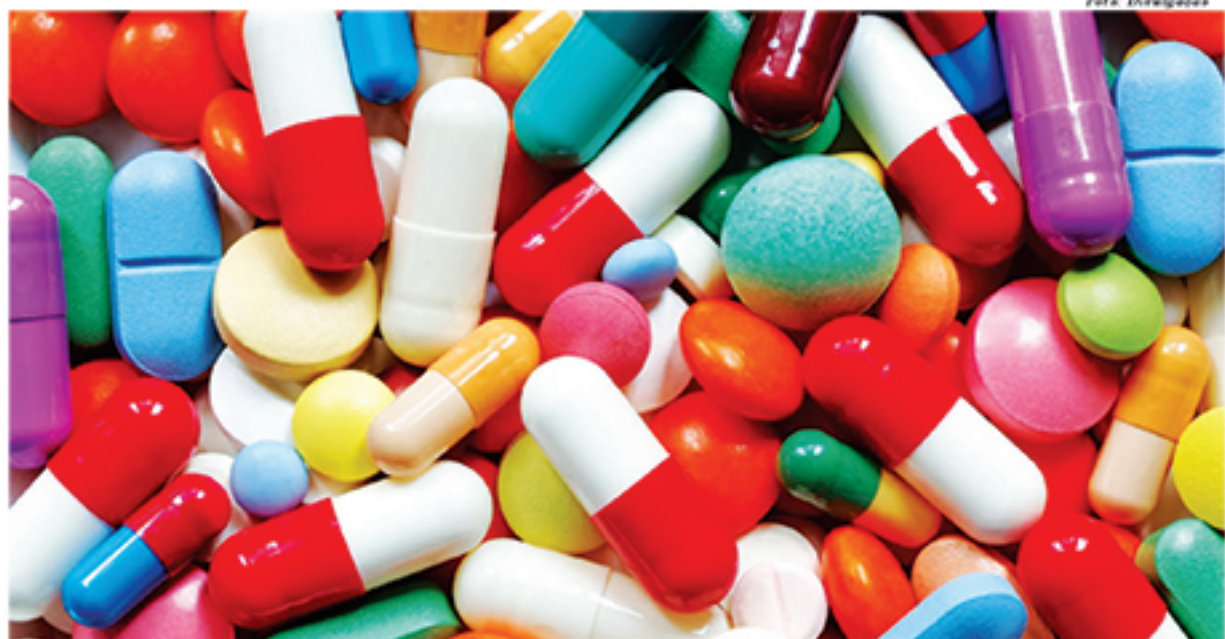
Descentralização de remédios de alto custo visa dar maior comodidade aos pacientes que precisam ter acesso a esse tipo de medicação

Os secretários de Saúde das sete cidades do Grande ABC estiveram no Consórcio Intermunicipal Grande ABC, na última terça-feira (21), para discutir propostas sobre a distribuição descentralizada de medicamentos de alto custo na região. As propostas sobre o tema foram apresentadas a representantes do governo estadual durante o encontro da Comissão Intergestores Regional (CIR). A medida, que já vem sendo debatida há algum tempo, tem como objetivo garantir que os usuários tenham mais comodidade na busca pelos medicamentos, contando com a participação da entidade regional das prefeituras e do governo estadual.