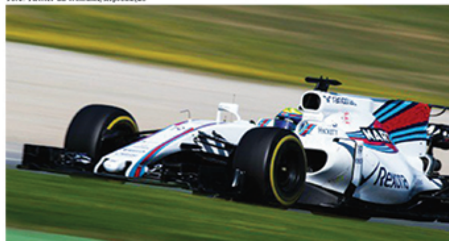
Felipe Massa volta a Williams para mais uma temporada da Fórmula 1