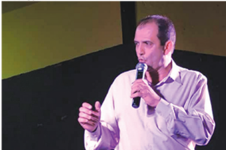
Para Irmão Ozelito, feira noturna no Jardim Itapeva valorizaria o bairro