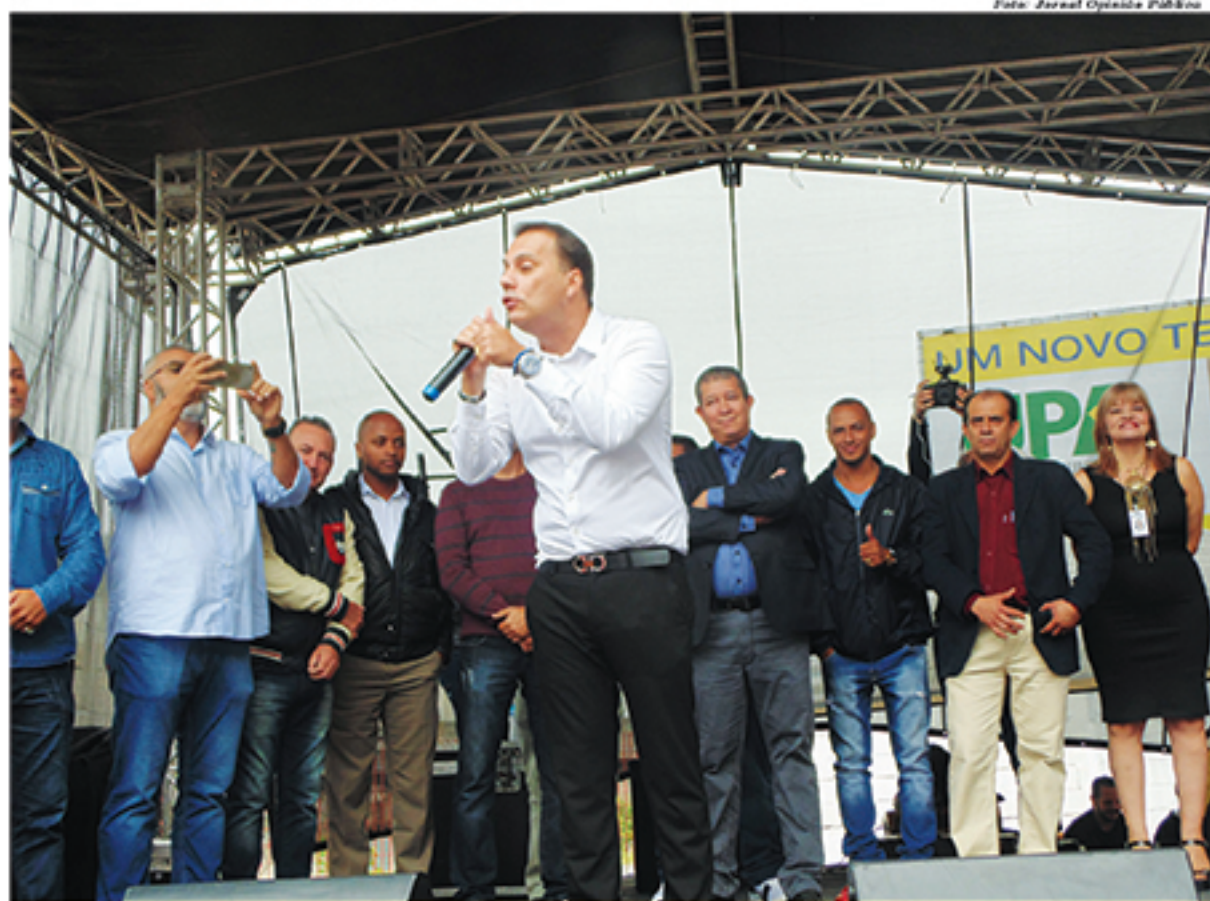
UPA do Jardim Zaira ajudará a desafogar atendimentos em outras unidades da cidade

Outra novidade é a Farmácia 24 horas, que passará a oferecer medicamentos gratuitos, prescritos pelo médico durante o atendimento, a qualquer hora. Além disso, a unidade dispõe de 11 leitos de observação, dois de isolamento e três de emergência. A previsão é de que até 350 pacientes