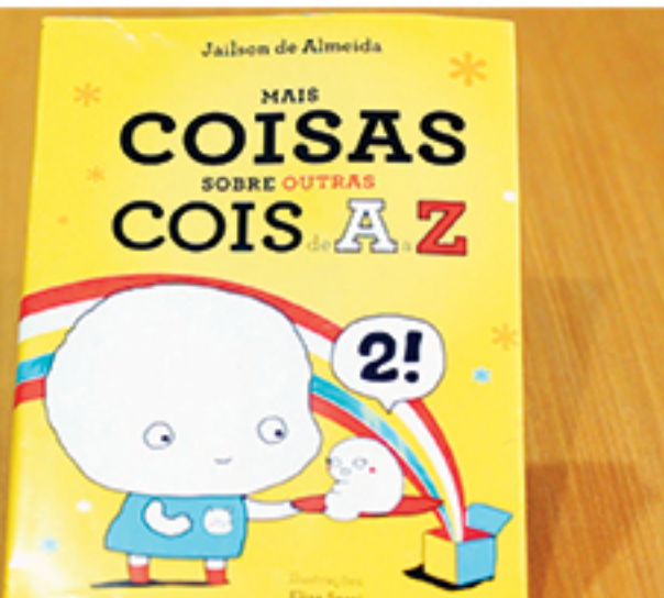
Livros foram doados a escolas públicas, bibliotecas e associações do Grande ABC