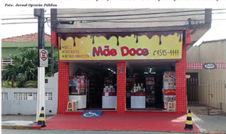
Mãe Doce já se organiza para vendas de Páscoa. Loja terá ofertas de Ovos e chocolate