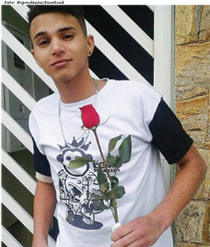
Vinicius descobriu problema que afetou seu intestino fino em 2015 e hoje precisa de um transplante para voltar a viver normalmente

Agência: 001 Conta Poupança: 62425008-3 Nelson do Carmo CPF: 874.251.496-72