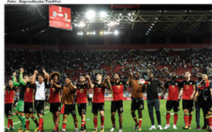
Seleção belga é a sexta garantida na Copa de 2018