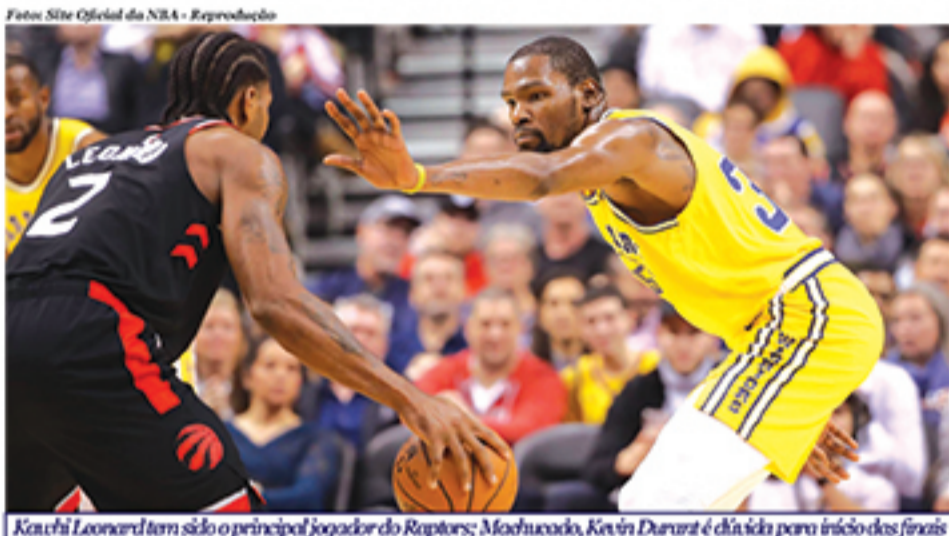
Kawhi Leonard tem sido o principal jogador do Raptors; Maschucado, Kevin Durant é decisivo para início das finais