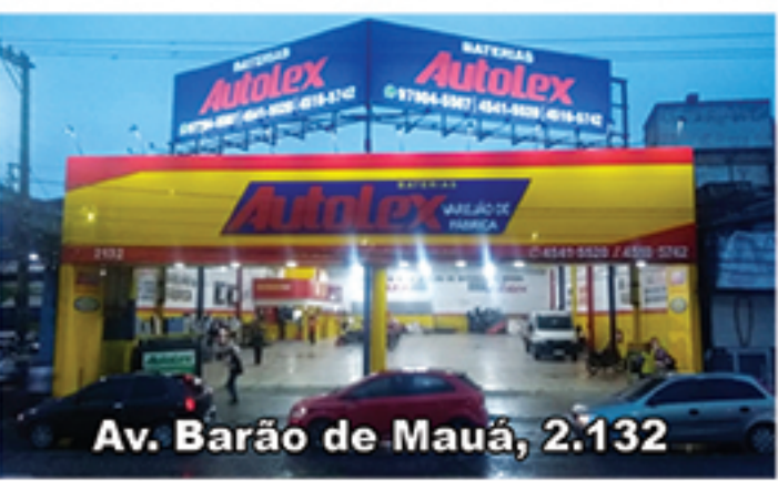
Av. Barão de Mauá, 2.132