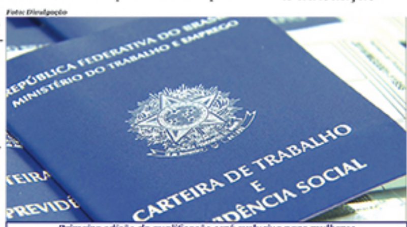
Primeira edição da qualificação será exclusiva para mulheres