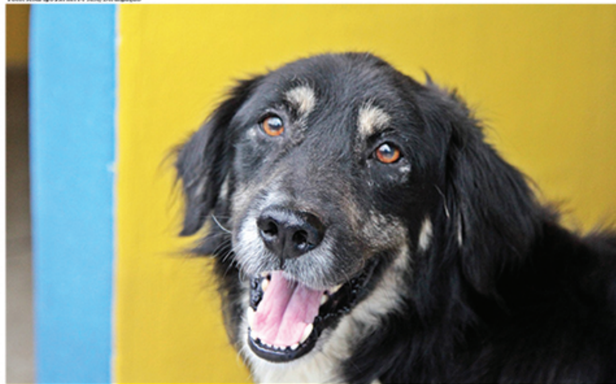
Cachorros e gatos que sofreram abandono estão à espera de um lar permanente