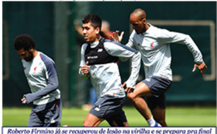
Roberto Firmino já se recuperou de lesão na virilha e se prepara pra final