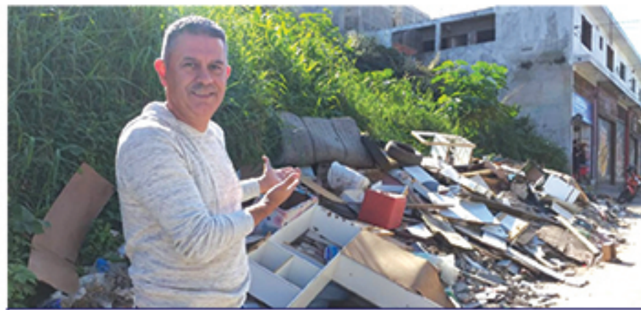
Estrada do Carneiro, em frente ao nº 362, Jardim Elizabeth