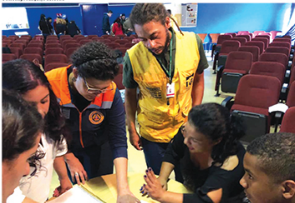
Membros da Defesa Civil Estadual fazem apresentações sobre diversos pontos relacionados a prevenção de desastres