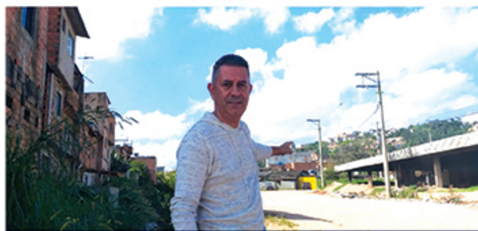
Rua Pernambuco, acesso ao Jardim Pajussara