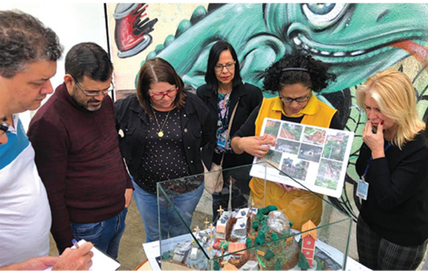
Coordenadoria Estadual de Proteção e Defesa Civil de São Paulo realizou orientação técnica na cidade para educação em redução de riscos e desastres Pág.03

Moradores do Itapeva e equipe da BRK se reúnem para discutir regularização de esgoto