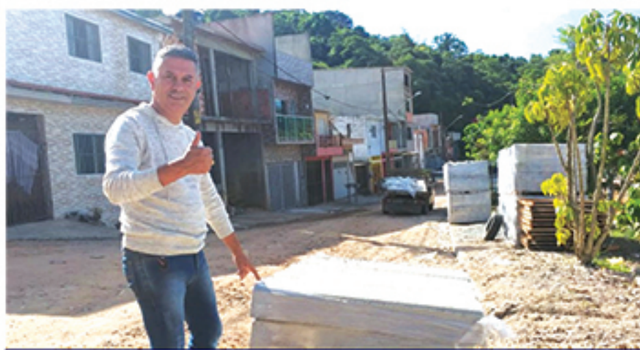
Rua da Paz, Jardim Éden