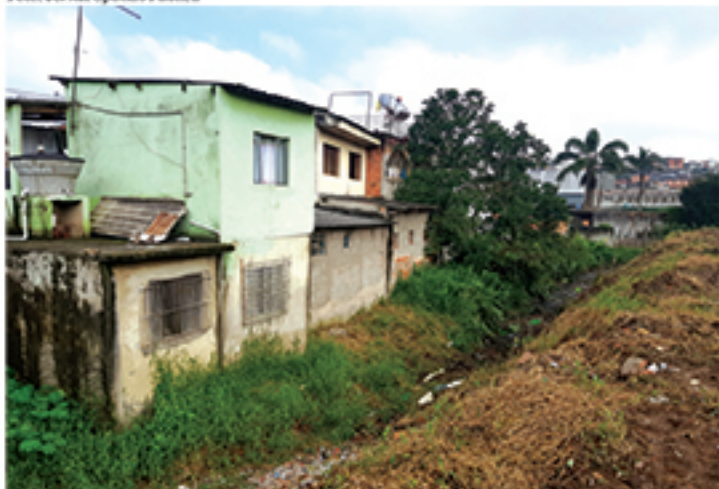
Moradores seguem pedindo regularização de esgoto no Jardim Itapeva