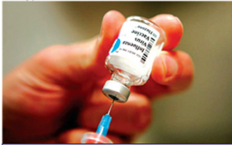
Vacinação contra o vírus influenza termina nesta sexta-feira (31)