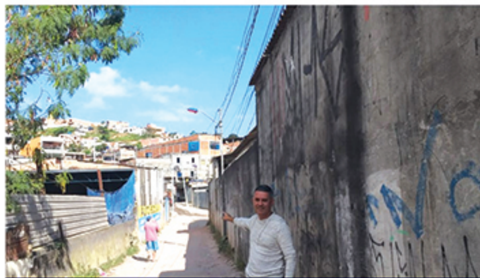
Rua Antenor de Souza Medeiros, Jardim Elizabeth

"É uma vergonha, pois temos contratos superfaturados na Operação Cata-Bagulho e cobramos limpeza na cidade, mas mesmo assim nota-se o descaso da administração do prefeito anterior, que causou um grande rombo no caixa e da atual prefeita que parece se isentar de responsabilidade. Vou trabalhar para acabar com essa pouca vergonha, essa bandalheira e troca de favores que existe na Prefeitura, vou fiscalizar de perto, igual faço atualmente e levar ao conhecimento das autoridades", criticou.